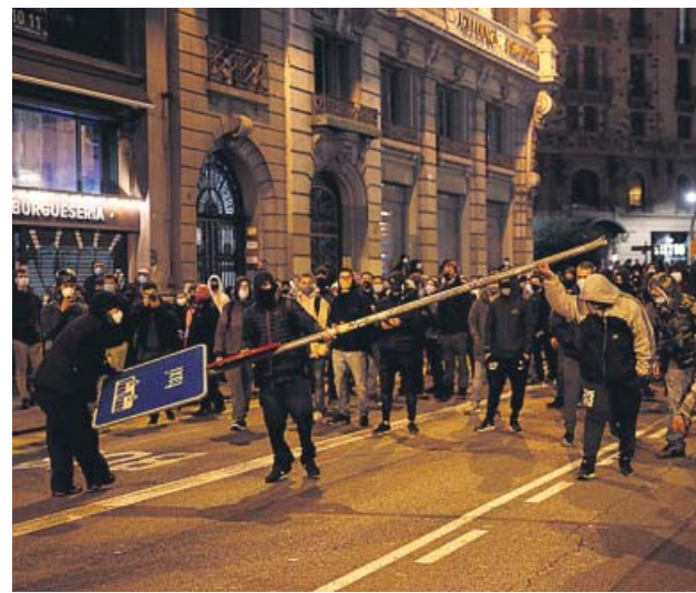
Varios manifestantes rompen mobiliario urbano.

Unos y otros señalan que es mejor «legislar en frío», a pesar de que el origen de esta reforma legal es la «presión social» por el manifiesto de representantes de la cultura difundido hace dos semanas para deplorar la entrada en prisión de Pablo Hasel. Tras los disturbios y la confirmación de otra condena al rapero por amenazas, el Gobierno se repliega y apunta a una reforma sosegada. Se habla de «desligar» los «incidentes graves» de la última semana de la acción del Gobierno. Justicia da una respuesta más técnica: «No se puede gobernar a golpe de noticias» y los juristas «están haciendo el trabajo seriamente». ●