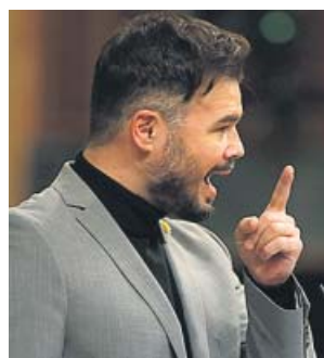
Gabriel Rufián, portavoz de ERC en el Congreso.

Quien sí ha confirmado públicamente su asistencia, además del PSOE, el PP, Vox y Ciudadanos, es Unidas Podemos, que apoyó la celebración de este aniversario en la Mesa del Congreso. La presencia del