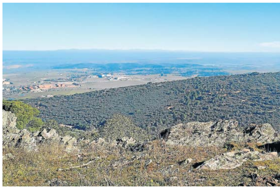
Bajo estas tierras de la Sierra de la Mosca hay un gran yacimiento de carbonato de litio.