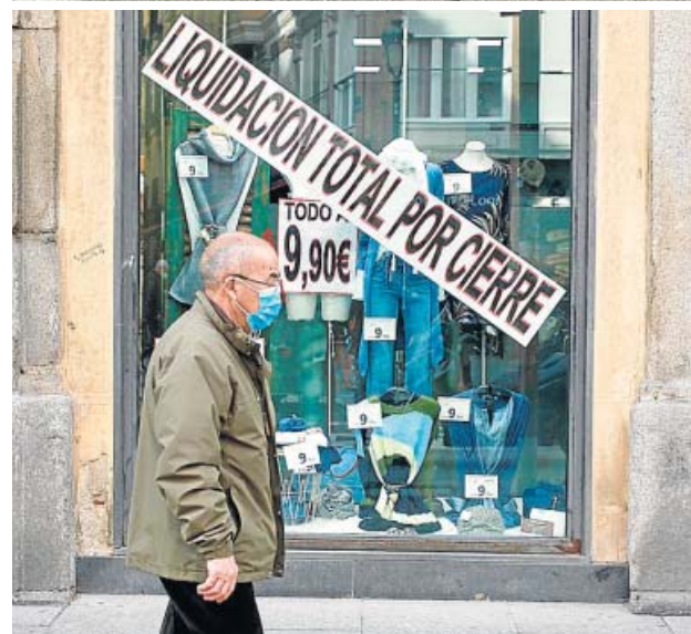
Han aumentado los casos administrativos por multas y los laborales por los ERTE o por cierres de locales. JORGE PARÍS