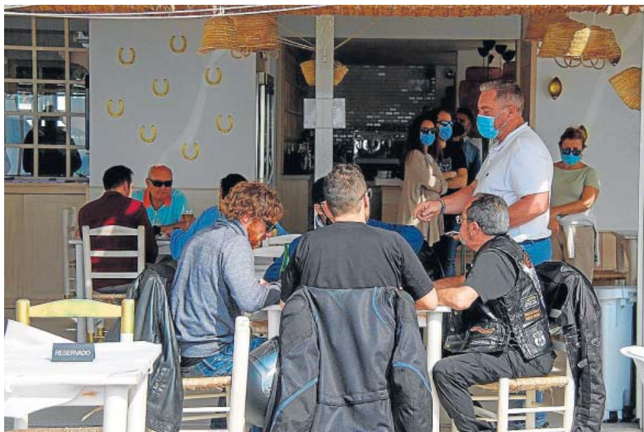
Vista de un chiringuito en la playa granadina de Motril este fin de semana.

En este sentido, Cádiz fue ayer la provincia que más muertes notificó (12), seguida de Sevilla (10), Málaga (7), Granada (5), Huelva (2) y Jaén, Almería y Córdoba (1 cada una). Sevilla, por ejemplo, vio cómo se reducían una vez más