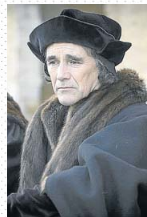
Mark Rylance interpreta a Thomas Cromwell.

El Thomas Cromwell al que interpreta Mark Rylance es un hombre de orígenes humildes que asciende a lo más alto a base de celo en su deber: no es culpa suya que dicho deber sea cumplir los deseos de un tirano (Damian Lewis) a través de medios inenarrables.