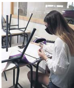
Una joven consulta los apuntes durante una clase.

El documento recogía entonces que se debía ventilar «con frecuencia» las instalaciones del centro educativo durante, al menos, unos 10-15 minutos al inicio y al final de la jornada, durante el recreo y, siempre que sea posible, entre clases, «manteniéndose las ventanas abiertas todo el tiempo que sea posible y con las medidas de prevención de