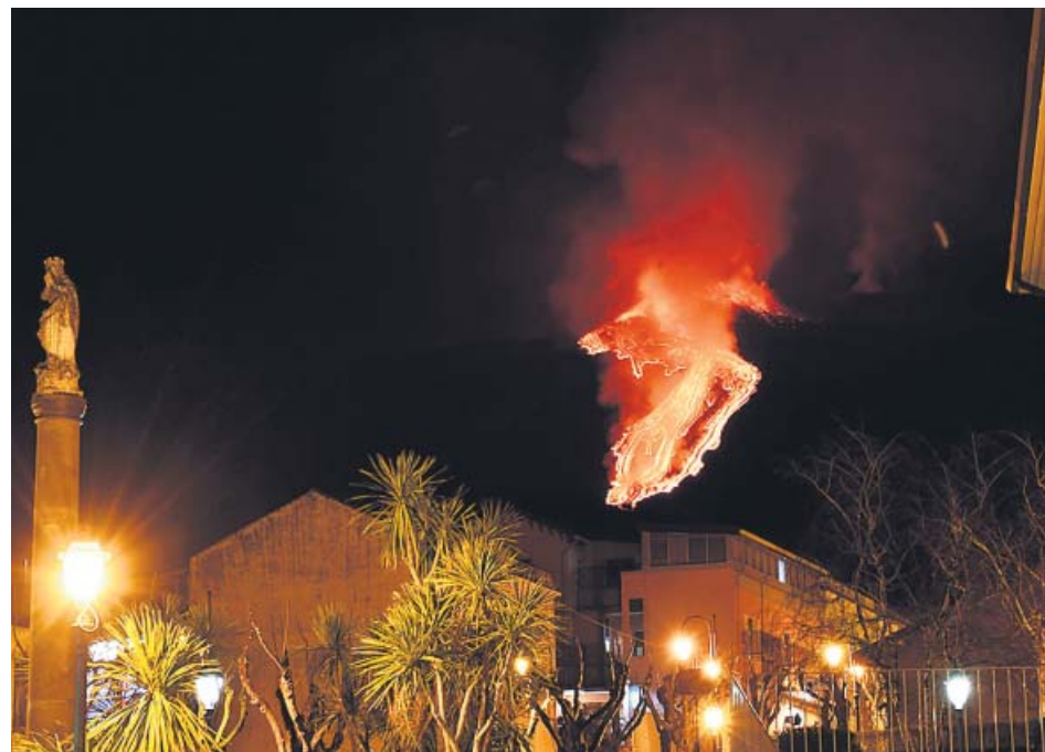
La visión desde Milo de las laderas del Etna era sencillamente aterradora.

La Policía Local de Silla (Valencia) liberó este fin de semana a un hombre que llevaba tres meses retenido en una casetta por otro que pretendía vaciarle su cuenta bancaria y que ya le había sustraído 6.000 euros.