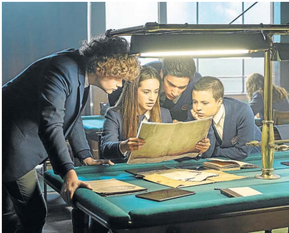
Los protagonistas conviven en un centro para alumnos problemáticos.