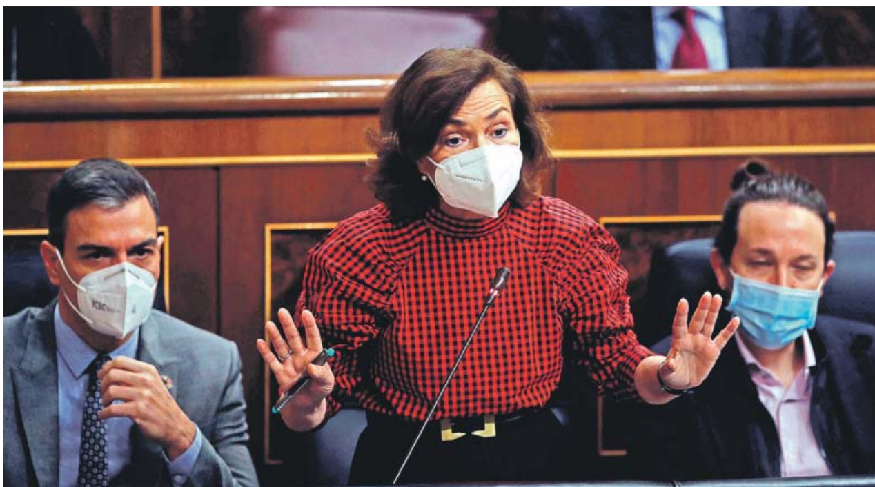
La vicepresidenta primera, Carmen Calvo, junto al presidente Pedro Sánchez y el vicepresidente segundo Pablo Iglesias.

LAS LEYES de igualdad crispán la relación entre los socios y abren la puerta a choques de mayor intensidad