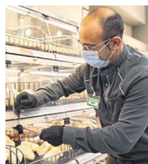
Empleado de la cadena Mercadona.

muy orgullosa por ello. «Han sabido garantizar la apertura todos los días de nuestros más de 1.600 supermercados en España y Portugal, que no habría sido posible sin el talento y el esfuerzo diario de todas y cada una de las trabajadoras y trabajadores que formamos la compañía y sin su compromiso para entregar los pedidos online en los momentos tan difíciles que estamos viviendo», ha señalado.