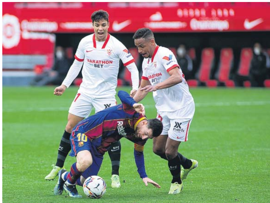
Leo Messi presionado por Fernando y Oliver Torres en el partido del pasado sábado.

Cuando el conjunto hispalense se llevó el primer partido de las semifinales con un más que interesante 2-0 como local, se convirtió automáticamente en el claro favorito para alcanzar la final que se disputará en La Cartuja el domingo 17 de abril. Vivían los de Julen Lopetegui su mejor momento, con varias victorias