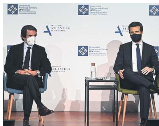
Aznar y Casado, ayer en la Universidad Francisco de Vitoria.