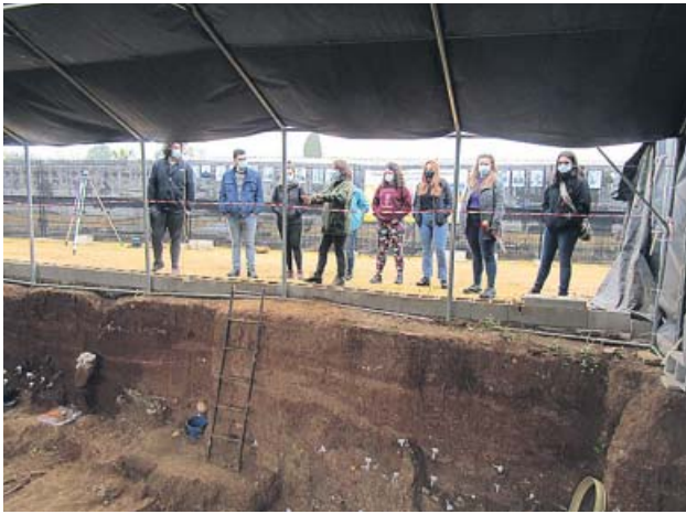
Un grupo visita la fosa de Pico Reja.