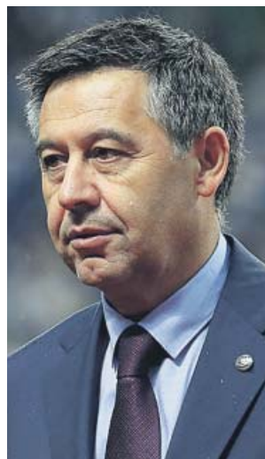
Bartomeu, en una fotografía de archivo.

●●● Julen Lopetegui no quiso polemizar sobre la designación para el partido del colegiado murciano José María Sánchez Martínez, el mismo árbitro que dirigió la vuelta de las semifinales de la Copa de la temporada 2018/19... tras haber ganado el Sevilla al Barça también por 2-0. En aquella ocasión, un más que discutible penalti señalado por el murciano sobre Leo Messi abrió el camino de la remontada del Barcelona, que acabó ganando el partido 5-1, alcanzando así la final copera y dejando fuera al Sevilla. «A las semifinales hemos llegado los cuatro mejores de la Copa, no tengo duda ninguna de que en cuanto al arbitraje, también es así», dijo el vasco.