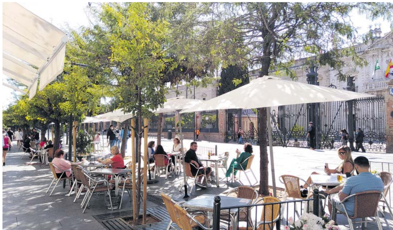
Veladores de un bar de la calle San Fernando.

En concreto, solo el distrito Norte permanece en el nivel 4 grado 1, a excepción de El Castillo de las Guardas, que sigue en ese mismo nivel, pero en grado 2, situación que afecta a un total de 32 localidades de Se-