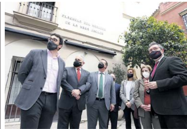
El Marqués de la Vega Inclán ya tiene una plazuela en el barrio de Santa Cruz