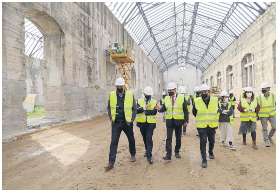
Visita del alcalde, Juan Espadas, a las obras en las Naves de Renfe.

El pasado mes de enero arrancó la tercera y principal fase, con un presupuesto de 2,5 millones de euros: la adecuación de la nave oeste y su conversión en un centro de emprendimiento a través de unos módulos de madera. Para finales de año, quedan las dos últimas etapas: la instalación de placas solares y la im-