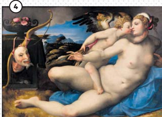
➔ 'Venus besada por Cupido' Obra de Hendrick van den Broeck a partir de un dibujo de Miguel Ángel. Es un óleo sobre tabla, de medidas 120 x 195 cm. De 1550-1570. Nápoles, Museo e Real Bosco di Capodimonte. Es uno de los préstamos más relevantes de la exposición.