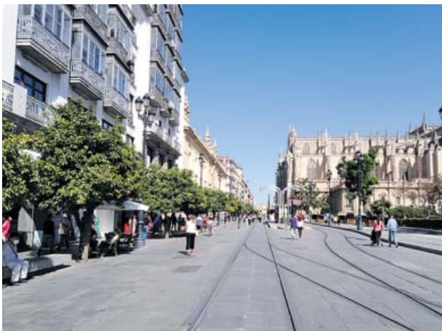
Avenida de la Constitución.