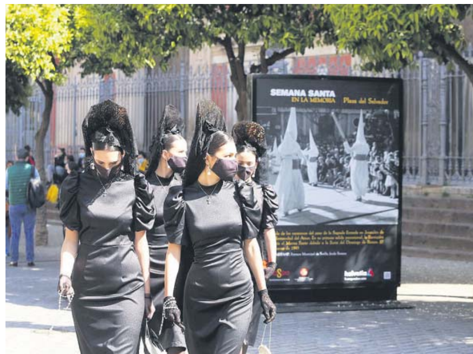
Cuatro mujeres vestidas de mantilla en la plaza del Salvador, en la presentación del evento.

La mantilla. Sevilla, del dolor a la alegría es el nombre que el Ayuntamiento ha dado al proyecto que pondrá en valor «un atuendo tan sevillano» como es la mantilla. El objetivo es reactivar los sectores que dependen de las Fiestas de la Primavera, canceladas por segundo año consecutivo. En colaboración con la agencia Doble Erre, habrá una performance de moda, desfiles en coches de caballos, una nuestra fotográfica o una masterclass para aprender a ponerse la mantilla. ●