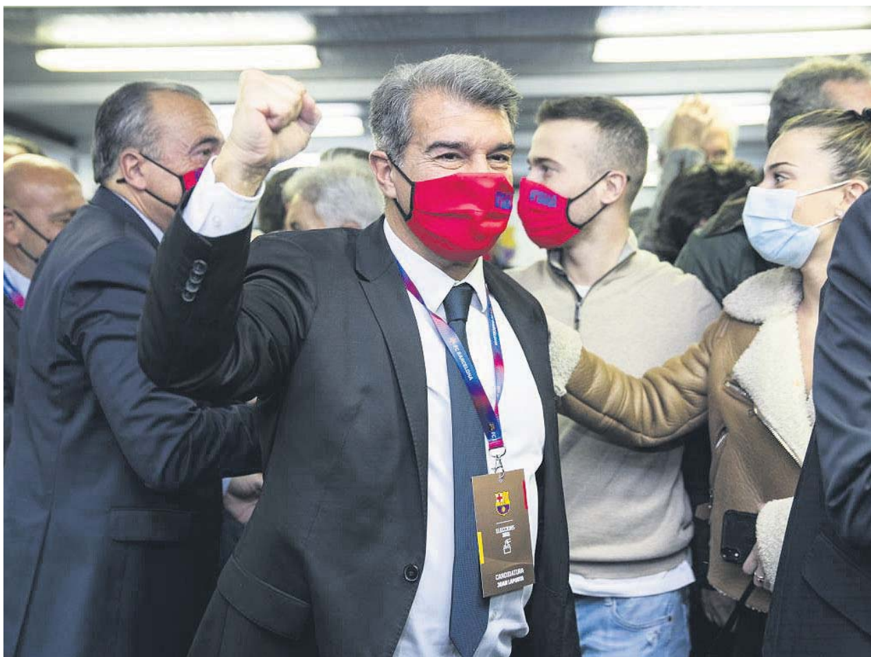
Joan Laporta el día de las elecciones al FC Barcelona.