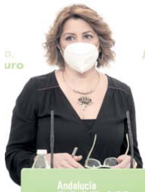
La secretaria general del PSOE-A, Susana Díaz. PSOE-A

Ahora, afirmó, lo que toca es centrar «todo el talento, el esfuerzo y la energía» en la pandemia, porque «la gente está sufriendo muchísimo» en esta crisis, y el PSOE-A, señaló, está también trabajando, manteniendo reuniones con diversos colectivos para «poner las bases del futuro, de la Andalucía nueva que nos va a quedar» tras la pandemia, que debe ser «la de la igualdad de oportunidades» que el Go-