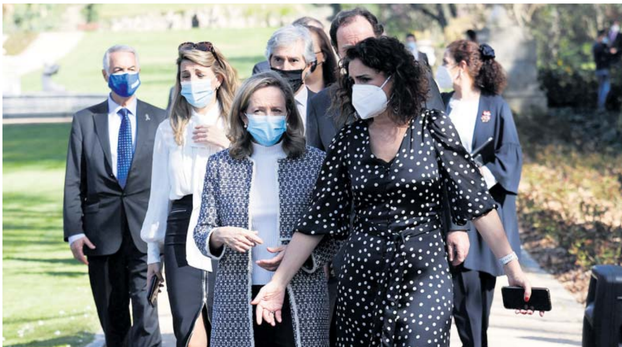
La actual ministra de Trabajo, Yolanda Díaz, camina detrás de la vicepresidenta Calviño y la ministra de Hacienda, M.ª J. Montero.

EL PRESIDENTE alega que no debe anteponerse la vicepresidencia social a la económica. IGLESIAS pedía que Díaz ocupara el puesto que él dejara para cumplir el acuerdo de coalición. LA CARTERA de Derechos Sociales y Agenda 2030 será para Ione Belarra