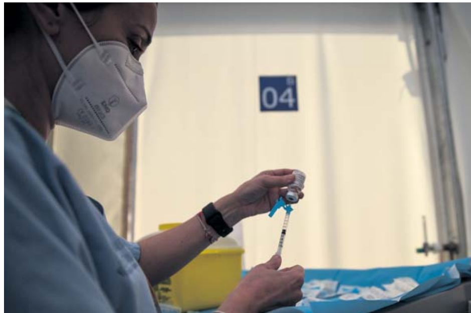
Una profesional sanitaria, con una jeringuilla y un vial de la vacuna de AstraZeneca en Valencia.

El Reino Unido, que ya ha inyectado a más de 10 millones de personas la vacuna de AstraZeneca, desarrollada por la