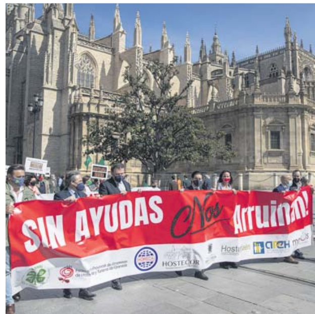
Manifestación en Sevilla a su paso por la Avenida, ayer.

Además, el sector destacó que «han mantenido desde el