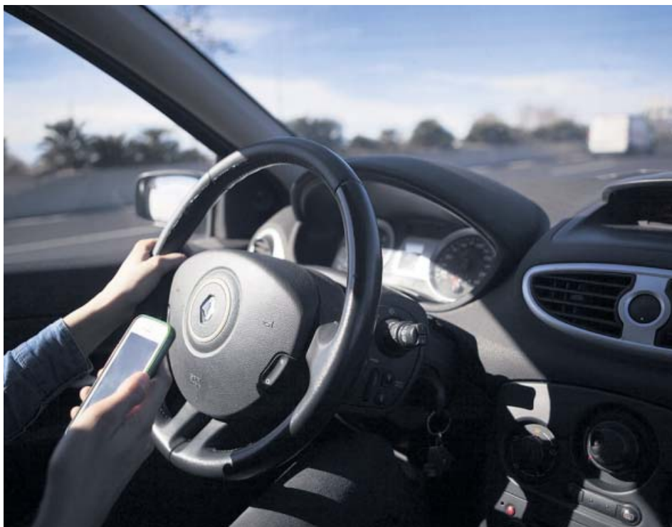
Sostener el teléfono al conducir supondrá perder seis puntos del carné.

20 minutos es líder a absoluto en difusión, con 160.000 ejemplares diarios. En sus cuatro ciudades (Barcelona, Madrid, Sevilla y Valencia), 100 repartidores lo entregan en mano a sus lectores cada día y, además, se puede encontrar en 1.350 establecimientos. Si no has conseguido tu ejemplar, regístrate gratis y léelo en la web.