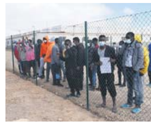
Inmigrantes en un centro de acogida en Fuerteventura.

De esta forma, cambia la tendencia a la baja experi-