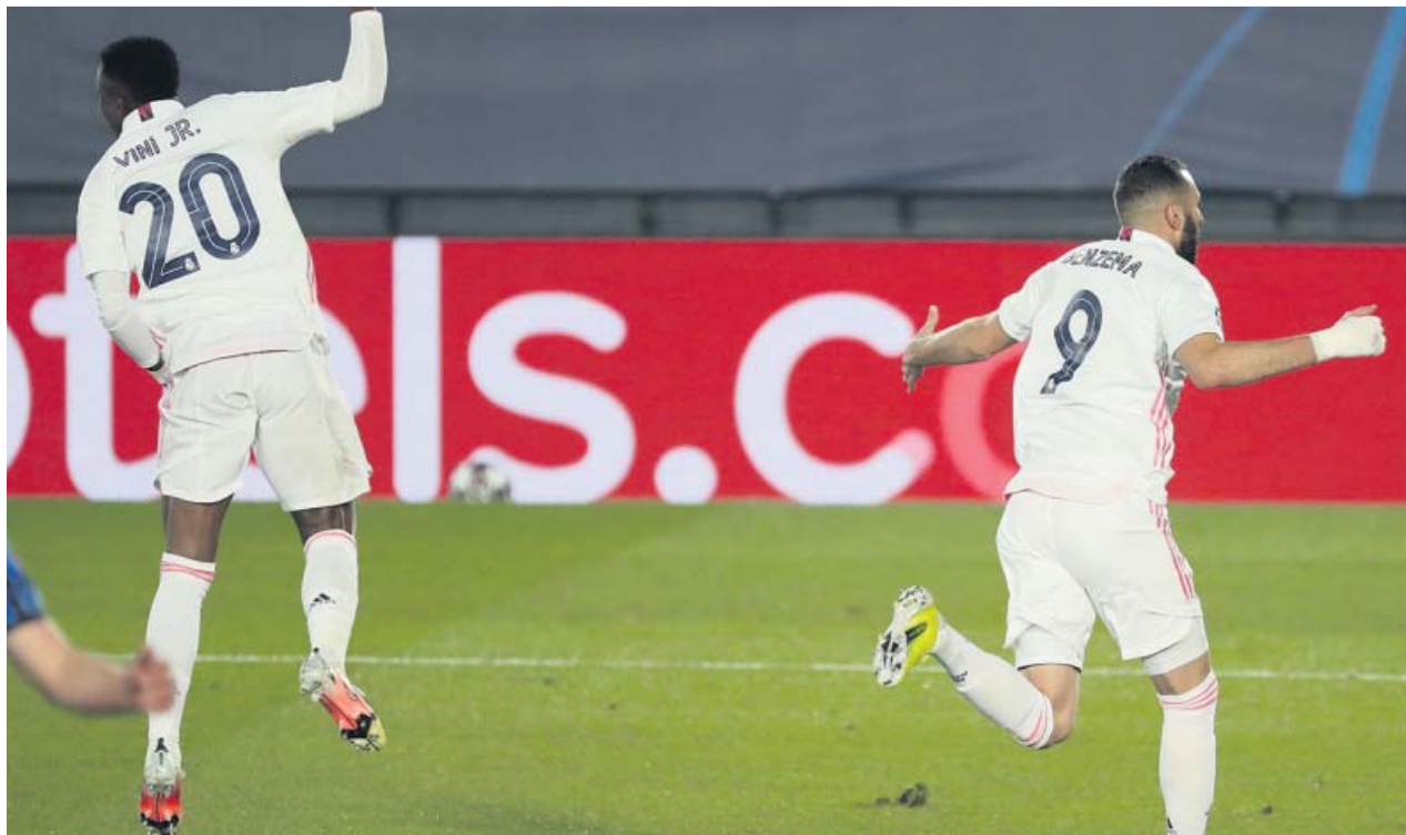
Vinícius y Karim Benzema celebran el primer gol del partido, obra del galo.

EL REAL MADRID ganó al Atalanta de nuevo con una gran actuación de su pareja de delanteros SUPERÓ LOS OCTAVOS de final de la Champions por primera vez desde 2018, cuando se fue Cristiano MARCO ASENSIO hizo el gol de la sentencia nada más salir al campo. El Real Madrid apenas sufrió