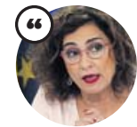
MARÍA JESÚS MONTERO Ministra de Hacienda y portavoz del Gobierno

«No hay prevista ninguna circunstancia diferente a agotar esta legislatura. Continuaremos avanzando juntos»