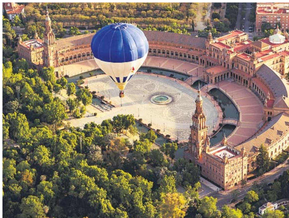
Uno de los globos sobrevuela, ayer, la emblemática plaza de España de Sevilla.

Cinco parejas de globos aerostáticos sobrevolaron ayer los cielos de la capital hispalense en el inicio de la semana grande de la Feria de Abril, sujeta por segundo año consecutivo a las restricciones impuestas por la pandemia del coronavirus. A pesar de las limitaciones, el ingenio de los sevillanos supo sobreponerse y sus calles y cielos lucen engalanados para la ocasión. Los globos, eso sí, tuvieron que retrasar a ayer su recorrido ante las brumas del sábado, cuando estaba prevista la cita. ● R. C.