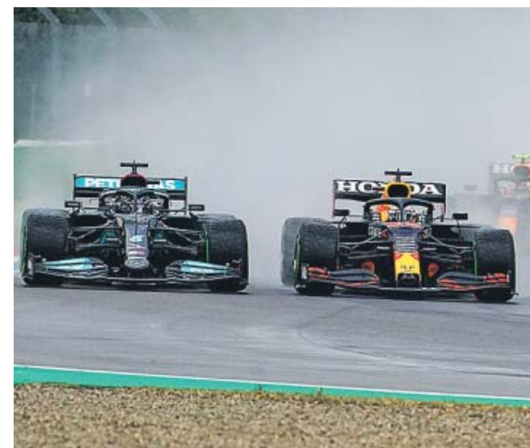
Verstappen adelantó a Hamilton en la salida.