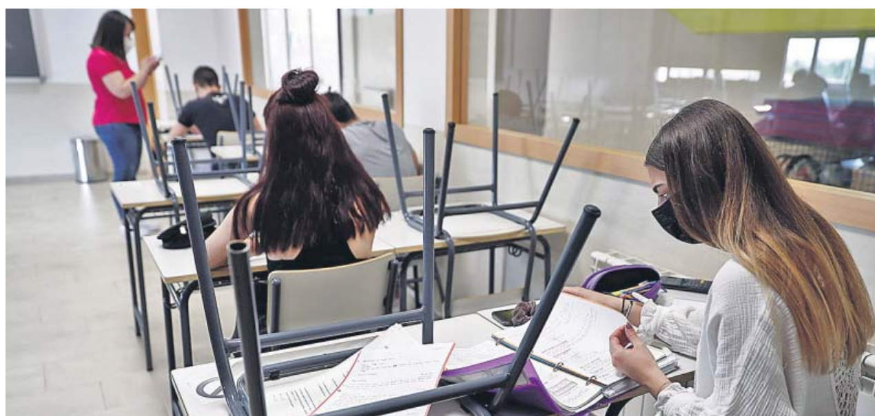
Alumnos en un aula de un centro educativo de Madrid.