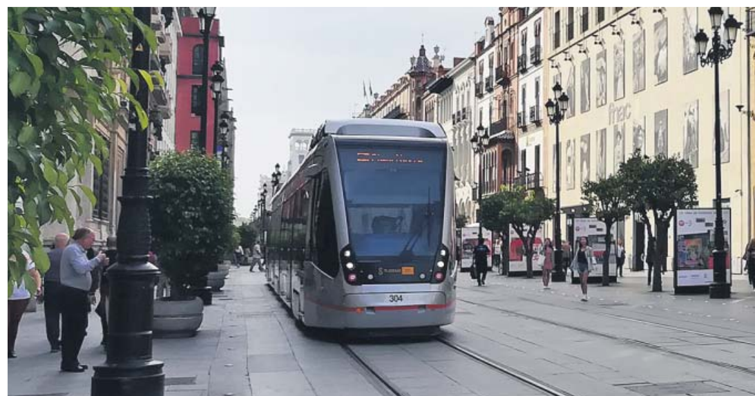
Arriba, coches y autobuses circulando por la Avenida dos meses antes del inicio de las obras, en 2006.

que las peatonalizaciones de Sevilla, algunas más que otras, tuvieron en su día una fuerte oposición por parte de comerciantes, vecinos y taxistas, que consideraban que el cierre al tráfico supondría la «muerte» de estas calles y de los negocios. El tiempo, en cambio, ha demostrado lo contrario, y ejemplo de ello es la revalorización del metro cuadrado que se registró en estas vías después de su peatonalización. Una tendencia que ahora, como consecuencia de la pandemia, se está invirtiendo.