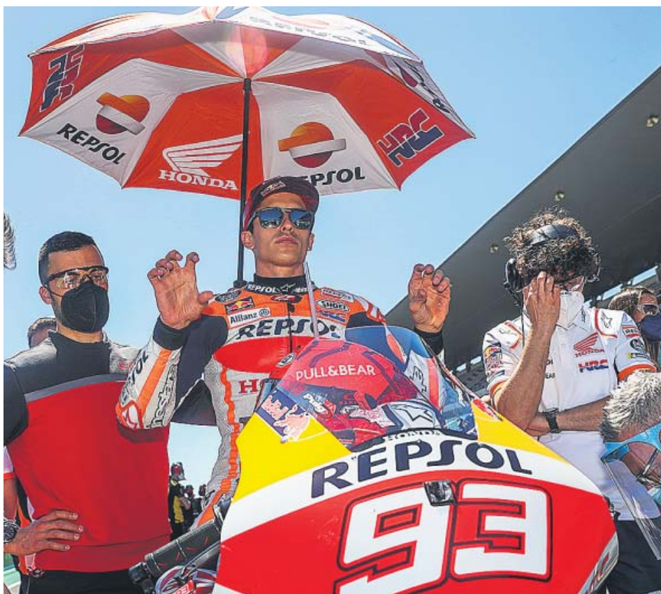
Marc Márquez, durante el GP de Portugal de motociclismo, en el circuito de Portimao.

EL CATALÁN , séptimo, disputó una carrera oficial nueve meses después y acabó llorando ENORMES TRIUNFOS de Raúl Fernández y Pedro Acosta en Moto2 y Moto3