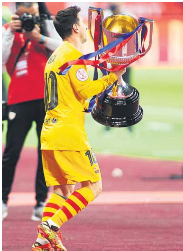
Leo Messi con la Copa del Rey conquistada en Sevilla.

La llegada de Joan Laporta a la presidencia del FC Barcelona ha supuesto para el barcelonismo la esperanza de que