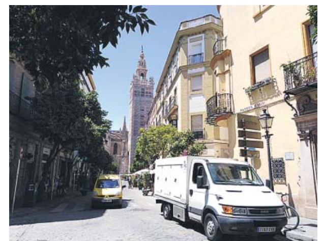
Cruce de Mateos Gago con Rodrigo Caro, arriba ya peatonal; y abajo, cuando aún circulaban coches.

Plaza de la Magdalena, donde quedará prohibido el tráfico rodado y se eliminarán las paradas de Tussam y de motos y la carga y descarga, con la implantación de arbolado y zonas ajardinadas y nuevo mobiliario urbano, con la fuente central como eje de la plaza.