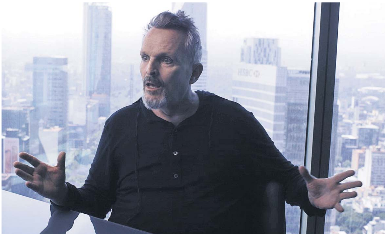
Miguel Bosé, durante la segunda parte de su entrevista en el programa Lo de Évole . LA SEXTA