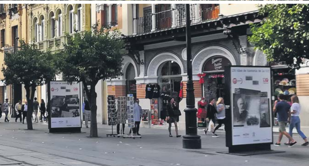
Abajo, el tranvía a su paso por la calle ya peatonalizada.