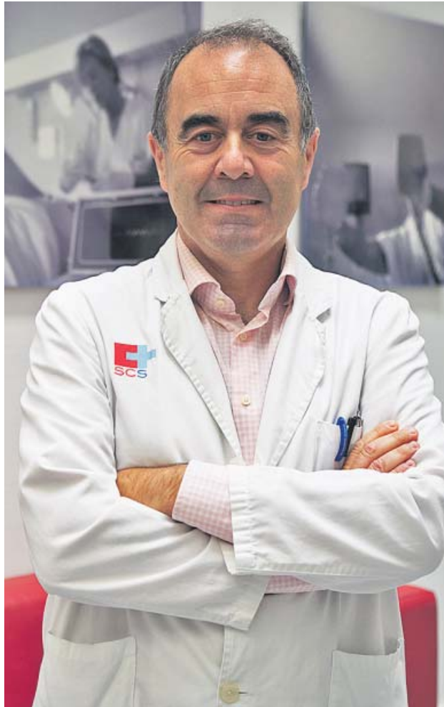
SOCIEDAD ESPAÑOLA DE INMUNOLOGÍA

A pesar de ello, avisa de que las vacunas no han frenado una cuarta ola que se deja ver en todas las comunidades. Sobre