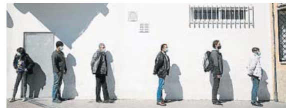
Colas en los bancos de alimentos.

«La pandemia está teniendo graves consecuencias, hasta el punto de que millones de personas no pueden cubrir sus necesidades más básicas y se ven obligadas a acudir a los bancos de alimentos. Lo que más debería contagiarse es la solidaridad y, por eso, reforzamos nuestro compromiso con las entidades sociales impulsando de nuevo esta campaña tan