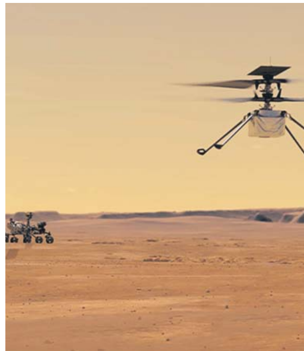
El helicóptero Ingenuity sobrevolando la superficie de Marte, cuya atmósfera en superficie es un 1% la de la Tierra.

Poco después, la primera aeronave humana en Marte movió sus pequeñas palas por primera vez y giró a 50 revoluciones por minuto (rpm) en preparación para el primer vuelo por control remoto. Las palas de Ingenuity están hechas de un núcleo de