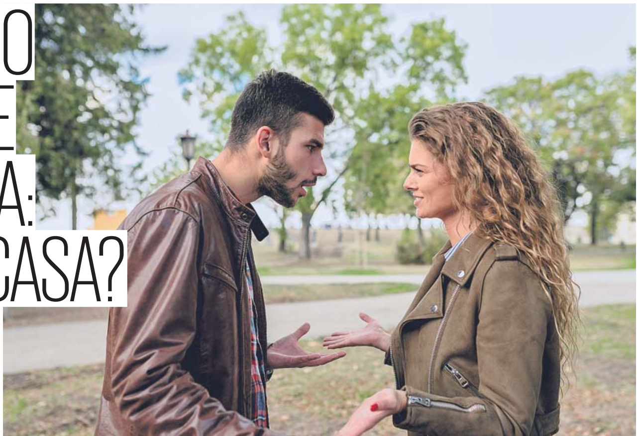
Una pareja mantiene una discusión en un parque.

El banco puede promover una ejecución y quedarse con la vivienda si se deja de pagar la totalidad de la hipoteca