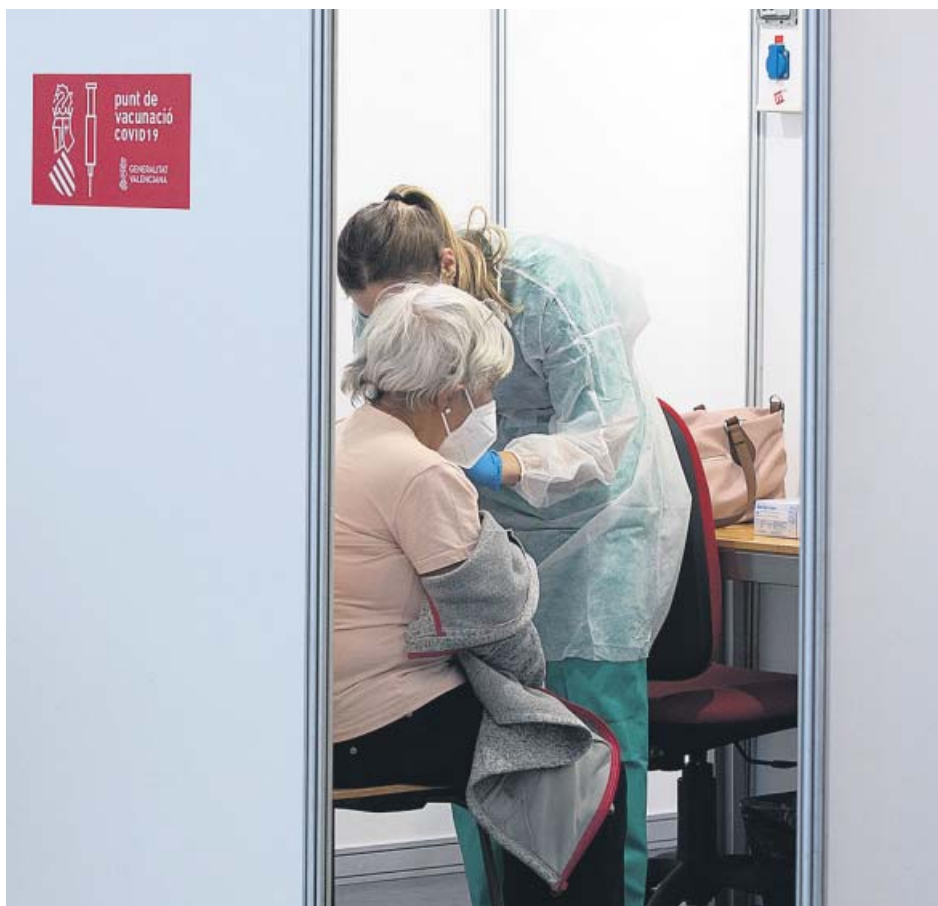
Una sanitaria vacunaba ayer a una señora en el Auditorio de Castellón.

Ahora España estudia esta medida para las vacunas de Moderna y Pfizer. De esta segunda farmacéutica llegaron ayer otros 1,2 millones de dosis, y se