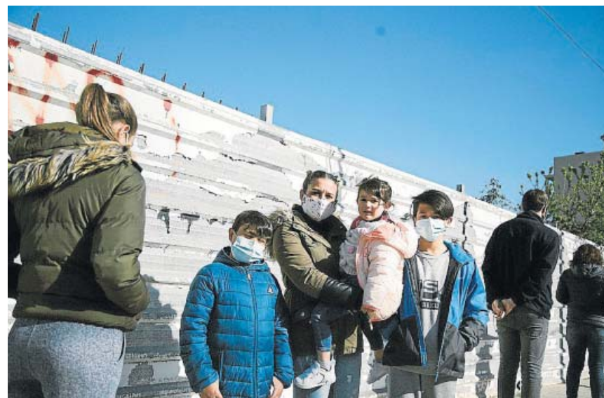
Una madre con tres niños hace cola para recoger ayuda de un banco de alimentos.

En los hospitales, aunque han vuelto a aumentar los pacientes, lo han hecho en menor medida que el lunes pasado: hay 10.447 ingresados por Covid (659 más que el viernes), de los que 2.276 se encuentran críticos en cuidados intensivos (96 más). La presión sobre las UCI se sitúa en el 22,4% de las camas ocupadas, con Madrid y La Rioja por encima del 40%. ● J. M.