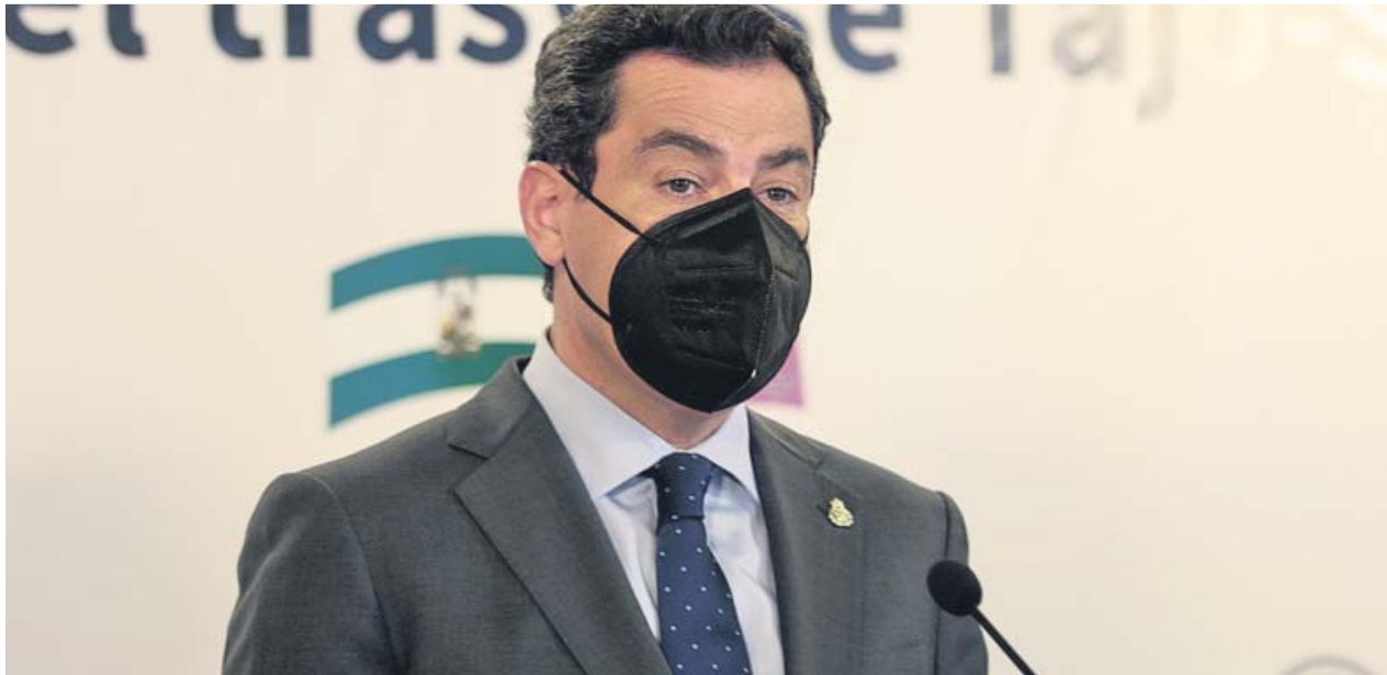
El presidente de la Junta, Juanma Moreno, en un acto celebrado ayer en Almería.