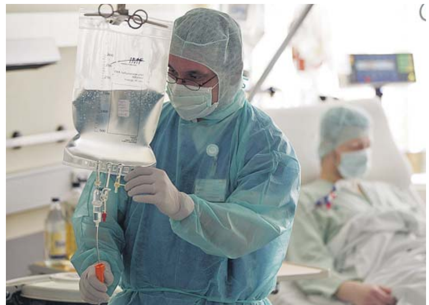
En España hay 64.000 personas con tratamiento de diálisis por esta dolencia.

Antes de esta fecha, en diciembre, está previsto que se celebre el congreso regional ordinario y los partidarios de Espadas y críticos con Díaz quieren que adelantar todavía más la celebración de primarias. ●