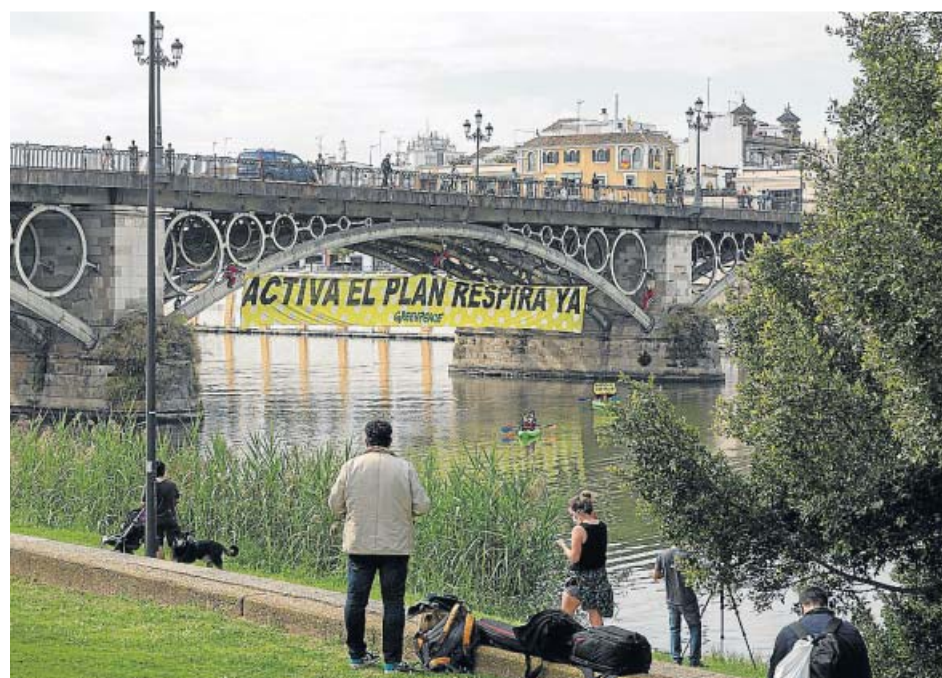
Pancarta descolgada por el colectivo de Greenpeace en el puente de Triana, ayer.

Greenpeace apuesta por un Plan Respira que «no sea un coladero», que contemple las alegaciones presentadas por el colectivo y otras entidades y que «realmente restrinja el acceso al tráfico de vehículos a motor del centro y Triana», las zonas que reciben mayor