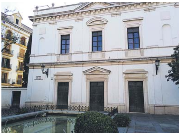
Una de las fachadas de la iglesia de San Hermenegildo. B. R.