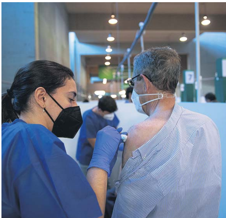
Un hombre es inoculado con la vacuna de Pfizer en el Estadio de la Cartuja.

Según los últimos datos de la Consejería de Salud y Fam-