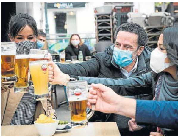
EDMUNDO BAL (CIUDADANOS)

La candidata popular visitó el Centro de Procesamiento y Difusión de Datos habilitado por la Comunidad de Madrid en Ifema. El resto de la jornada lo dedicó a «pasar tiempo en familia», descansar y pasear por Madrid.