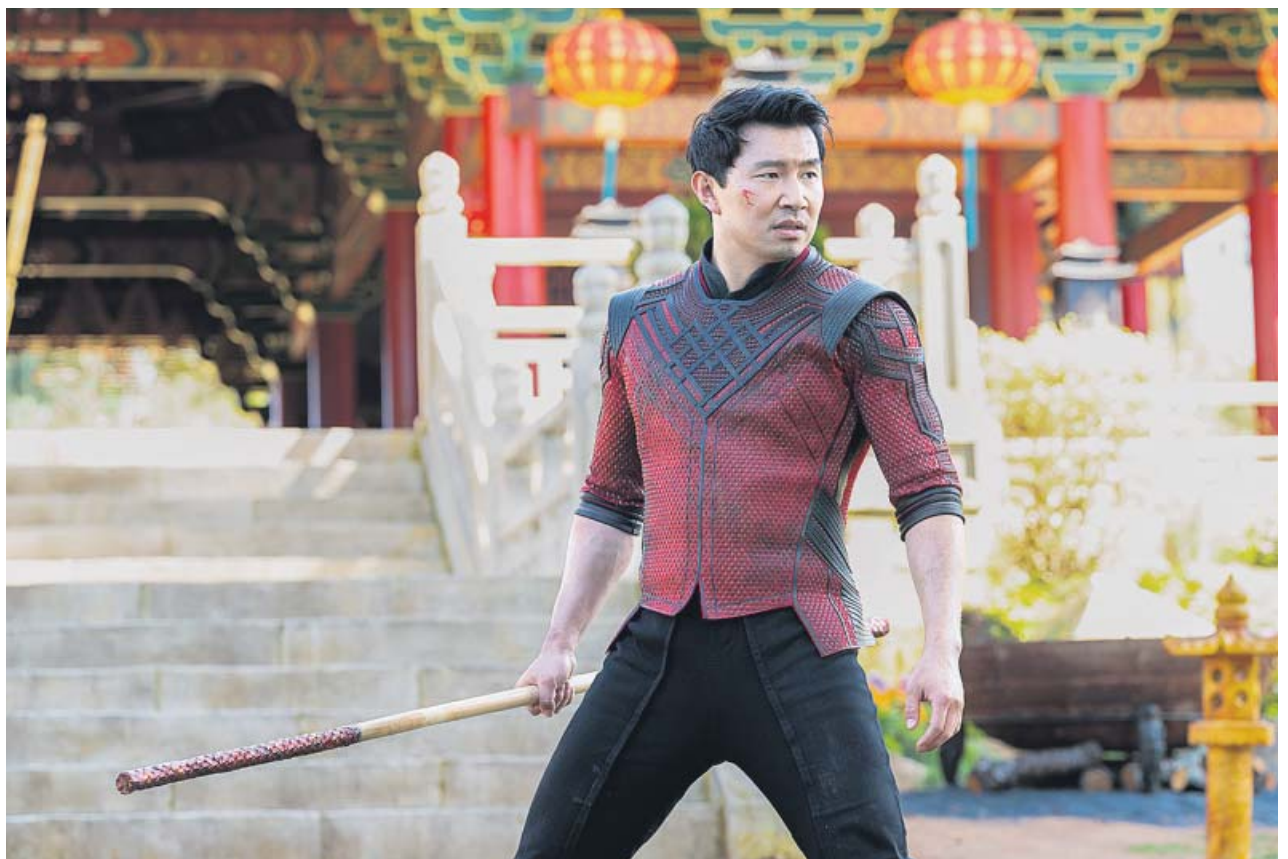
Shang-Chi y la leyenda de los Diez Anillos llegará a las salas en septiembre de este año.

Marvel Studios avanzó ayer imágenes y fechas de estreno de una decena de títulos. Tras sucesivos aplazamientos, Marvel reactiva su calendario con la esperada Viuda Negra de Scarlett Johansson, que se estrenará