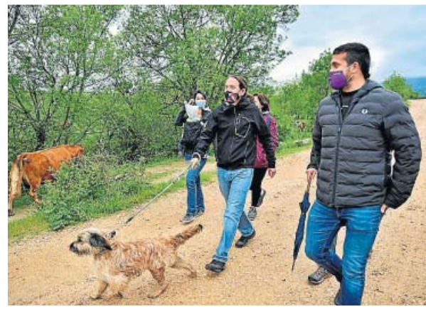
PABLO IGLESIAS (PODEMOS)

«Un día más en la sierra de Madrid, recargando pilas para lo que viene», escribió en su cuenta de Twitter, junto a esta imagen en la que se relajaba en algún rincón de la sierra madrileña. También paseó por el parque del Retiro con miembros de su candidatura.