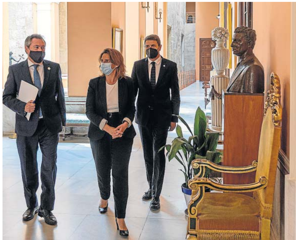
Espadas (i), la ministra Ribera y el delegado del Gobierno en Andalucía, Pedro Fernández.

19,6 MILLONES de euros de fondos europeos han sido concedidos al Ayuntamiento a través del IDAE SE DESTINARÁN a la obra civil y la compra de instalaciones para la primera fase de la prolongación EMASESA destinará otros 13 millones a la construcción de corredores verdes y un nuevo colector LA LICITACIÓN de las actuaciones será en «próximas semanas» para su posterior adjudicación