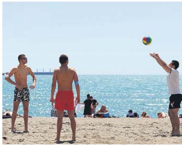
Tres jóvenes juegan con un balón en una playa de Málaga.

Tárrago explicó también que la Fiscalía Superior de Andalucía no actuará de oficio ante las posibles restricciones que imponga la Junta, sino que lo hará cuando le llegue algún escrito solicitando su impugnación. En cualquier caso, señaló, están a la espera de si la Fiscalía General del Estado da algunas «directrices concretas» a las fiscalías de las comunidades para que los pronunciamientos ante determinadas medidas