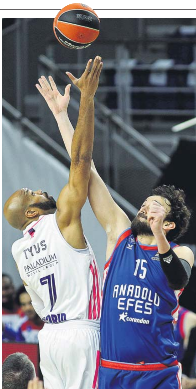
Real Madrid y Barcelona llegan a uno de los partidos más importantes de la temporada.