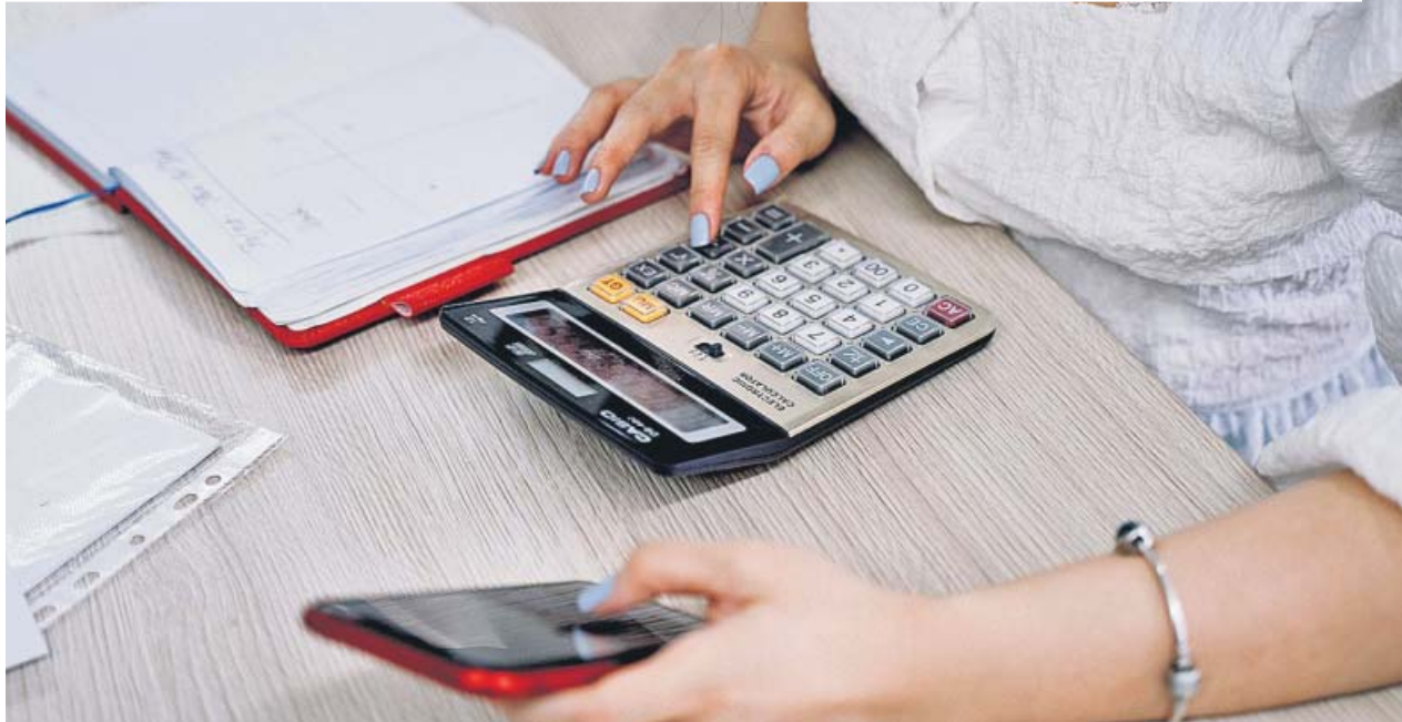
Una mujer calcula el dinero que le adeudan sus inquilinos.