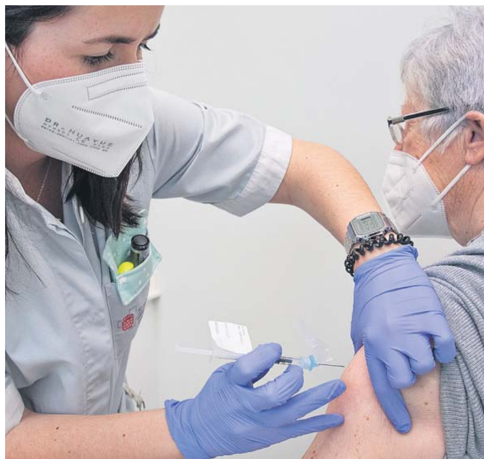
Una paciente de alto riesgo recibe una dosis de la vacuna en Navarra.

ESTA PROPUESTA de la CE será analizada hoy por todos los Estados. El objetivo es que entre en vigor en junio