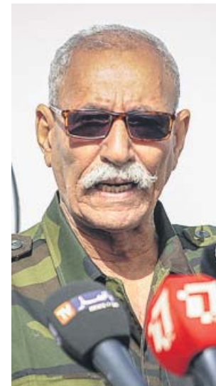
El líder del Frente Polisario, Brahim Ghali.