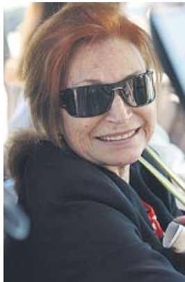
Rocío Jurado, en una imagen de 2005. KORPA

Abanderada de los homosexuales, la artista se ponía frenética ante la ho-