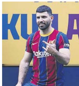
Agüero, ayer durante su presentación azulgrana.

acuerdo para su incorporación al club a partir del 1 de julio, una vez terminado su contrato con el Manchester City. Firmará contrato hasta la finalización de la temporada 2022/23 y tendrá una cláusula de rescisión de 100 millones de euros», anunció el club.