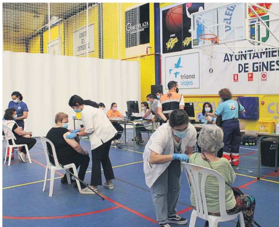
Vacunación en el pabellón cubierto del municipio de Gines. AYTO.

CASI EL 96% de los esenciales menores de 60 años eligen el suero de Oxford para la segunda dosis