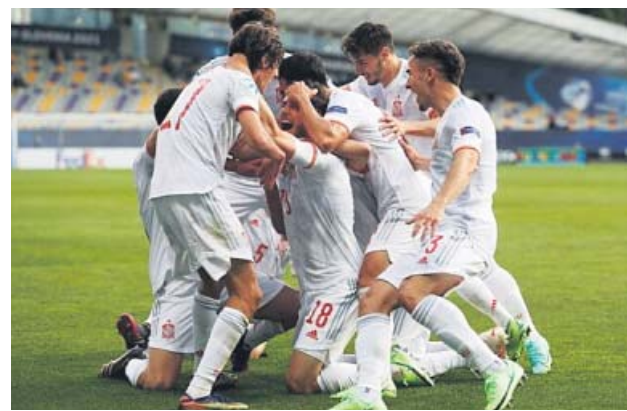
Los jugadores de la sub-21 celebran uno de los goles.