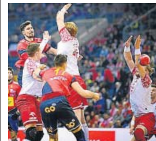
Lance del duelo de ayer entre España y Polonia.

Consciente de que la clave para derrotar al conjunto polaco pasaba por impedir las penetraciones del central Michal Olejniczak y, sobre todo, por no conceder ni medio metro al cañonero Sicko, el equipo español apostó de partida por una agresiva defensa 5-1. La fórmula defensiva resultó a medias, pero fue compensada por la efectividad en ataque. Al descanso, el marcador seguía igualado y se rompió en la reanudación merced a las buenas parradas de González de Vargas y a una mejor defensa española. Unido al acierto en ataque, el resultado terminó por ampliarse, confirmando la madera de campeón de un equipo que se acerca a cuartos y apunta aún más alto. ●