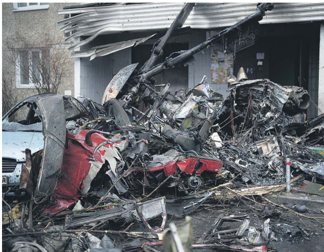
Restos del aparato siniestrado en las inmediaciones de una zona residencial de Brovary, cerca de Kiev.