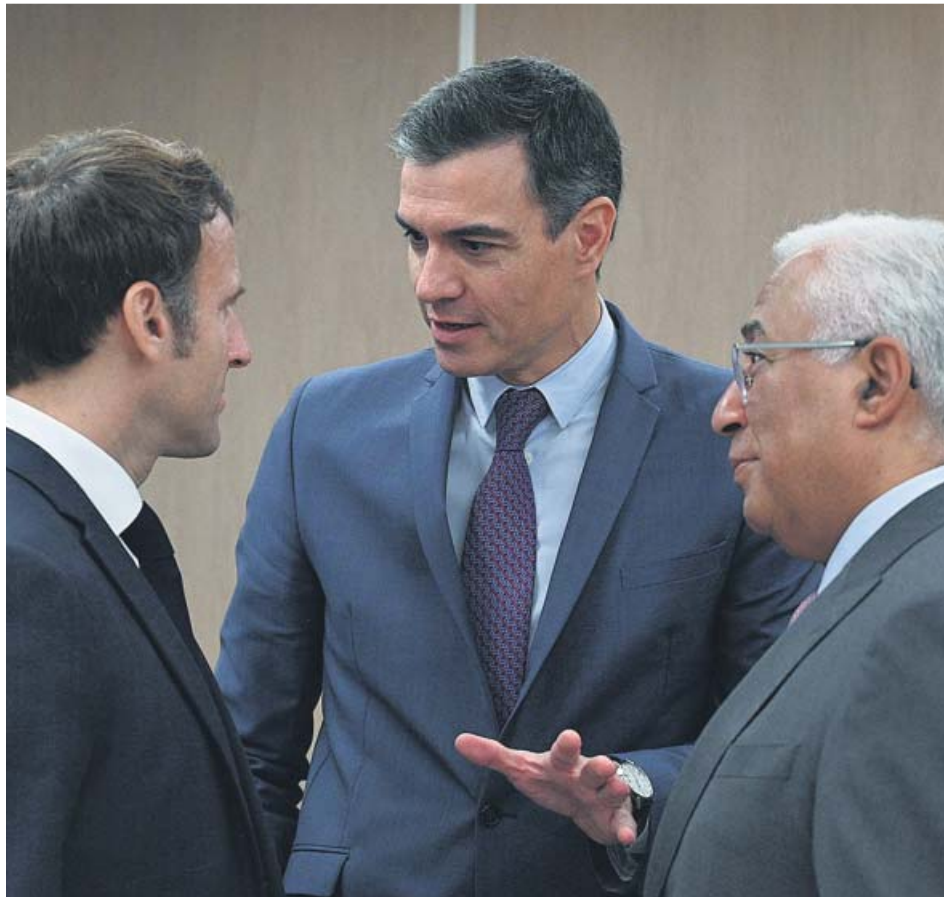
El presidente francés, Emmanuel Macron junto a Pedro Sánchez y a su homólogo portugués, António Costa.

El Palacio Nacional de Montjuïc, sede del Museu Nacional d'Art de Catalunya (MNAC) será el lugar del encuentro bilateral, que comenzará a las 10.30 horas con la llegada de la delegación francesa, encabezada por el presidente francés, y el saludo por parte del presidente español y 10 de sus ministros asistentes