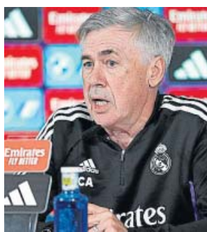
Carlo Ancelotti compareció ayer ante los medios.

Ancelotti, nada más acabar el partido con el Barcelona, le dio «vueltas en la cabeza a lo ocurrido», con la idea de recomponer rápidamente el equipo para lo que se viene, que no invita precisamente al optimismo.