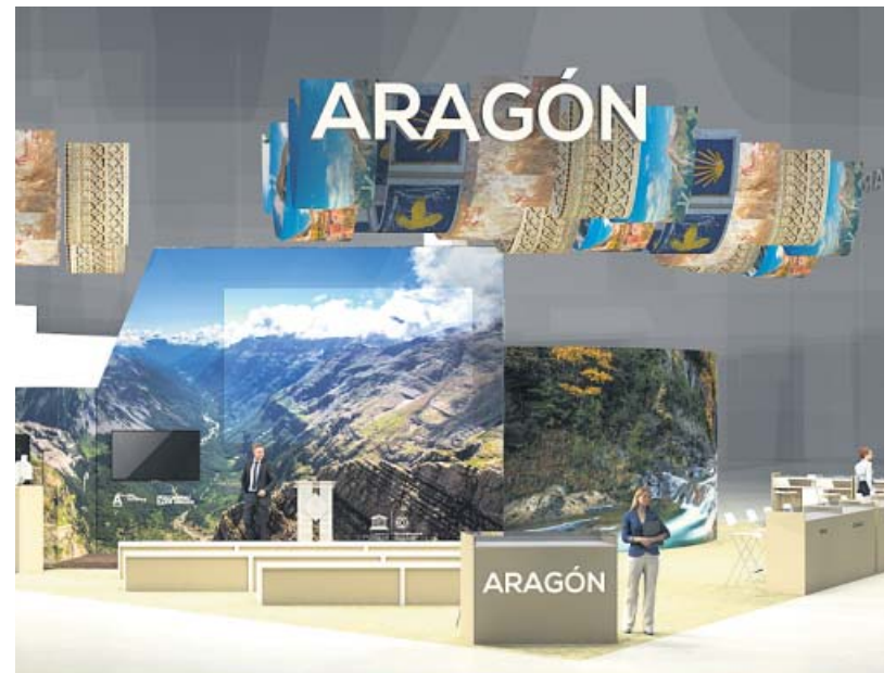
El arte Mudéjar aragonés, el tramo aragonés del Camino de Santiago, el Pirineo-Monte Perdido y el Arte Rupestre del Arco Mediterráneo inspiran el 'stand' del Gobierno de Aragón en FITUR 2023. GOBIERNO DE ARAGÓN