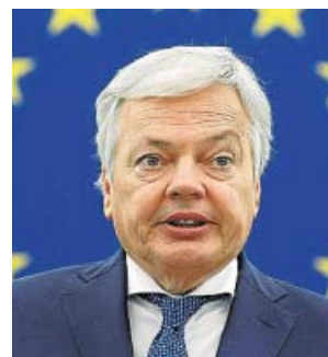
El comisario Reynders, ayer, en el Parlamento europeo.

El texto cuenta ya con las firmas de 255 personas, pero los participantes hacen un «llamamiento a los partidos y a la sociedad en general en la convicción de que la pasividad o la indiferencia son incompatibles con el ejercicio responsable de la ciudadanía». Por eso, ofrecen la posibilidad de adherirse al manifiesto a través del siguiente correo electrónico: manifiestoanteeldesafio@gmail.com . ●