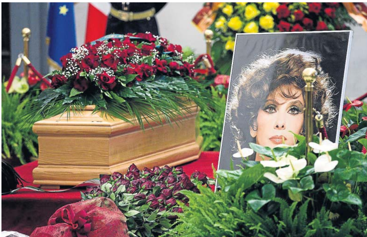
Los restos de la actriz descansan en el Aula Giulio Cesare del Campidoglio de Roma.

La presentación del libro, todo un quebradero de cabeza para el cantante, se produce cuando varios abogados americanos han mostrado interés en llevar su caso en Estados Unidos. En caso de prosperar, podría ser un golpe de efecto que podría dar un giro inesperado a una guerra más sentimental que judicial. ●