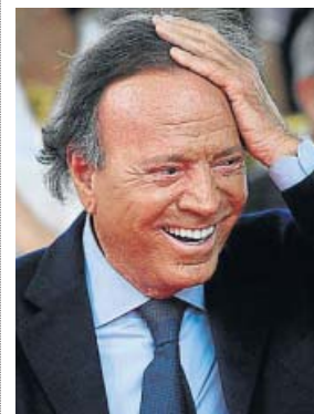
El cantante Julio Iglesias, en una imagen de archivo.

obra en poder de este periódico, se reconoce la dispensa otorgada por el Tribunal de la Rota, pero no la nulidad eclesiástica; en todo caso, la unión civil es legal y, como tal, está inscrita en el Registro Civil.