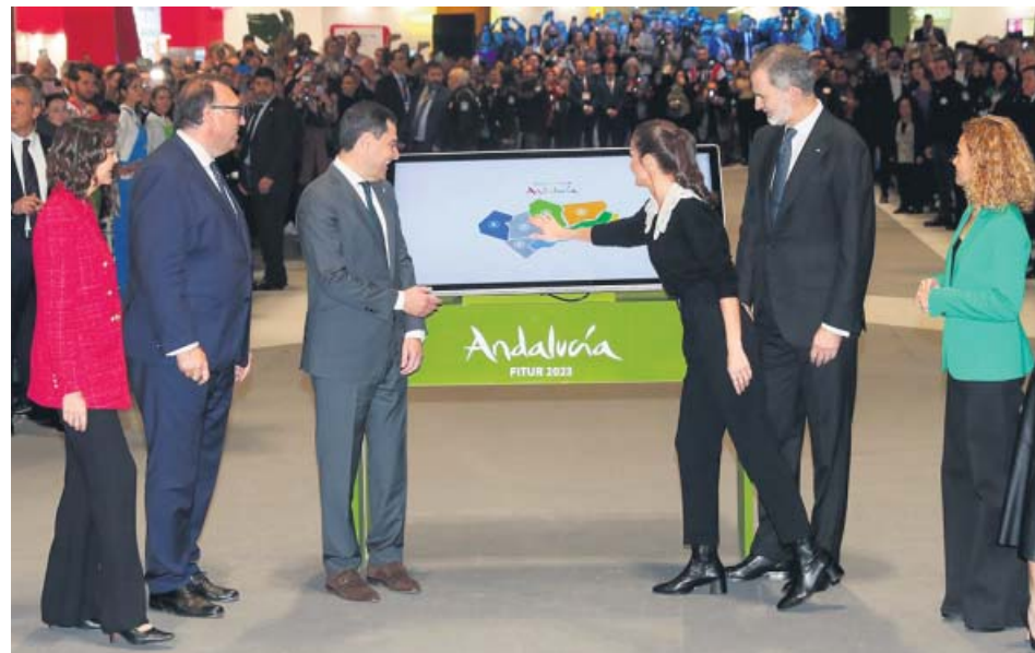
Los reyes Felipe VI y Letizia participaron ayer en la inauguración del stand andaluz.