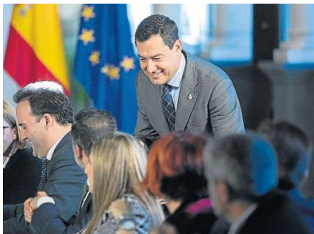
El presidente Moreno, ayer en el Pleno del CACL.

Moreno incidió en la necesidad de estrechar lazos para