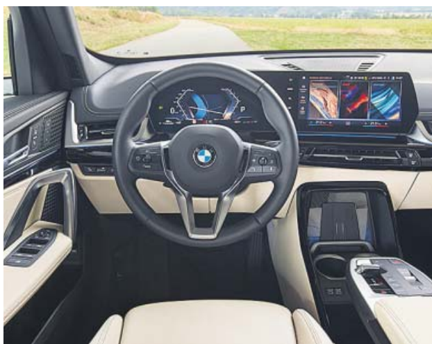
El interior, de gran calidad, está muy digitalizado.

Esta versión cuenta con una mecánica clásica de gasolina de 136 caballos y el precio parte de los 42.700 euros