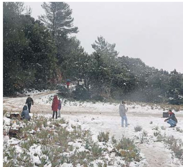
Paisaje nevado en la sierra de Tramuntana (Mallorca).

El intenso frío ha dejado, además, estampas tan inusuales como la Talaia de Sant Josep, a 475 metros sobre el nivel del mar en Ibiza, cubierta de un manto blanco de nieve ayer por la mañana. En el interior de Valencia y Alicante