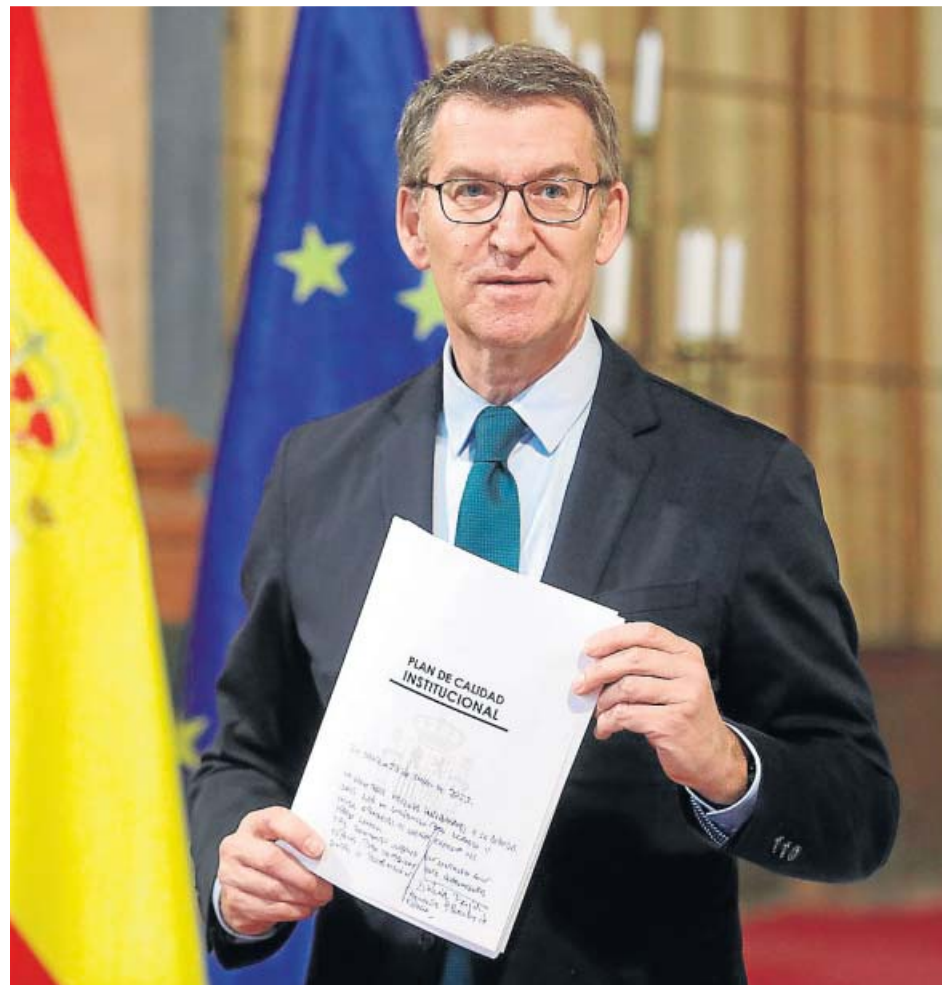
El presidente del PP, Alberto Núñez Feijóo, muestra el documento con las propuestas.

En una rueda de prensa ofrecida desde Ferraz, Alegría recordó cómo Feijóo, en su etapa como presidente autonómico, ofreció por carta a