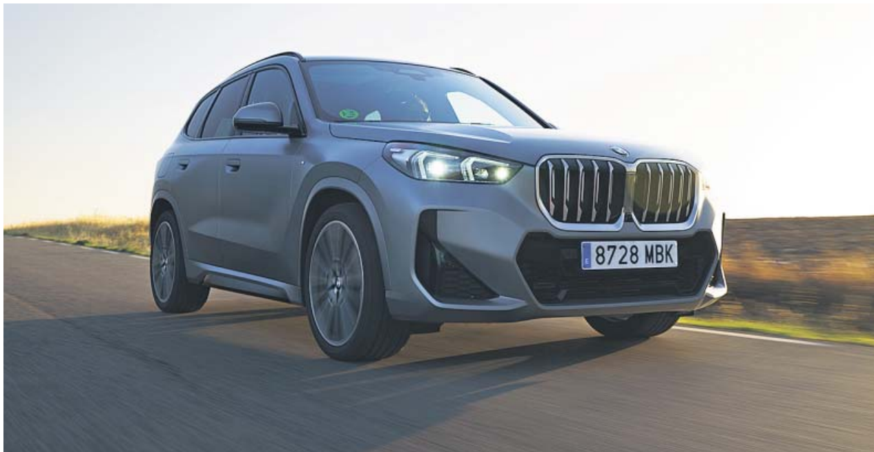
El X1 es un SUV de 4,5 metros de longitud que presenta una imagen muy poderosa. BMW