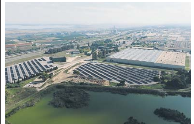
La planta ofrece 2,8 megavatios de electricidad fotovoltaica.