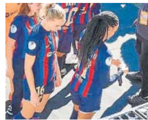
Las jugadoras del Barça recogiendo ellas mismas las medallas.

se había visto envuelta tras hacerse públicas las imágenes explícitas que mostraban el acto «solemne». Independientemente de todo, su comunicado se refería a los protocolos de premiación de la RFEF y aclararon que «teniendo en cuenta tanto el elevado número de representación institucional, así como las infraestructuras para el acceso al palco desde el césped del estadio, el departamento de Protocolo decidió activar la ceremonia de entrega en el palco de la misma manera que se lleva a cabo en la Copa del Rey: entrega de la Copa a la capitana del equipo campeón y entrega de medallas al equipo vencedor en césped/vestuario».