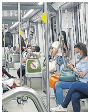
Personas con mascarilla en el metro.

La ministra de Sanidad, Carolina Darias, aseguró que «habrá que ver cómo evolucionan los tiempos para tomar esa decisión, pero evidentemente la situación epidemiológica cada vez es más buena y hay que ver cómo evoluciona China». Según Vozpópuli , la Ponencia de Alertas no esperará a marzo, como había planeado, y aprobará previsiblemente esta semana cambiar la obligatoriedad por recomendación, una vez concluya el