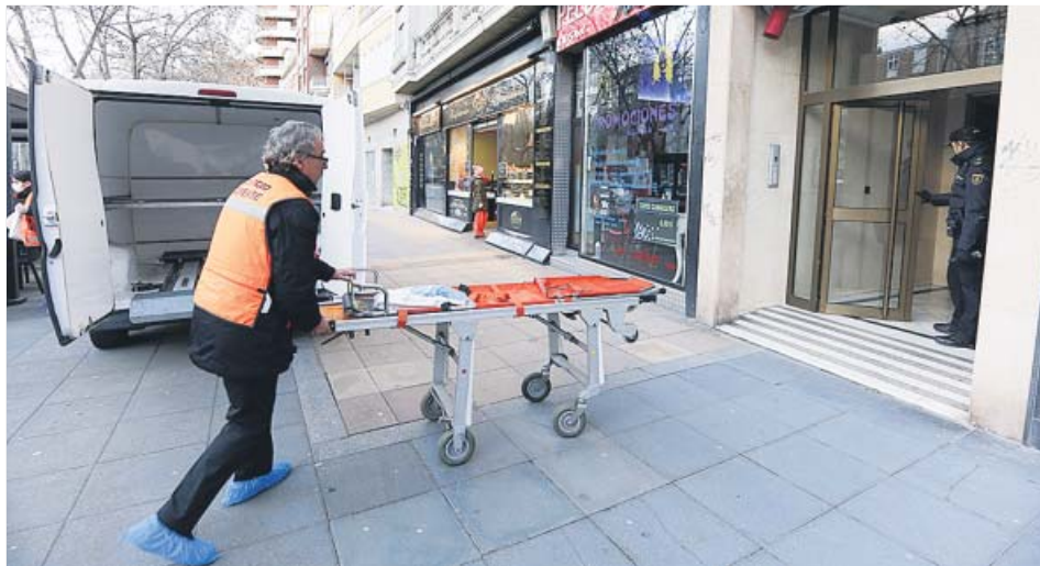
Un trabajador de la funeraria entra al domicilio donde fueron hallados los dos cadáveres. EP