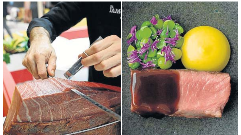
Arriba, el cocinero madrileño Dabiz Muñoz (2d), junto a otros compañeros que fueron chef revelación otras ediciones. Abajo, un «jamón de mar» hecho con ventresca de atún.