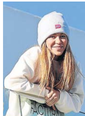
Shakira, asomada al balcón de su casa.

Algo que también garantiza el inagotable Eduardo Guervos, promotor de los recitales, todo un referente en estas cuestiones y uno de los más respetados y preferidos por las estrellas. Por sus contratos han pasado nombres tan ilustres como los de los artistas Camilo Sesto o Melendi, entre otros muchos. ●