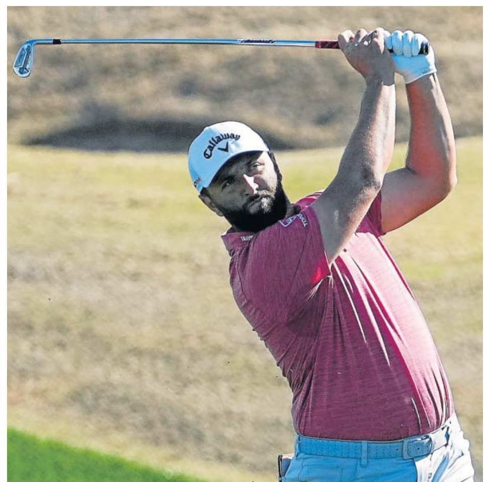
El golfista español Jon Rahm, durante el The American Express.