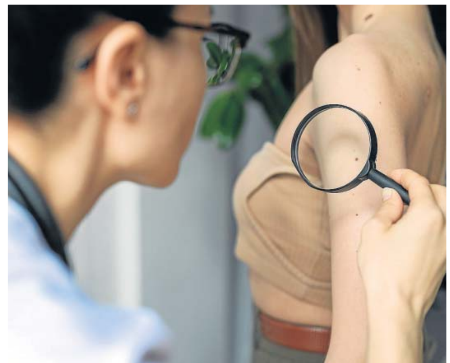
Los tumores malignos son más sensibles que el tejido sano.

La diferencia no es solo de colores y de que el tipo de tecnología utilizada en el proceso eléctrico —electrólisis— para separar el hidrógeno de resto de elementos sea renovable o nuclear. También queda patente en el lenguaje. Mientras el Gobierno español habla de «hidrógeno verde» o «renovable», el presidente francés, Emmanuel Macron, habla en su lugar de «hidrógeno de bajas emisiones» o «limpio», conceptos que engloban también al que tiene origen nuclear. ● CLARA PINAR