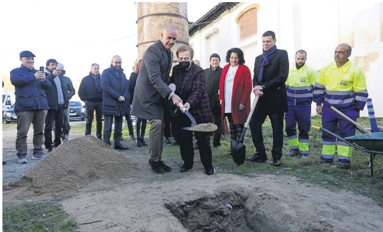
El alcalde puso ayer, junto a vecinos de la zona, la primera piedra de la reurbanización de la antigua Fábrica de Vidrios.

También ayer se movilizaron los médicos de la sanidad privada, en lo que calificaron como una protesta «histórica» por la «dignificación» de su profesión. Reclaman una actualización de sus retribuciones, «congeladas desde hace tres décadas». ● 20MINUTOS