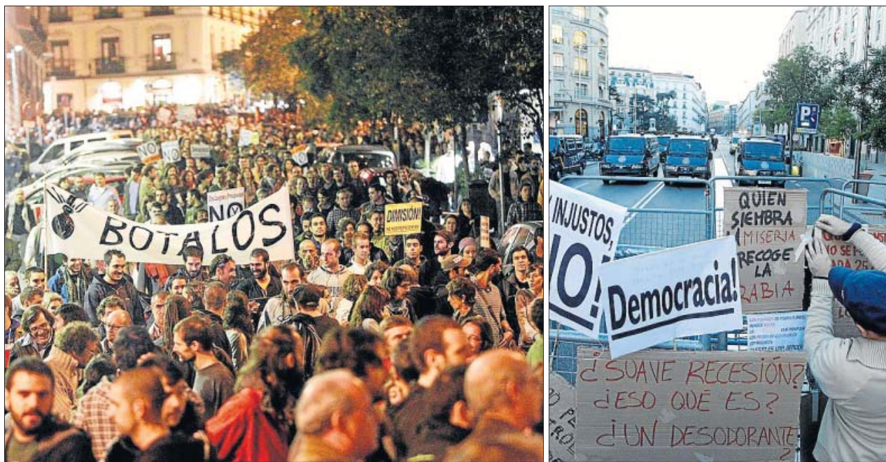
Los manifestantes llenaron de pancartas las vallas que rodeaban a un Congreso fuertemente vigilado.

Diez minutos antes, cuando ya habían desaparecido la mayoría de los manifestantes, la Policía reabrió el lateral del paseo del Prado que se había cerrado con motivo de la protesta. Los carteles colocados por los participantes por la iniciativa rodea el Congreso en las vallas que protegían el edificio habían sido retirados.