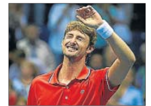
Ferrero llora tras el último partido de su carrera.

Perdió con Almagro. Juan Carlos Ferrero jugó ayer el último partido de su carrera, después de 14 años como tenista profesional, al caer en el Valencia Open 500, torneo del que es copropietario junto a David Ferrer, ante Nicolás Almagro (7-5 y 6-3). «Gracias a mi equipo por todos estos años, a mi familia y a todos», dijo.