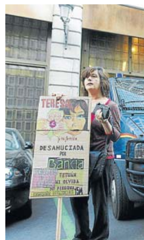
Protesta de una cliente de Bankia desahuciada.

La iniciativa solicita también que la dación en pago tenga efectos retroactivos, de forma que se condone la deuda a las miles de familias que ya se