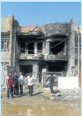
OCHO MUERTOS y 15 heridos en varios ataques en Bagdad (Irak).