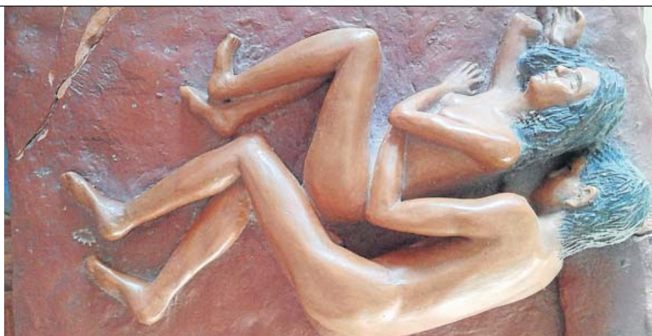
Mónica Caballo Baldominos. Descanso a dos. Barro cocido (cerámica), pintado con diversas pátinas.

Hagas lo que hagas, si quieres verlo publicado en 20 minutos, envíalo a zona20@20minutos.es o déjalo en el subidor de 20minutos.es