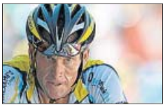
Lance Armstrong ▶ La USADA demuestra su dopaje sistemático y el de su equipo.