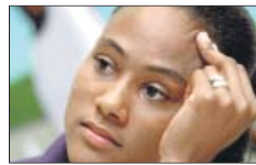
Marion Jones ▶ Unida al caso Balco, la atleta perdió medallas y acabó en prisión.