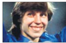
RDA ▶ Décadas de dopaje estatal llenas de nombres. La atleta Marita Koch lo negó.