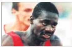
Ben Johnson ▶ El atleta canadiense, oro en los 100 m de Seúl, fue desposeído.