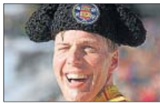
Salt Lake City ▶ La EPO, con Johan Muhlegg al frente, marcó los JJ OO de invierno.