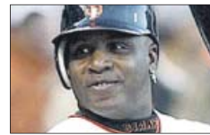
Barry Bonds ▶ El jugador de los Giants de béisbol es investigado por esteroides.