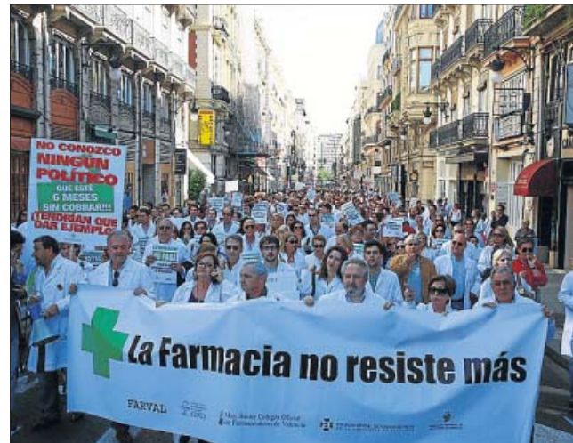
2.000 farmacéuticos se manifestaron ayer en Valencia por los impagos.

de euros en concepto de medicamentos y 200 oficinas han entrado en concurso de acreedores por esta situación (se han perdido 2.000 empleos).