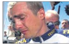
Caso Festina ▶ El equipo fue expulsado del Tour 98. En la imagen, Richard Virenque.