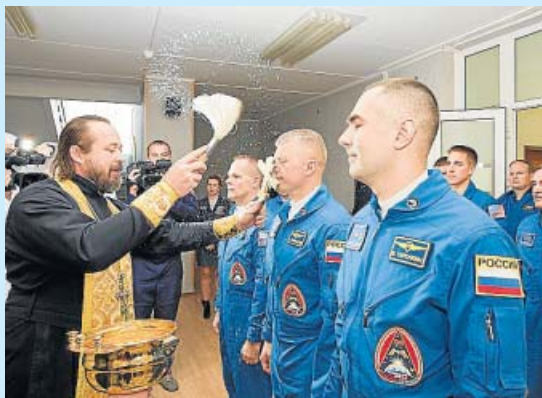
BENDICIÓN. Tradicional bendición de un sacerdote ruso antes del lanzamiento del cohete Soyuz hacia la Estación Espacial Internacional, en Baikonur (Kazajistán).

Y muchas más, en las fotogalerías de 20minutos.es