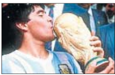
Maradona ▶ El futbolista argentino dio positivo en el Mundial de EE UU (1994).