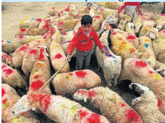
SACRIFICIO. Un niño cachemiro controla su rebaño en un mercado de Srinagar, donde ovejas y cabras serán sacrificadas durante el Eid al Adha.