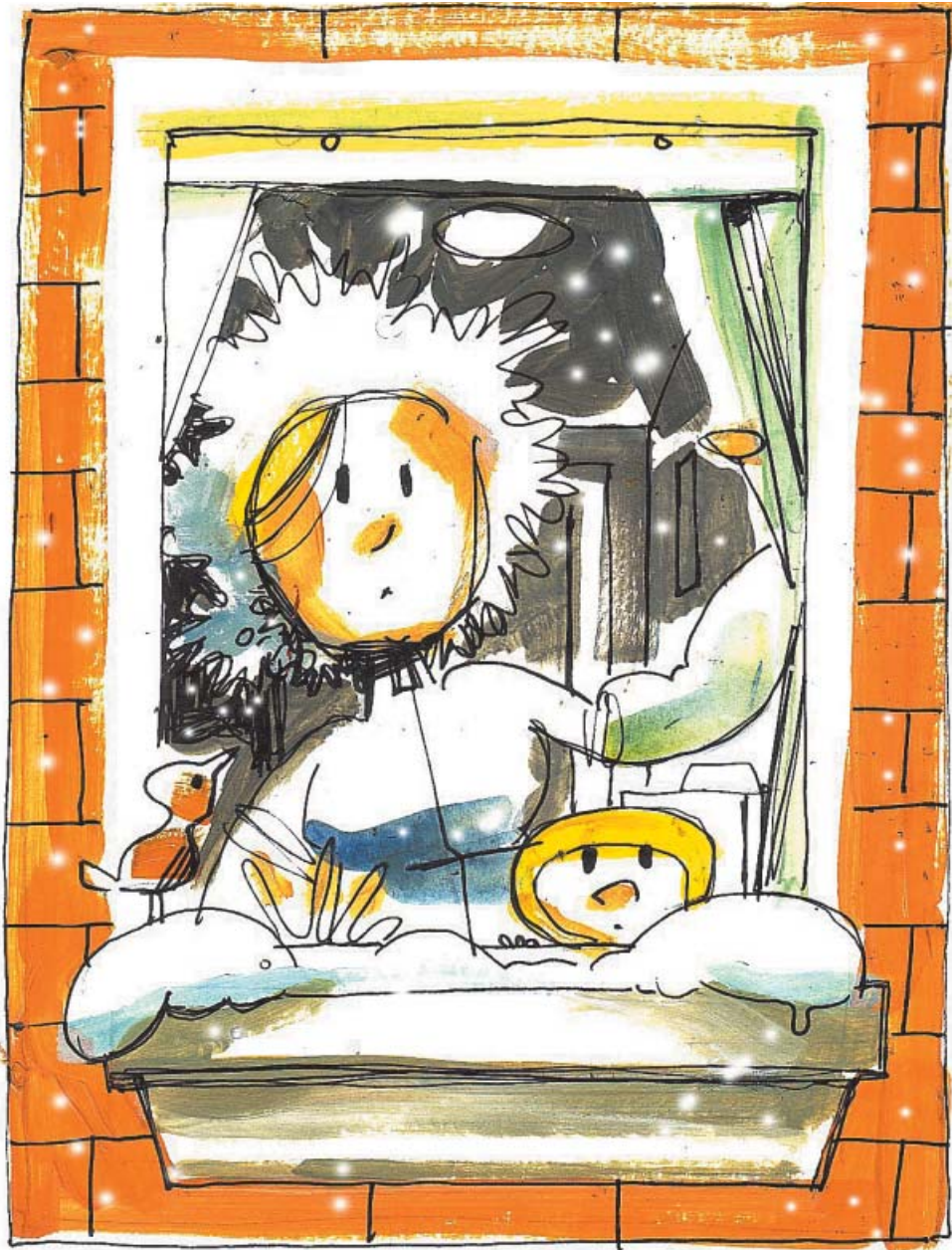
JOSE MANUEL ESTEBAN

Suelos. También existen aislantes de fibras minerales para estas superficies. Las alfombras reducen la pérdida de calor por el suelo, aunque la instalación de la calefacción vaya por ahí.