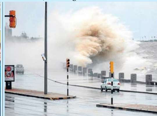
CICLÓN. Las autoridades uruguayas ampliaron ayer la advertencia de alerta roja debido a un ciclón extratropical que ya causó un muerto. En la imagen, Montevideo.

Y muchas más, en las fotogalerías de 20minutos.es