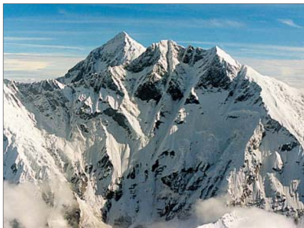
Panorámica de la cumbre de la montaña más alta del mundo, el Everest.

Gran parte del éxito no sería posible sin la ayuda de los fa-