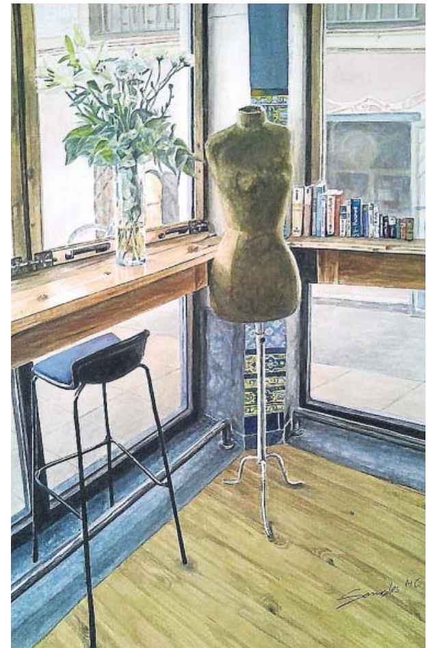
Sonsoles Márquez Caparrós. El bar al desnudo. Acuarela.

YTÚ, ¿QUÉ PINTAS? ¿O QUÉ FOTOGRAFÍAS? ¿O QUÉ ESCULPES? Hagas lo que hagas, si quieres verlo publicado en 20 minutos, envíalo a zona20@20minutos.es o déjalo en el subidor de 20minutos.es