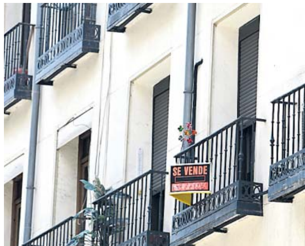
Imagen de un piso en venta.

Este nuevo descenso profundiza la contracción de la solicitud de hipotecas, tras el pequeño repunte –mensual– que experimentó en enero como