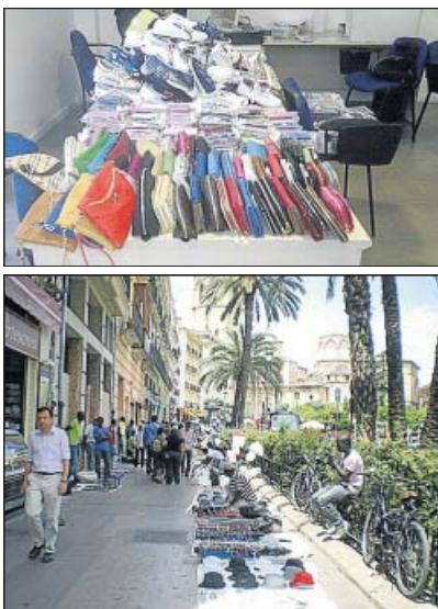
Agentes identificando anteayer a un vendedor (izda.), varios de los productos requisados por la Policía y la plaza de la Reina tomada por manteros .