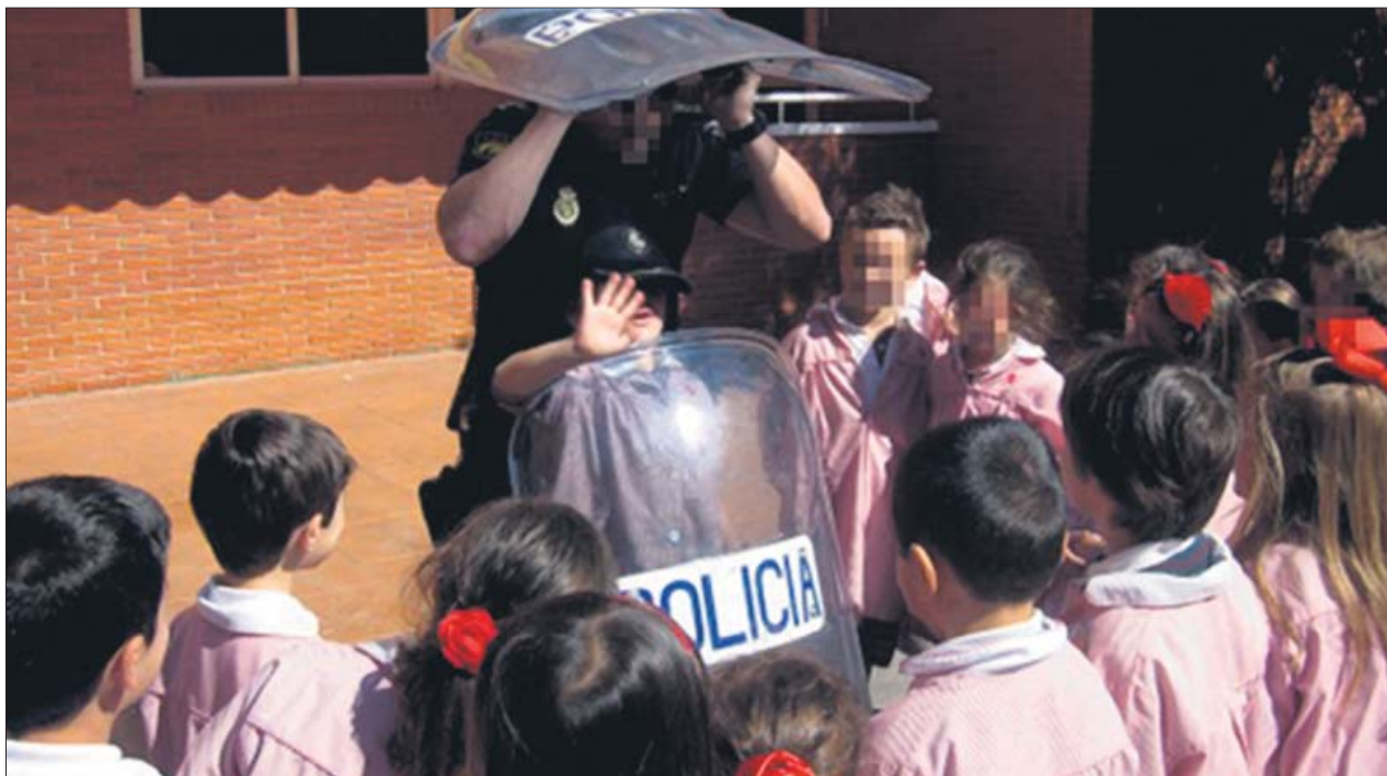
Dos agentes muestran a los niños los escudos que utilizan en su trabajo.

Corea del Norte está construyendo una estación de esquí «de primer nivel mundial» al este del país, según informó ayer la agencia estatal norcoreana KCNA.