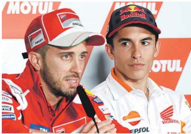
Marc Márquez mira a Dovizioso, ayer, en Motegi.

El actual campeón camina firme hacia su cuarta corona mundialista después de su victoria en MotorLand Aragón, que, junto a los fallos de sus dos más directos rivales, Andrea Dovizioso (Ducati) y Maverick Viñales (Yamaha), le permiten afrontar la tripleta de Gran-