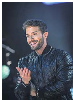
Alborán, ayer, presentando su gira Prometo.