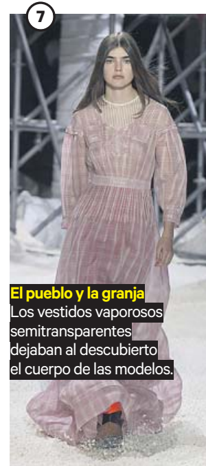
El pueblo y la granja Los vestidos vaporosos semitransparentes dejaban al descubierto el cuerpo de las modelos.