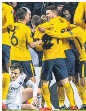
Los jugadores del Atlético celebran un gol.

ra parte, dos de ellos de un Aduriz imparable, en un partido marcado por el intenso frío, con diez grados bajo cero en el ambiente. Tras los dos tantos de Aduriz, marcó Rico el tercero de los vascos justo antes del descanso. El gol de Luis Adriano en el segundo tiempo solo maquilló el resultado para el Spartak. R. SOCIEDAD-SALZBURGO (2-2) La Real Sociedad no pudo pasar del empate en Anoeta ante Salzburgo, a pesar de un partido excelso del canterano Odriozola. La Real tuvo que remontar un