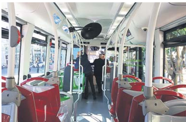
Interior del primer bus 100% eléctrico de la EMT.