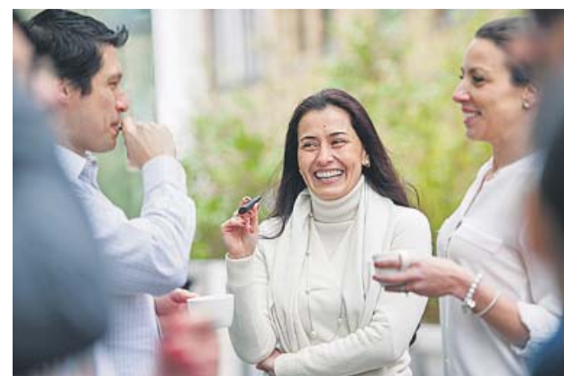
Tabaco sin combustión.

Estos vapeadores fueron los primeros en comercializarse en España. Llegaron a principios de 2008 y su diseño generalmente imita un cigarrillo o una pipa. En su interior contiene una batería para calentar una solución líquida que acaba conver-