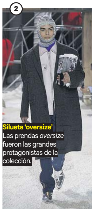
Silueta 'oversize' Las prendas oversized fueron las grandes protagonistas de la colección.