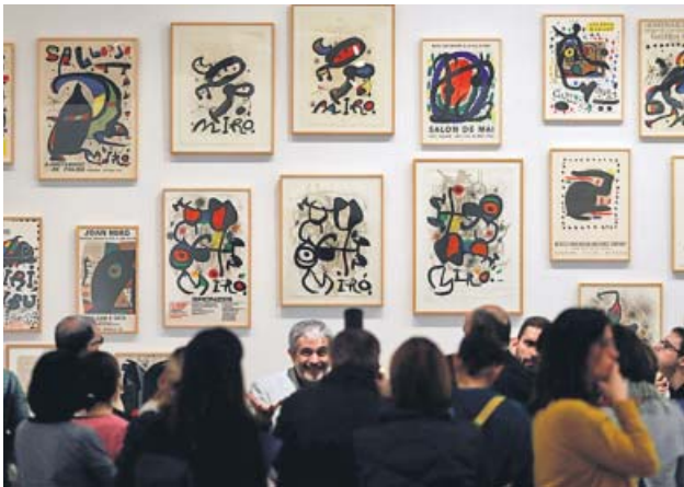
La muestra se abrió ayer al público.