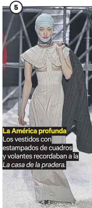
La América profunda Los vestidos con estampados de cuadros y volantes recordaban a la casa de la pradera.