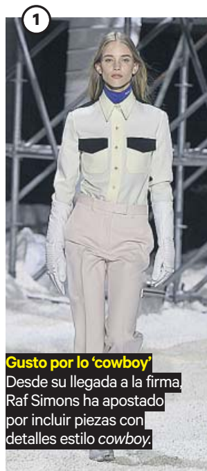
Gusto por lo 'cowboy' Desde su llegada a la firma, Raf Simons ha apostado por incluir piezas con detalles estilo cowboy.