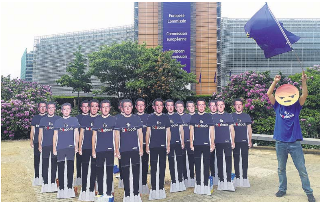
El movimiento Avaaz situó una veintena de carteles con la cara de Zuckerberg frente a la Comisión Europea a modo de protesta.