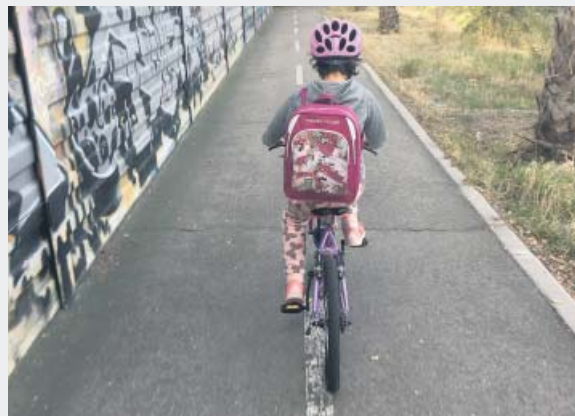
Mejor bicis de aluminio, conviene evitar las de hierro. M.T.

El casco es obligatorio hasta los 16 años, pero rodilleras y codilleras no son imprescindibles para aprender y dar los primeros paseos. «No hay que sobreproteger. Si vas a descender desde la Morcuera pues ponte rodilleras, espaldera y todo lo que puedas. Pero si te vas a dar un paseo, ponte el casco y ya está», explica el maestro de ciclistas Jesús Sesé.