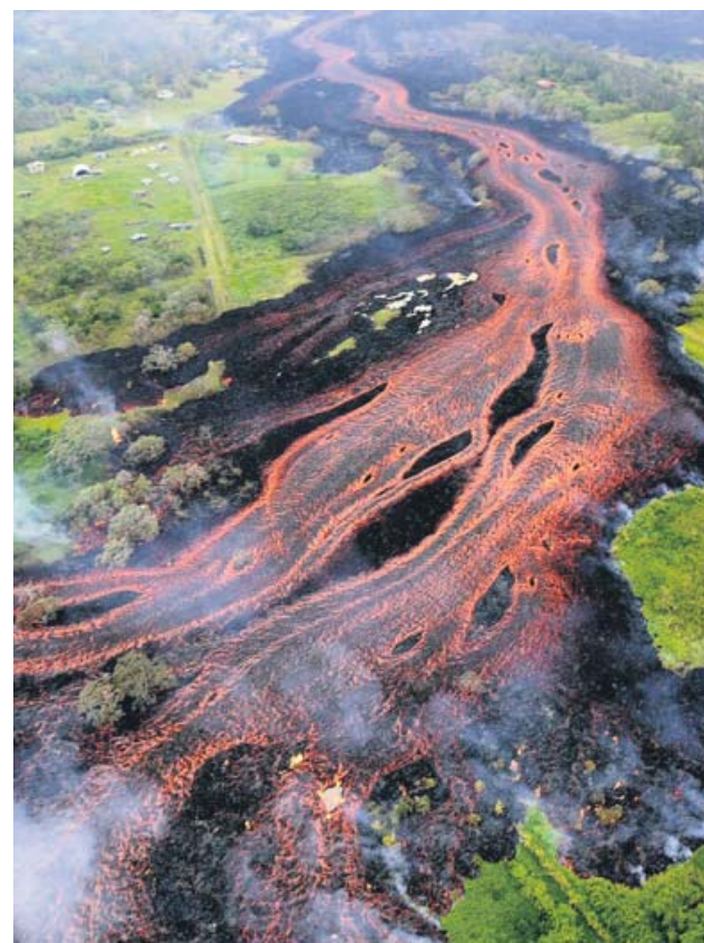
OBSEVATORIO DE VOLCANES DE HAWAII