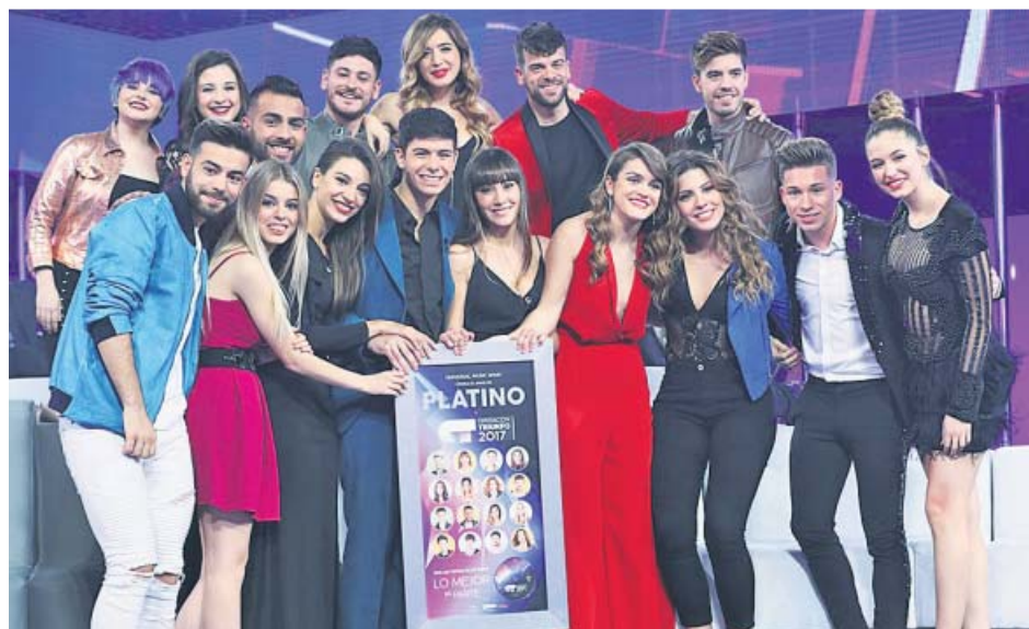
Los chicos de OT 2017 posan con el Disco de Platino de uno de sus recopilatorios.

Uno de los concursantes más carismáticos. Ha dado concier-