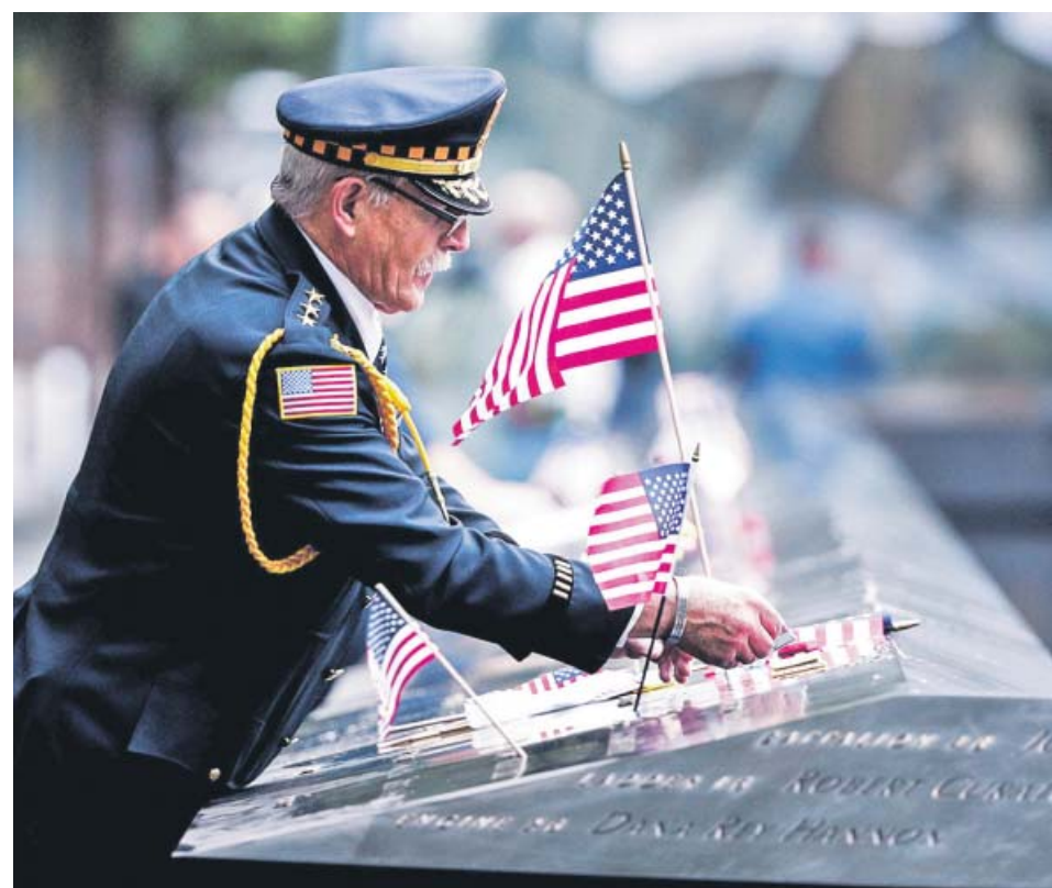
Un oficial participa en un homenaje por las víctimas de los atentados del 11-S.

La asamblea de trabajadores del astillero de Navantia de San Fernando (Cádiz) anunció ayer movilizaciones para que se despeje la incertidumbre sobre el contrato para la construcción de cinco corbetas para Arabia Saudí. Ayer cortaron la carretera A-4 y han convocado una manifestación para mañana con todos los ayuntamientos de la zona.