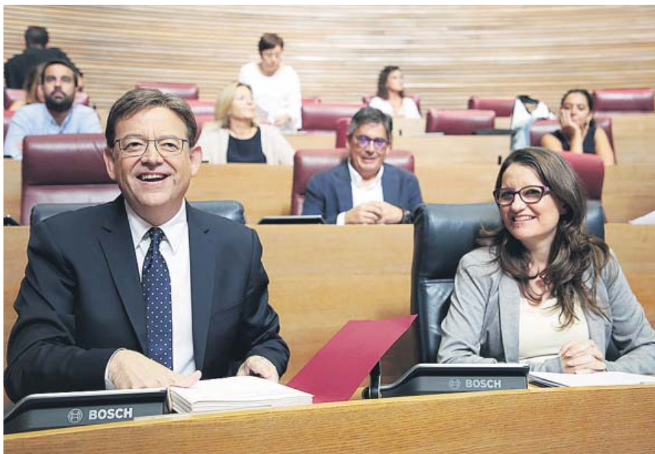
El jefe del Consell y la vicepresidenta, ayer, durante el pleno.