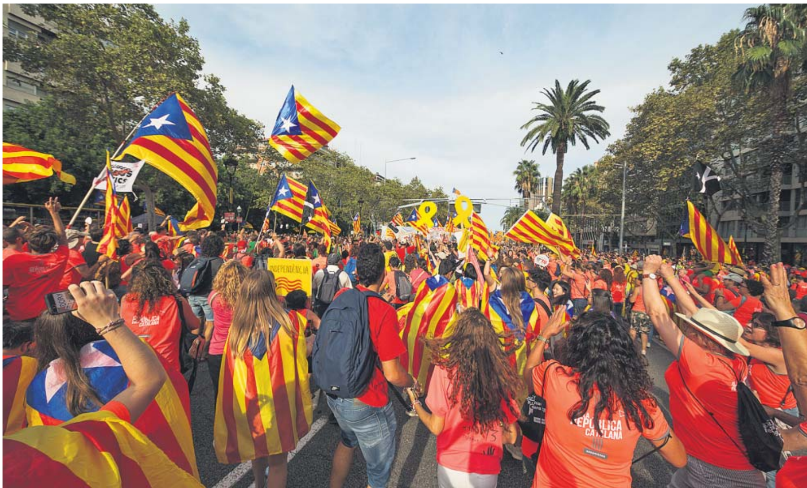
Los asistentes a la manifestación de la Diada en el momento de hacer la 'ola sonora' que ayer atronó en la Diagonal justo a las 17.14 horas. MIQUEL TAVERNA