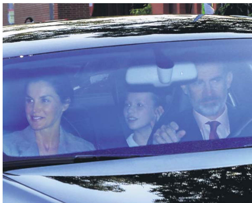
Los reyes llevaron en coche a sus hijas (en la imagen, la princesa Leonor) al colegio.

Es Irene Gracia como dice Martín Garzo «nuestra escritora más secreta». En Las amantes boreales nos acerca a su «extraños seres heridos y lunáticos» con una historia de amistad profunda y también al borde de algunos abismos. Una aventura y desventura protagonizada por dos jóvenes de la alta burguesía rusa que son expulsadas de la Escuela Imperial de Danza.