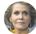
JANE FONDA Actriz

«Creo que 'Cincuenta sombras de Grey' no es un libro muy bueno, pero en EE UU estimuló a muchas mujeres. Eso es bueno»