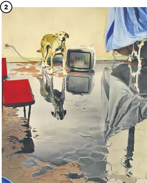
OUKA LEELE Me levanto por la mañana, hay un gran charco en mi casa (1986), creada en blanco y negro y pintada en acuarela por la escenógrafa.