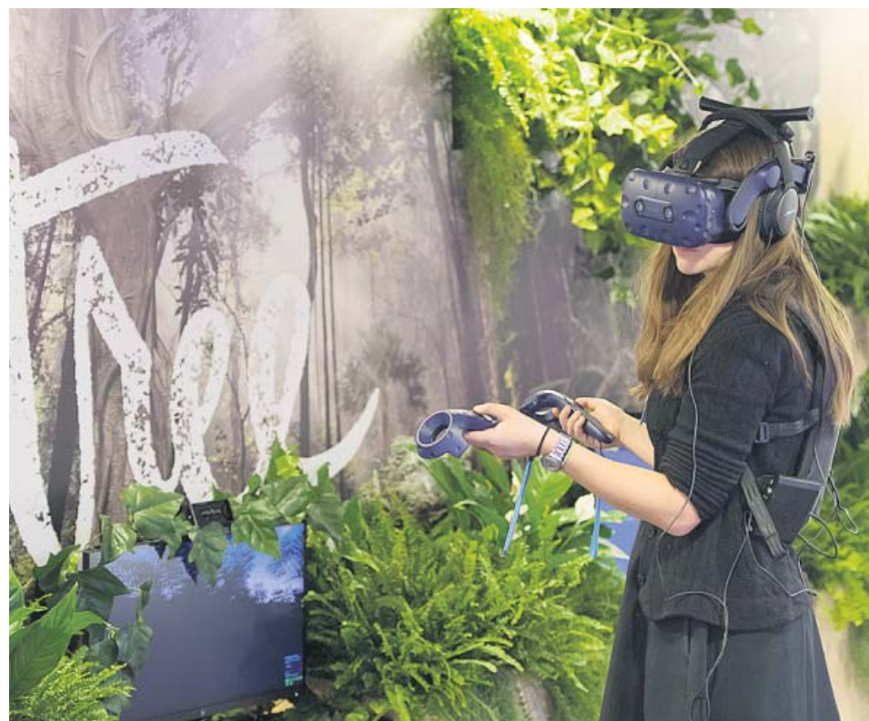
Una mujer, ayer en Davos, viendo la película para RV Árbol (Tree) .

20M.ES/EUROVISION Esta y otras noticias en torno al festival las puedes consultar en nuestra página web.