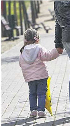
Una niña camino de la guardería. JORGE PARÍS

Las madres trabajadoras cuyos hijos fueran a la guardería durante el año pasado contarán con una nueva ayuda, tal como se recogía en los Presupuestos Generales del Estado de 2018. Estas son algunas de las claves del llamado cheque bebé que se podrá solicitar en la próxima campaña de la renta. Eso sí, el trámite tiene que realizarse desde los centros.