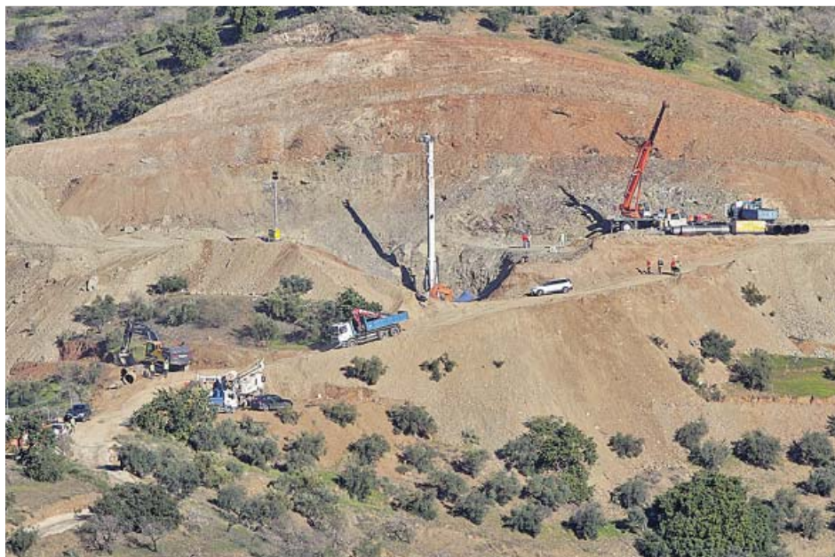
Imagen aérea de los trabajos de perforación, ayer, en el Dolmen del Cerro de la Corona.

encontraron. «A medida que están más abajo es más lento el proceso, porque la arena que tienen que sacar tiene que recorrer más metros para salir», relató ayer el ingeniero López Escobar.