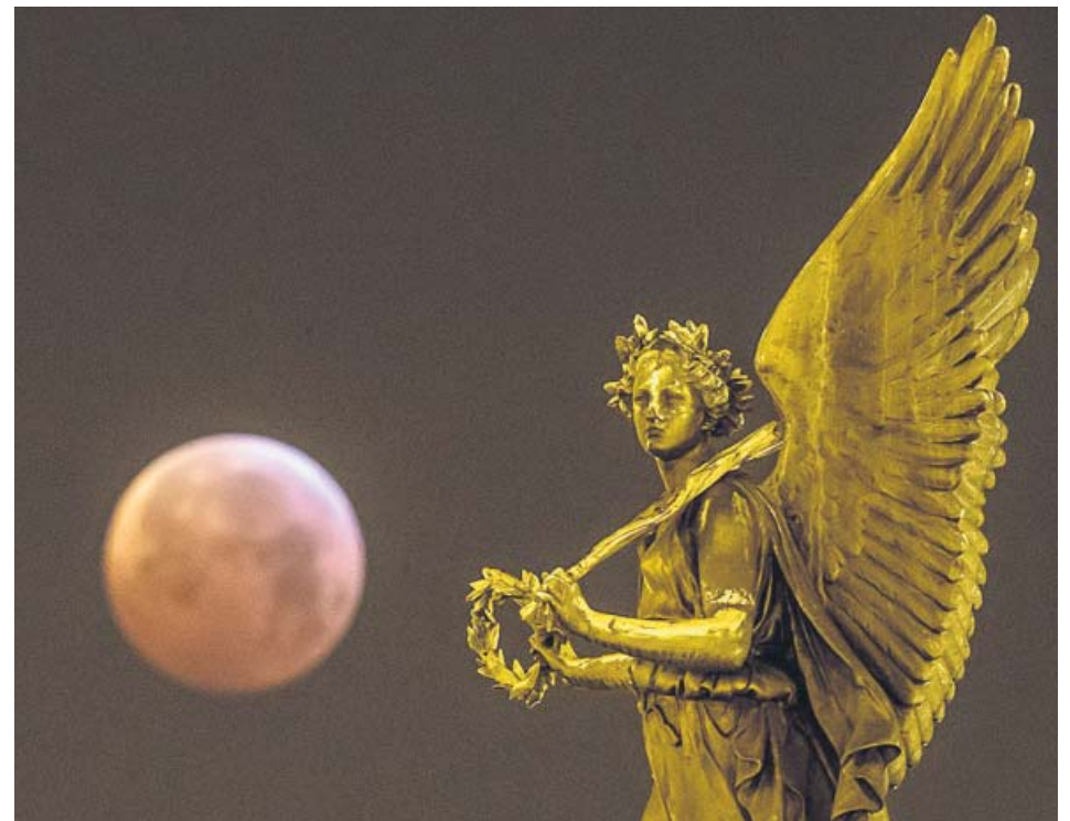
Superluna de sangre vista desde la República Checa anteayer por la noche.

Los hechos ocurrieron días antes del caso de los Sanfermines de 2016, concretamente en mayo y están implicados cuatro acusados del caso de Pamplona. La Fiscalía solicita que a los acusados se les prohíba comunicarse o aproximarse a la víctima. ●