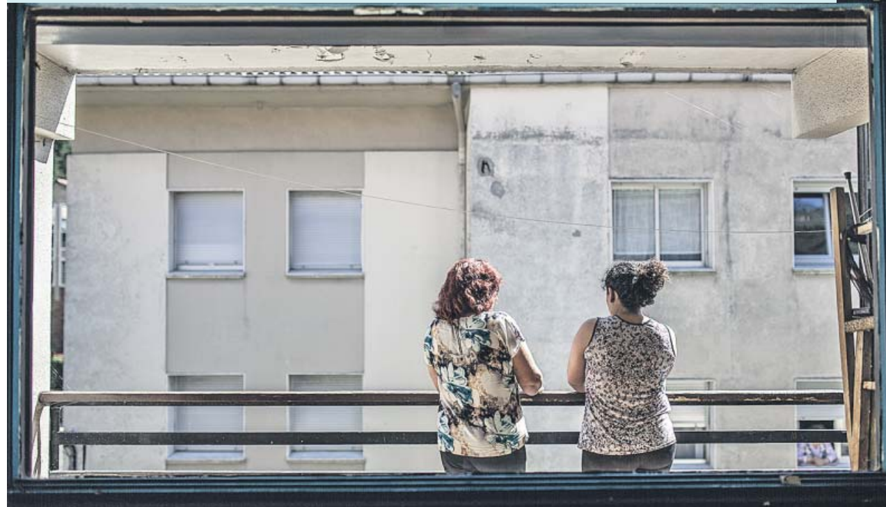
Dos mujeres, en un edificio de un barrio humilde.