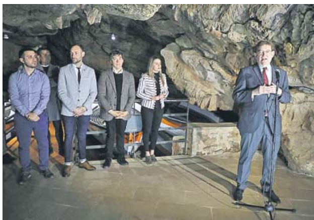
Puig anunció ayer el plan en una visita a la Vall d'Uixó.

después de que la fundación haya decidido acudir a los tribunales para que determinen si la parte de los fondos que reclama es suya o del Consistorio. El encuentro se produjo antes de que comenzara el acto de presentación de la revista de la Casa-Museo Blasco Ibáñez Prometeo y del libro de Vicente Blasco Ibáñez Aventura veneciana y otros cuentos . ●