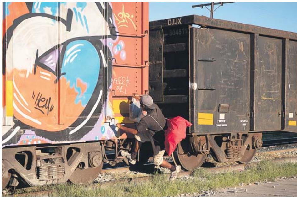
En el documental, un joven migrante trata de subir al tren conocido como La Bestia.