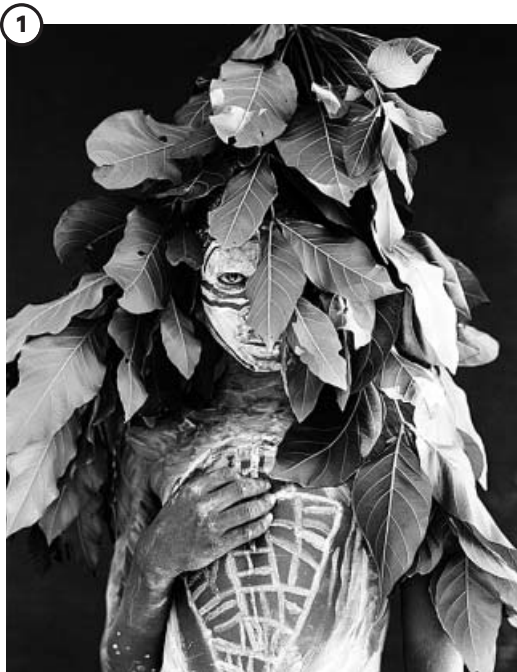
ISABEL MUÑOZ La artista, Premio Nacional de Fotografía en 2016, retrata en blanco y negro cómo viven los niños africanos en Etiopía (2005).