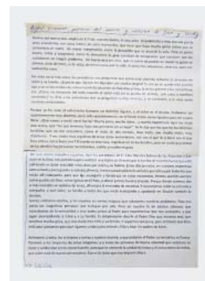
Imagen del texto original de la carta del sacerdote.