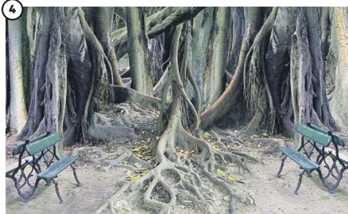
CONCHA PÉREZ A través del paisaje de Pesadilla (2001), nos devuelve al pasado y a su infancia. Con los bancos representa a las personas.