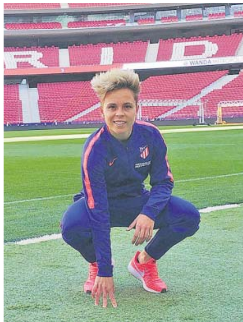
FC BARCELONA / D. SÁNCHEZ DE CASTRO

con el deporte femenino y con nosotras, el fútbol femenino, y no solo cuando el Wanda se llene, sino que se llenen todos los campos.