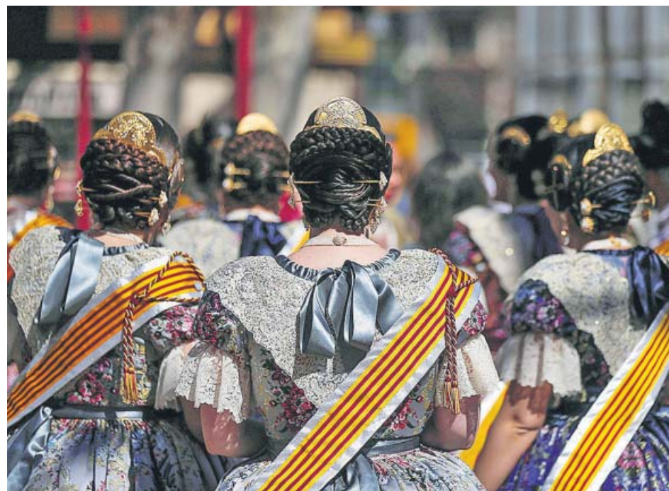
Un grupo de falleras, ayer, por las calles del centro de València.

ACCESO DESDE LA V-21. Se recomienda dejar el coche en la zo-