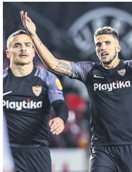
Celebraciones de Valencia y Villarreal; decepción en el Sevilla.