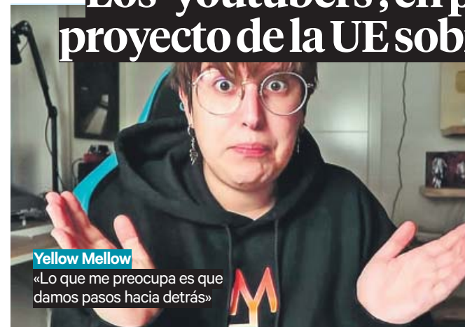
Yellow Mellow «Lo que me preocupa es que damos pasos hacia atrás»