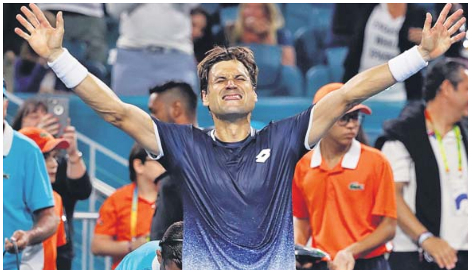
David Ferrer celebra su victoria ante Zverev en el Masters de Miami.

«Esta victoria ante Zverev significa mucho para mí porque no entraba en mis planes. Es un día especial porque es mi último año como tenista