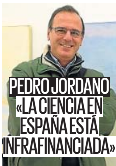
Entrevista al biólogo y experto en Doñana. PÁGINA 10

Eurodiputados de PP, PSOE, Cs y Equo analizan en el corazón europeo, Bruselas, y con 20minutos como testigo, los grandes retos a los que se enfrenta la UE, en un año marcado por las cercanas elecciones. PÁGINA 6