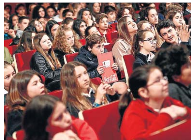
Los concursantes, preparados para escribir.