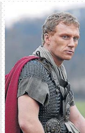
La gloriosa barbarie de John Milius.

Porque, siempre obsesionado con la fragilidad de las nociones morales, Milius orientó su serie a mostrar cómo la forma de pensar de un cives romanus era absolutamente ajena a la mentalidad contemporánea. Empatizar con los habitantes de una sociedad donde cualquier cosa (salvo el bienestar del Estado) se