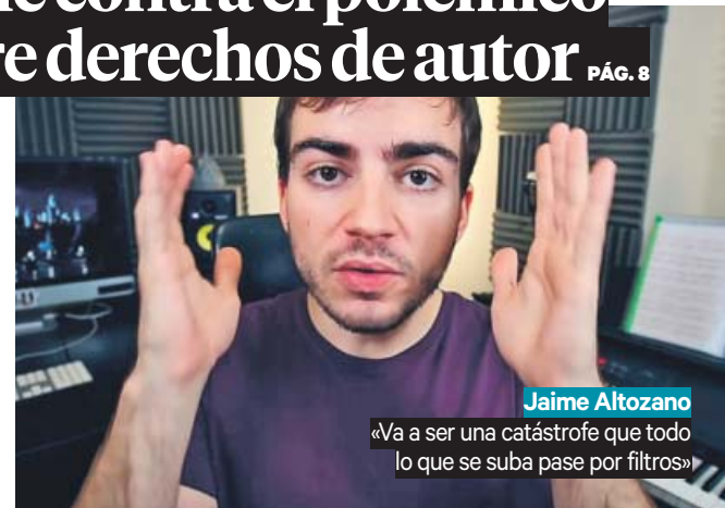
Jaime Altozano «Va a ser una catástrofe que todo lo que se suba pase por filtros»