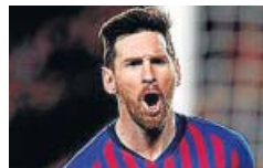
Messi, duda para el derbi del sábado.