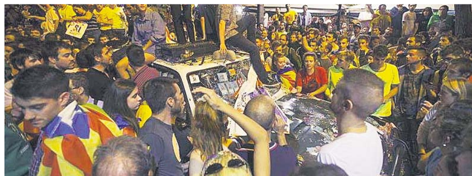
Manifestantes tratan de impedir los registros en la conselleria de Economía, el 20-S de 2017.

También Manel Valls, ex primer ministro francés y candidato a la alcaldía de Barcelona, quiso mostrar su rechazo a ese «irresponsable» manifiesto. «Es lamentable que hayan caído en la intoxicación que el separatismo lleva trabajando desde hace años», dijo. ●