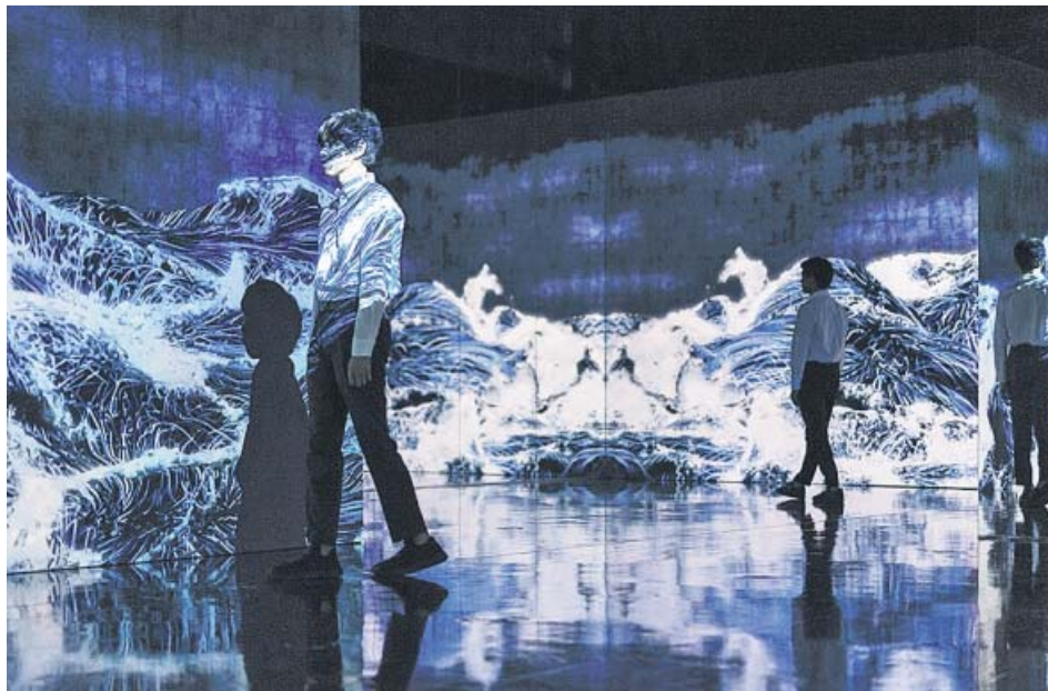
La instalación Black Waves se inspira en La gran ola de Kanagawa .

«Hemos creado un universo sin fronteras, compuesto por obras de arte que se desplazan por sí solas, se comunican entre ellas y a veces se mezclan con