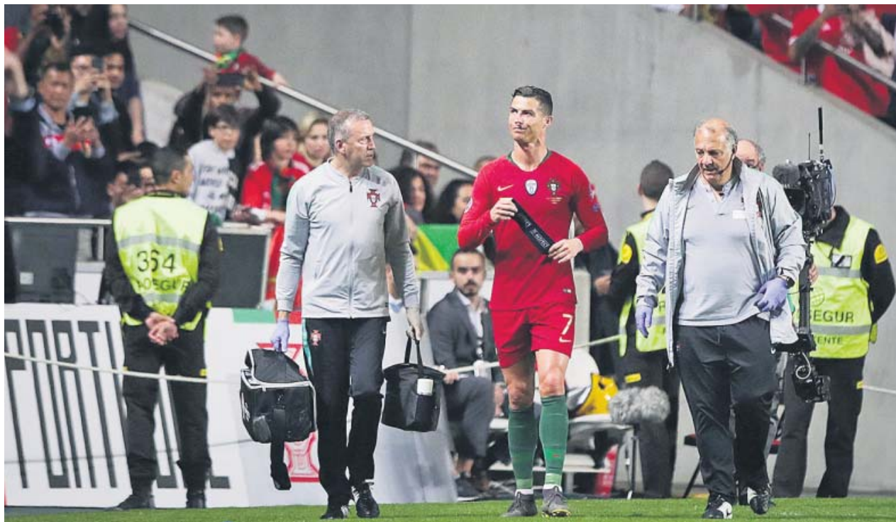
Cristiano Ronaldo se retira lesionado del estadio Luz de Lisboa (Portugal).

Cristiano Ronaldo se tuvo que retirar lesionado del partido de ayer que enfrentó a Portugal y Serbia, correspondiente a la segunda jornada de clasificación para la próxima Eurocopa 2020, que acabó en empate (1-1). Tadic adelantó a Serbia y Danilo Pereira firmó el empate. Ronaldo, por su parte, sufrió un pinchazo en su pierna derecha cuando esprintaba para alcanzar un balón, y, consciente de la situación, pidió rápidamente el cambio. ● R. D.