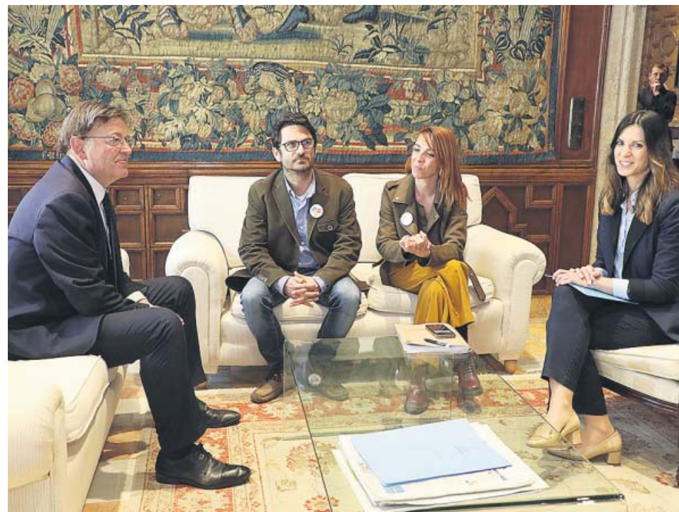
El presidente Puig recibió ayer a la Plataforma Defensa TEA.

«Así, el trabajo ya estará hecho», afirmó a este respecto. «No vamos a esperar. Trabajamos ya para poner en itinerario la tasa, que entrará en vigor cuando se regule la ordenanza», insistió ayer el responsable municipal. ●