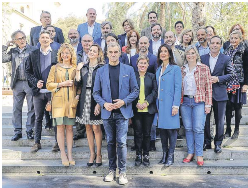
El candidato a jefe del Consell, junto al resto de la candidatura autonómica de Cs.