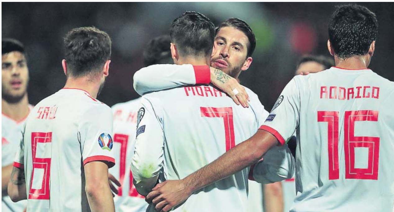
Sergio Ramos y el resto de los jugadores españoles felicitan a Álvaro Morata tras uno de sus goles en Malta.

DOS GOLES del delantero del Atlético le dieron una victoria cómoda a España en su visita a Malta