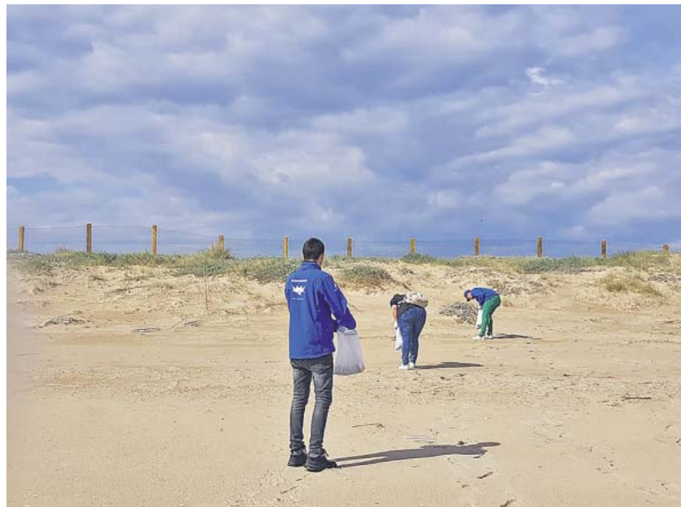
Varias personas recogen basura marina en la playa valenciana del Saler.

El reparto provincial es el siguiente: en Alicante 127 centros se organizan con jornada ordinaria y 361 con jornada continua; en Castellón, 133 jornada ordinaria y 54 intensiva, y en Valencia, 548 escuelas mantienen el horario ordinario y unas 200 el continuo. Alicante es, de este modo, la provincia más proclive a la jornada continua, ya que tres de cada cuatro colegios han aprobado el cambio. ●