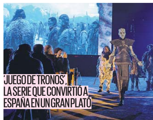
'JUEGO DE TRONOS', LA SERIE QUE CONVIRTIÓ A ESPAÑA EN UN GRAN PLATO

A menos de dos semanas para el inicio de su última temporada, localidades españolas escenario de la serie, como Osuna (Sevilla), recrean alguna de sus escenas más inolvidables. PÁGINA 12