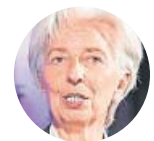
CHRISTINE LAGARDE Directora gerente del FMI

«Este año, prevemos que el 70% de la economía mundial experimente una desaceleración»