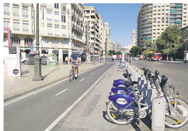
Tramo del anillo ciclista frente a la Estación del Norte.

euros ahorrará el Ayuntamiento tras refinanciar la deuda del Parque Central del 4% al 0,9%