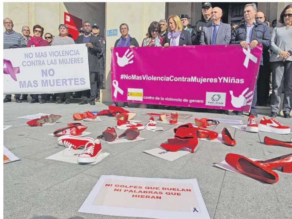
Minuto de silencio guardado ayer ante la Subdelegación del Gobierno en Alicante.

De hecho, el día con mayor intensidad registrada fue el 11 de marzo, y solo se bajó de estos registros entre el 15 y el 19. Una vez pasada la festividad, la vuelta a la rutina disparó nuevamente el paso de estos vehículos por este punto del anillo ciclista en el entorno de