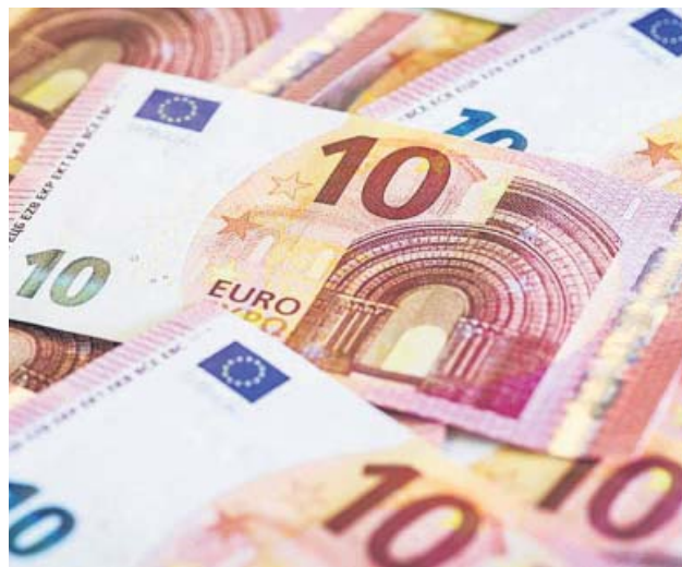
Imagen de varios billetes de diez euros.

Respecto al mundo rural, el equipo de Sánchez habla de seguros agrarios, y defiende que agricultores y ganaderos «puedan afrontar los nuevos retos relacionados con la preservación de la biodiversidad y el cambio climático, sin menoscabo de la rentabilidad de sus explota-