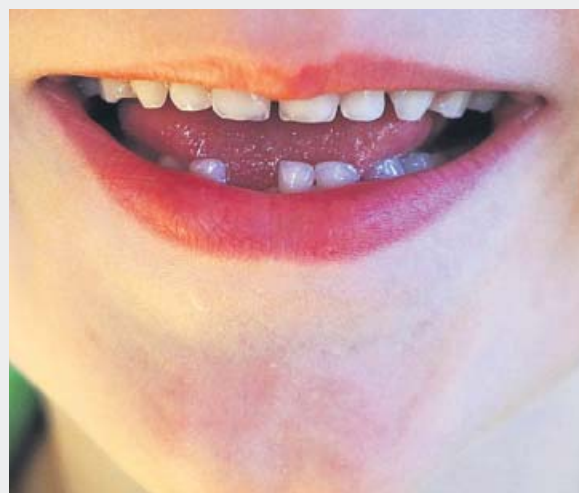
Un menor muestra sus dientes de leche.