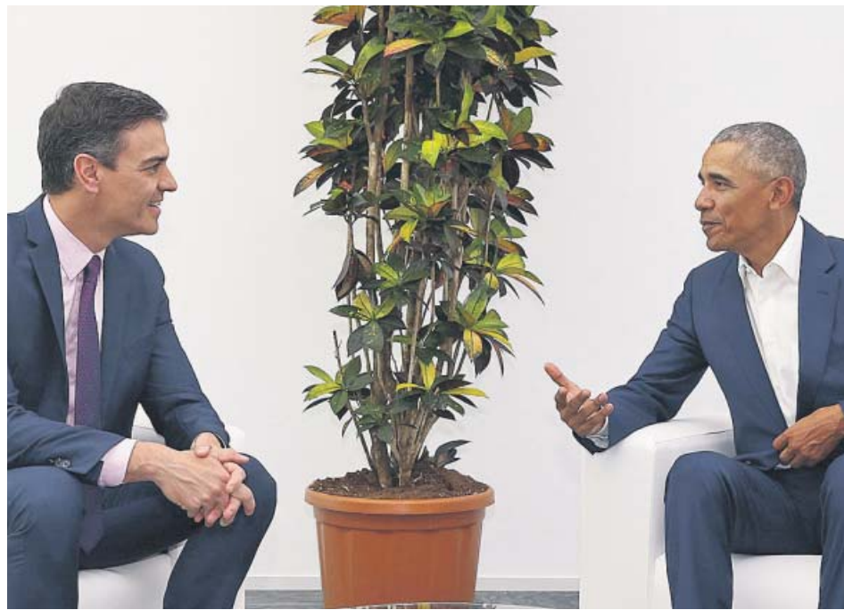
Pedro Sánchez y Barack Obama, ayer en Sevilla.

El PNV aprovechó que el Gobierno necesitaba sus votos para recordarle sus «compromisos» incumplidos en materia de traspasos. Por ejemplo, el año pasado se transfirió al Gobierno vasco la gestión de un tramo de la autopista API y dos líneas de ferrocarril, pero Vitoria todavía espera el de prisiones que acordó con Pedro Sánchez y reclama también la Seguridad Social, para lo que no hay acuerdo con Madrid. El portavoz del PNV en el Congreso, Aitor Esteban,