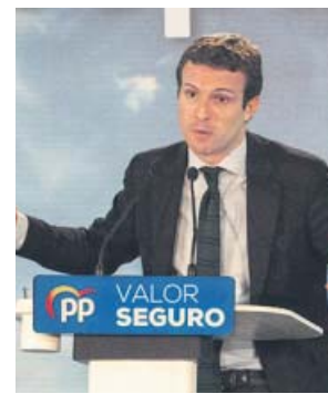
Pablo Casado, en un mitin ayer en Ciudad Real.

Ante un público formado principalmente por personas mayores, Casado anunció que si