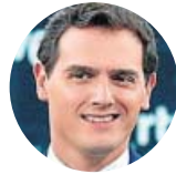
Albert Rivera Candidato de Ciudadanos

«Señor Sánchez, baje del Falcon, baje del avión. Aterrice»