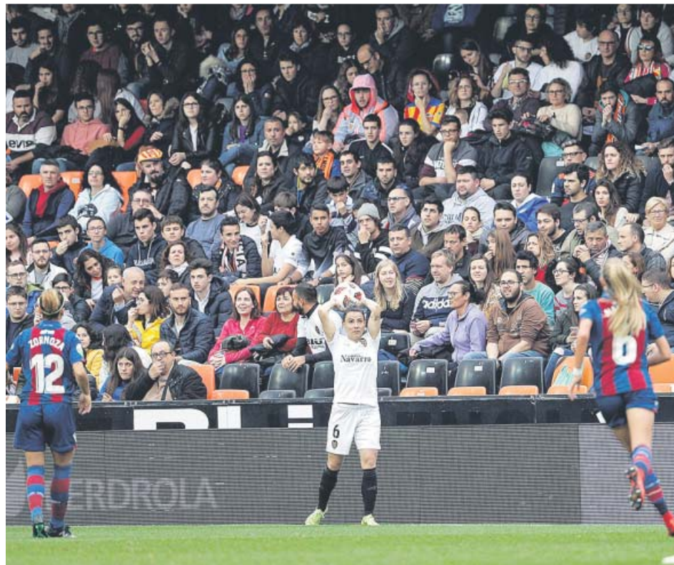
Mestalla, con gran afluencia de público para el Valencia - Levante.

En Mestalla, las malas condiciones meteorológicas estropearon en parte la fiesta. Y, pese a la amenaza de lluvia constante, casi 10.000 personas fueron a Mestalla para ver el derbi entre Valencia y Levante, que acabó con victoria visitante por 1-3. Banini adelantó a las levantistas, Jucinara empató, y Charlyn y Eva Navarro sentenciaron. ● R. R. Z.