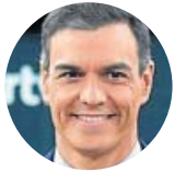
Pedro Sánchez Candidato del PSOE

«Apostamos por la justicia social y el PP por los corruptos»