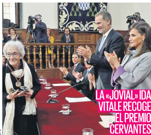
LA «JOVIAL» IDA VITALE RECOGE EL PREMIO CERVANTES

El candidato de la coalición de izquierdas a la Presidencia de la Generalitat centra su programa en acabar con las listas de espera y los barracones y en cambiar el modelo de financiación. Defiende la tasa turística y precios máximos para los alquileres. PÁGINA 2