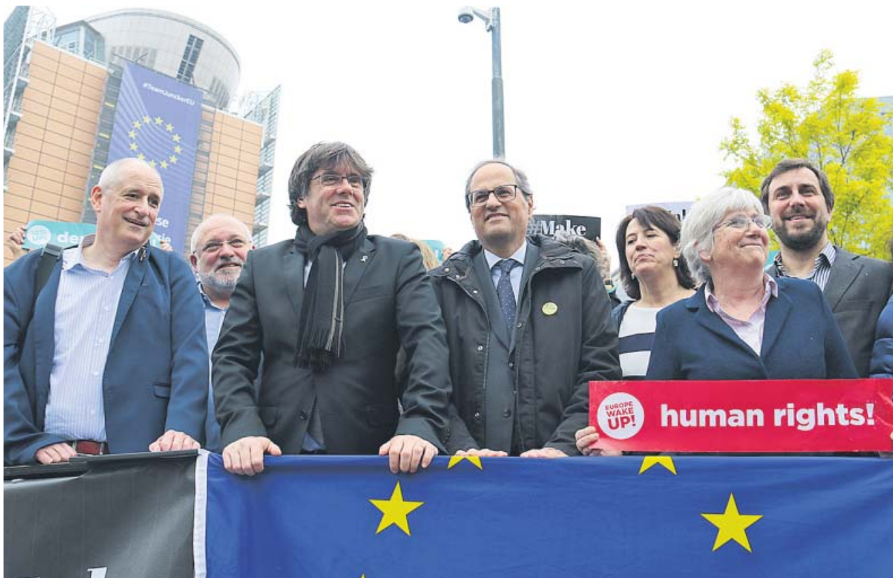
Carles Puigdemont y Quim Torra, ayer en Bruselas.