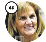
NÚRIA DE GISPERT Expresidenta del Parlament de Catalunya

«He suprimido el tuit que tanto lío ha creado. Nunca he querido llamar cerdos a nadie. La composición no es mía»