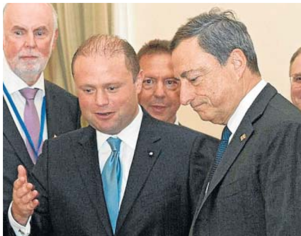
De izquierda a derecha y de arriba abajo, el portugués António Costa en su toma de posesión; el primer ministro sueco, Stefan Löfven; la rumana Viorica Dăncilă, y el maltés Joseph Muscat en una recepción a Mario Draghi.