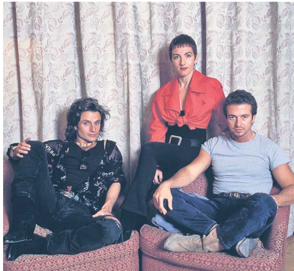
La banda de pop español Mecano en un posado, en el año 1990.

va del grupo (Plaza&Janés), un libro que lleva escribiendo toda su vida sobre la historia de esta banda ochentera.