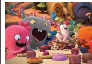
Moxy, Babo y otros peluches marginados. DIAMOND

La mayor baza del filme de Lord y Miller era recurrir a una marca que cientos de personas ya usaban como medio narra-