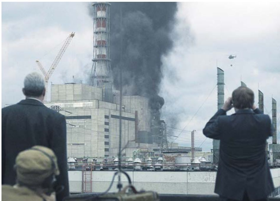
Jared Harris y Emily Watson dan vida a los científicos que contuvieron el desastre.