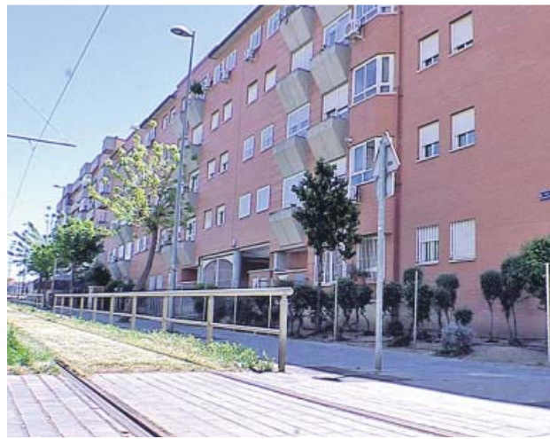
Fachada del edificio ubicado en la calle Reyes Católicos.

Este fin de semana, según indicaron a Efe fuentes de la Jefatura Superior de la Policía, la Comisaría de Parla recibió el avi-