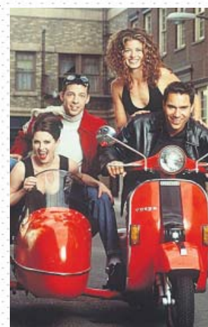
Los protagonistas de la serie Will & Grace.

Claro que si dichos secundarios son Jack (Sean Hayes) y Karen (Megan Mullally), eso es comprensible: en la cabeza del primero —uno de esos personajes que neutralizan los estereotipos ofensivos a base de hipérboles— solo hay espacio para el sexo, Cher y su ego; mientras que el petardeo alcoholizado y fornicatorio de la segunda pondría en aprietos hasta a las antiheroínas de Absolutamente fabulosas .