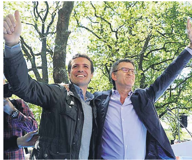
Casado y Feijóo, este sábado en O Pino (A Coruña).

Después irá a la Moncloa, donde tiene previsto informar a Sánchez de que será oposición a su Gobierno y pedirle explicaciones por la subida de impues-