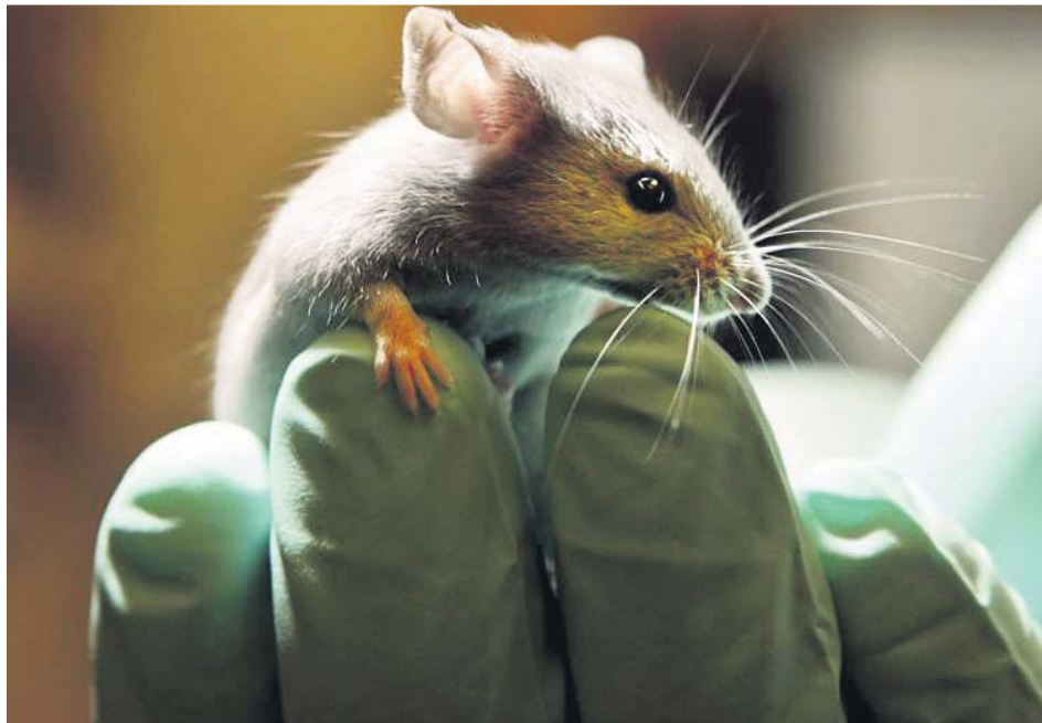
Los ratones fueron los animales con los que más se experimentó en España en 2017.

Cabe preguntarse si, gracias a este tipo de avances científicos y tecnológicos, a día de hoy se podría poner punto y final al testaje con animales. En España, solo en 2017 —último año con datos disponibles—, numerosas especies de animales fueron sometidas a distintos tipos de experimentos un total de 802.976 veces. El ran-