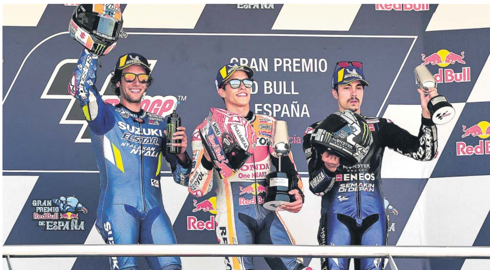
Márquez (c), Rins (i) y Viñales (d), en el podio tras lograr la primera, segunda y tercera posición, respectivamente, en el GP de España de MotoGP.