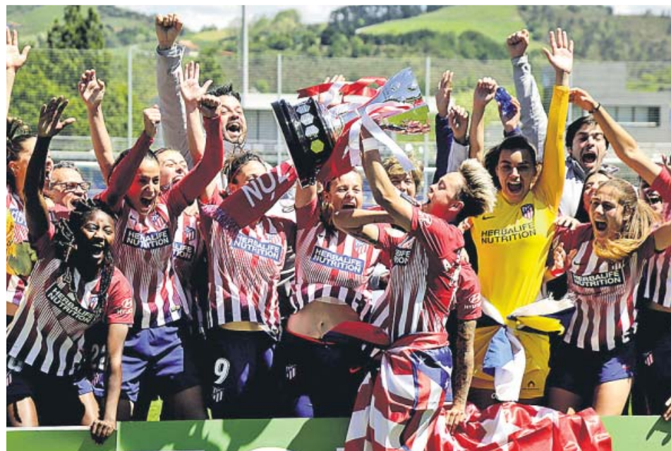
Las jugadoras del Atlético de Madrid celebran su victoria ante la Real y el título de Liga.

Las rojiblancas pusieron la guinda en Zubieta a una temporada casi perfecta. Descienden el Albacete y el Málaga