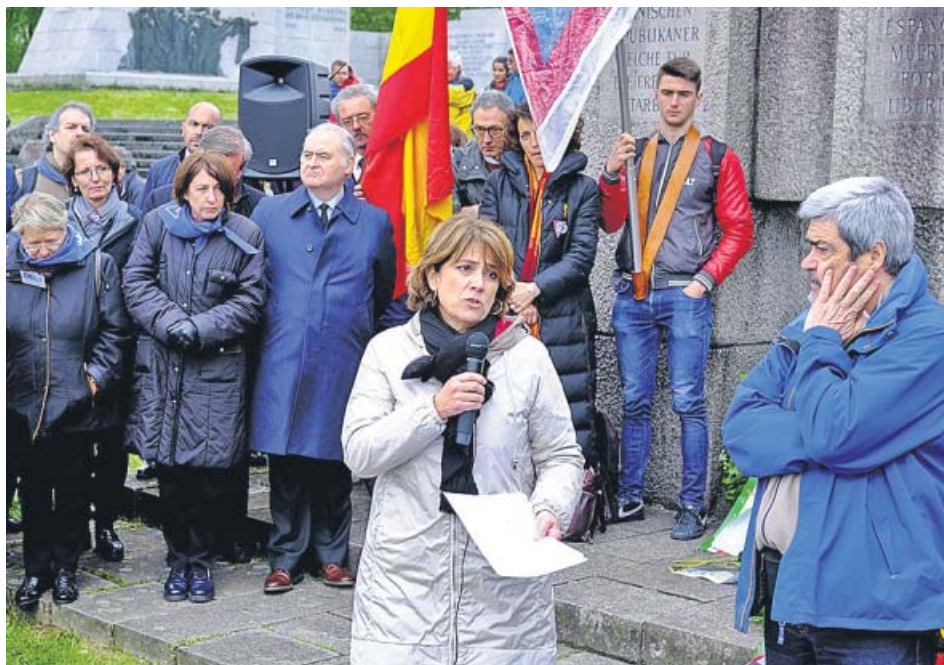
Delgado, ayer, durante un momento de su intervención en el campo de concentración.

La ministra de Justicia en funciones, Dolores Delgado, abandonó ayer un homenaje de la Generalitat a los presos españoles de Mauthausen (Austria) después de que se les comparara con los políticos en prisión preventiva por la consulta del 1-O. Delgado participó en varios homenajes en el antiguo campo de concentración nazi. Tras escuchar las palabras de la representante de la Generalitat, abandonó el lugar. Regresó después para la ofrenda floral. ●