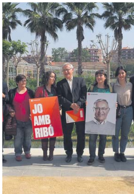
Ribó, a la izquierda, durante la presentación de la campaña electoral de Compromís. A la derecha, Sandra Gómez da a conocer el programa electoral del PSPV-PSOE.

MIRADA AL FUTURO. «Presento una campaña electoral en positivo, con propuestas; activa, con gente trabajando en los barrios, y pedagógica, para ex-