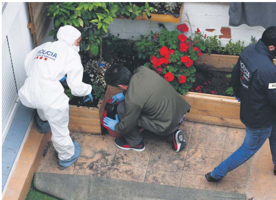
Los Mossos registraron ayer el domicilio de uno de los arrestados.