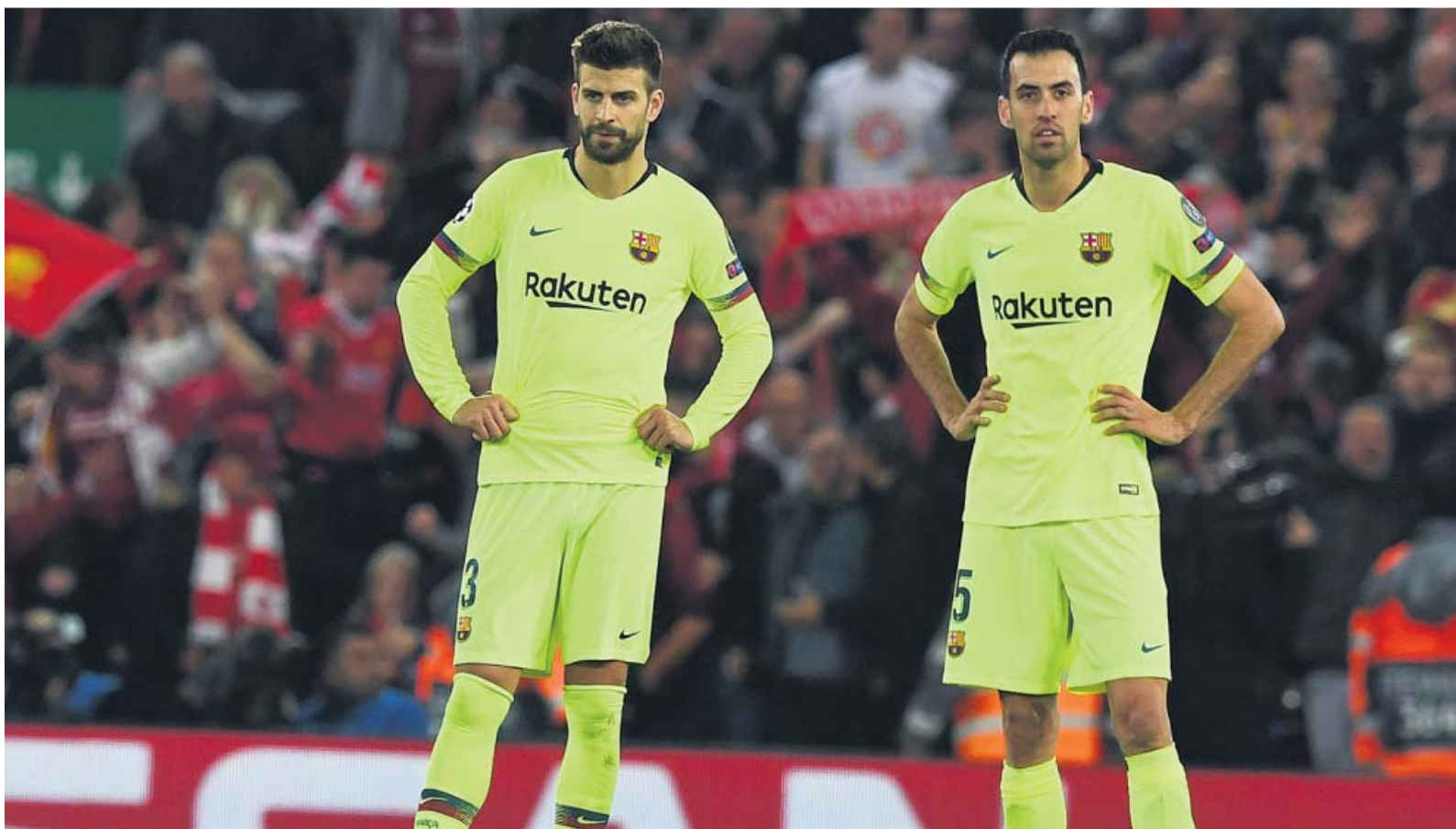
Sergio Busquets y Gerard Piqué se lamentan tras uno de los goles del Liverpool en Anfield.