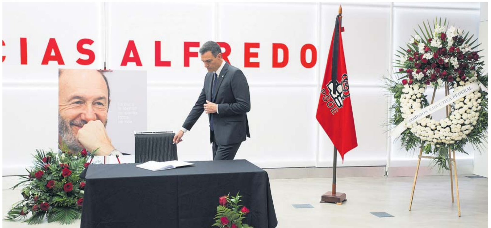
Pedro Sánchez, en el momento de la firma ayer del libro de condolencias dispuesto en la sede del PSOE, en Madrid.

La familia de Alfredo Pérez Rubalcaba enterró ayer sus cenizas en Tres Cantos y entregó al PSOE las flores recibidas para que las reparta en los mítines. En Ferraz, Pedro Sánchez escribió en el libro de condolencias que el exdirigente encarna el partido como «nadie de los que estamos hoy al frente». Tras un fin de semana de luto, el presidente regresa hoy a la campaña en Zaragoza. Más de 8.000 personas han pasado por la capilla ardiente en el Congreso. ● R. A.