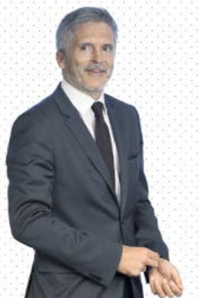
Fernando Grande-Marlaska Ministro del Interior

Me conmueve especialmente escribir estas líneas sentado en la misma silla que él ocupó durante largos y difíciles años. Cuando Alfredo Pérez Rubalcaba trabajaba en esta mesa, yo lo hacía desde la sala de lo Penal de la Audiencia Nacional. Nos unió nuestra lucha contra el terrorismo, cada uno desde nuestras responsabilidades, pero siempre desde un profundo respeto institucional que dio paso más tarde a la amistad.