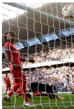
Courtois recibe un gol ante la mirada de Marcelo.

La Real despertó mediada la primera parte, el joven Barrenetxea comenzó a dejar pinceladas de la calidad que atesora y Oyarzabal entraba en juego pa-