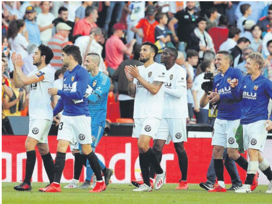
Varios jugadores del Valencia aplauden al público de Mestalla tras el partido.

Fue superior el bloque de Diego Pablo Simeone, y fruto de su dominio Koke adelantó