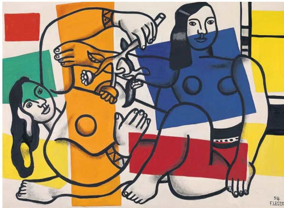
En grande, Deux femmes tenant des fleurs (Dos mujeres con flores), de 1954. Bajo estas líneas, Feuilles et coquillage (Hojas y concha), de 1927. A la derecha, Le pont (El puente), de 1923. * FERNAND LÉGER, VEGAP, VALENCIA, 2019

«Léger creía que en todos los objetos cotidianos podemos encontrar la belleza», explica el comisario Darren Phi. Su obra quería conectar con la clase obrera, deseaba crear un arte para toda la sociedad. «¿Crees que un trabajador quiere colgar un cuadro en su casa donde él se vea sudando en una fábrica? Seguramente prefiere un ramo de