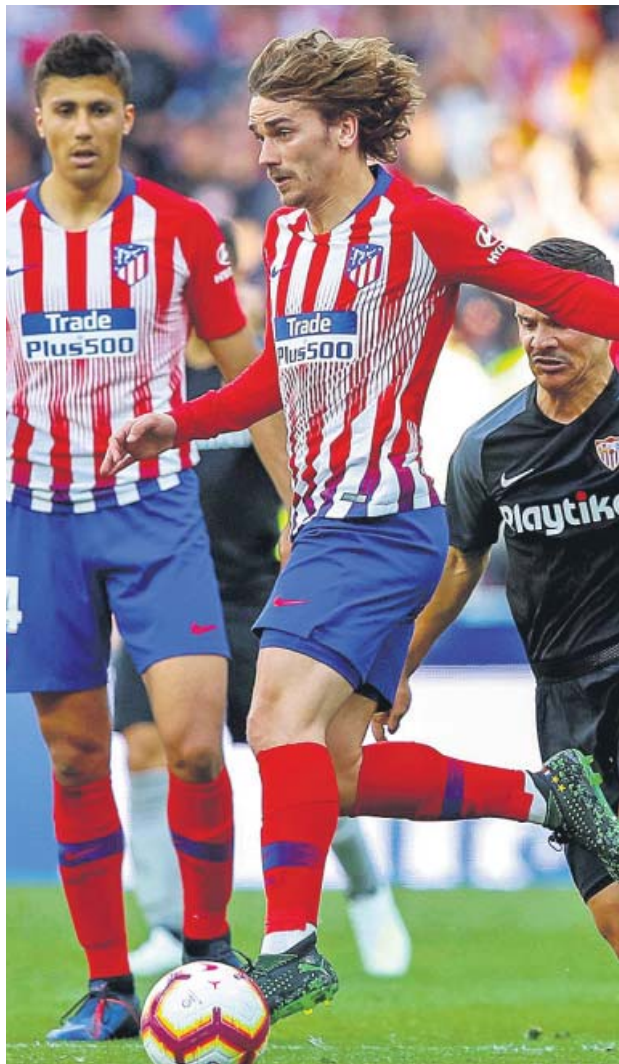
Griezmann, durante un encuentro ante el Sevilla.

Griezmann en un vídeo difundido por el club. «He tomado la decisión de irme, ver otras cosas, tener otros desafíos. Me ha costado coger ese camino pero es lo que necesito. Gracias por el cariño de estos cinco años en los que he ganado mis primeros trofeos importantes con un club. Han sido momentos que siempre recordaré. Os llevo en el corazón. No es fácil para un jugador tener tanto cariño».