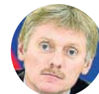
DMITRY PESKOV Portavoz del Kremlin ruso

«Sin lugar a dudas la guerra comercial entre EE UU y China tendrá consecuencias para el clima económico mundial»