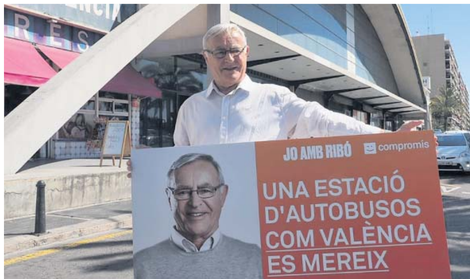
El alcalde y candidato de Compromís, ayer, junto a la instalación.

«Llevamos cuatro años dando la cara y escuchando y dialogando con los vecinos y las vecinas de los barrios y ahora continuamos haciéndolo en campaña para explicarles qué continuaremos haciendo para consolidar el cambio iniciado en 2015 y, entre todas y todos, conseguir la ciudad que queremos y merecemos», manifestó. ●