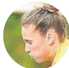
Sandra Paños ■ FC Barcelona ■ Portero