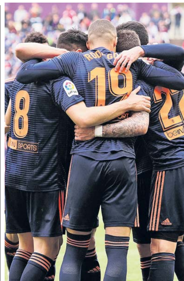
Los jugadores ché, durante su último duelo liguero.

Alonso volvió a McLaren en 2015, y desde entonces contó por desastres sus temporadas, que fueron cuatro. En la primera sólo puntuó en dos carreras; en la segunda fue décimo, lo que hizo concebir falsas esperanzas, como se vio en las dos siguientes: decimoquinto y undécimo en la general. Las flechas de plata no han vuelto a ser lo que eran. ●