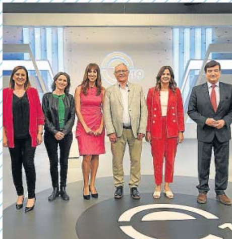
Los participantes en el debate.