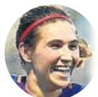
Mariona Caldentey ■ FC Barcelona ■ Centrocampista