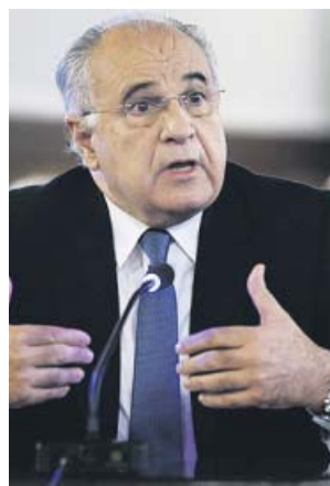
El exconseller, en una vista del primer juicio.

El letrado del ex jefe de área de la extinta Conselleria de Solidaridad dirigida por Rafael Blasco anunció al inicio de su intervención en la sesión de cuestiones previas que iba a ser «innovador» y pidió que se suspendiera el juicio o, en todo caso, que solo se celebre con aque-