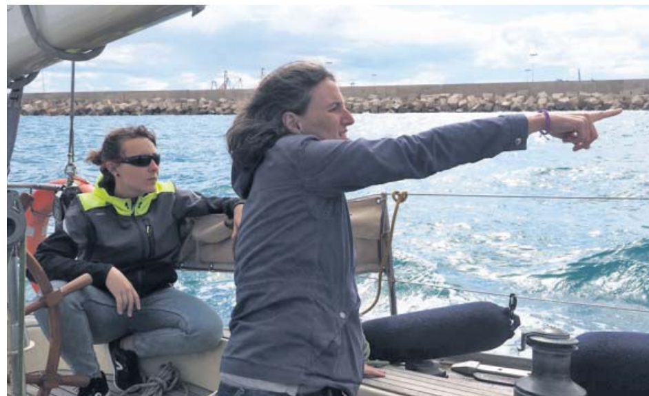
La candidata de Podem-EU a la Alcaldía, ayer, navega junto a la zona de la ampliación norte.