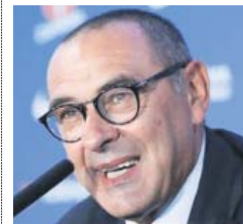
Maurizio Sarri Entrenador del Chelsea (60 años)

El argentino rechazó la llamada del Madrid y siguió trabajando en el Tottenham. A la chita callando, lo ha convertido en un equipo sólido y muy difícil de batir.