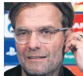
Jürgen Klopp Entrenador del Liverpool (51 años)

El alemán ha revolucionado al Liverpool hasta convertirlo en, posiblemente, el mejor equipo de Europa. Su personalidad le hace casi más popular que sus jugadores.