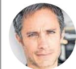
Gael García Bernal. Factory director, en Cannes

«¿Cómo podemos conciliar el día a día en un país como México, con tantos muertos, con tanta impunidad?»