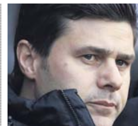
Mauricio Pochettino Entrenador del Tottenham (47 años)

El técnico español sabe dar a cada uno de sus equipos su impronta. Ahora, lucha por reverdecir viejos laureles con el Arsenal.