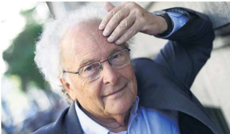
Eduard Punset, retratado durante una entrevista con 20minutos en 2013.

Aunque la situación entre el cantante y la actriz es menos temeraria, las aguas no bajan del todo tranquilas. Tal vez por eso se ha desentendido de todo lo que concierne a la venta de su casa. ●