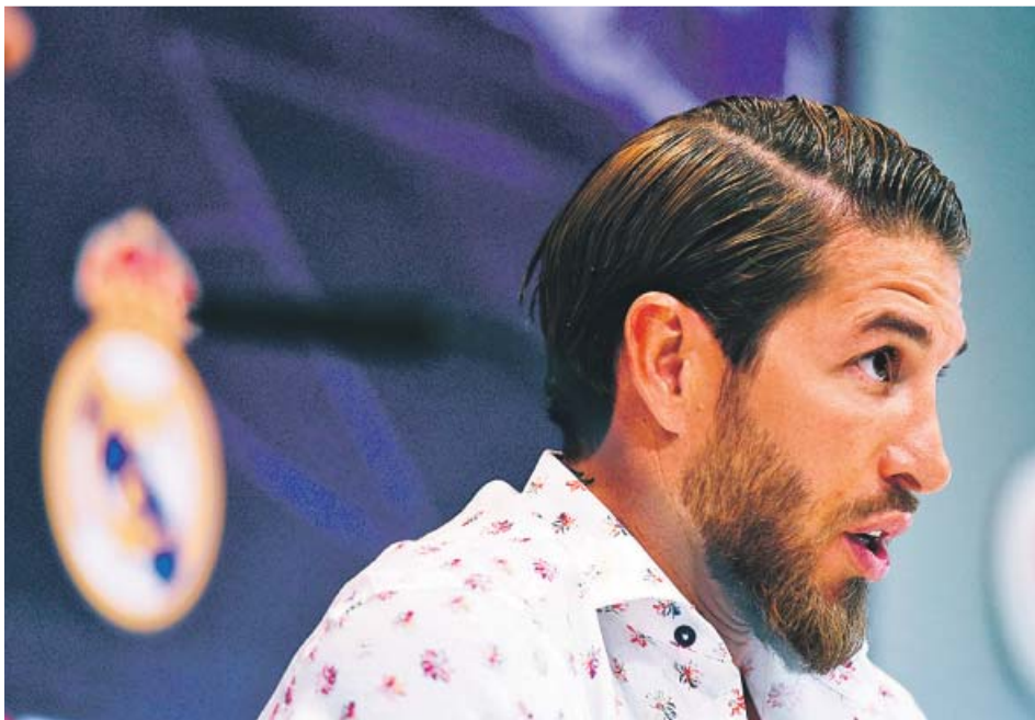
Sergio Ramos, durante la rueda de prensa de ayer.

El capitán calmó al aficionado, se lio con la oferta china y simplificó todo en un conflicto «entre padre e hijo» con Florentino, al que contradujo