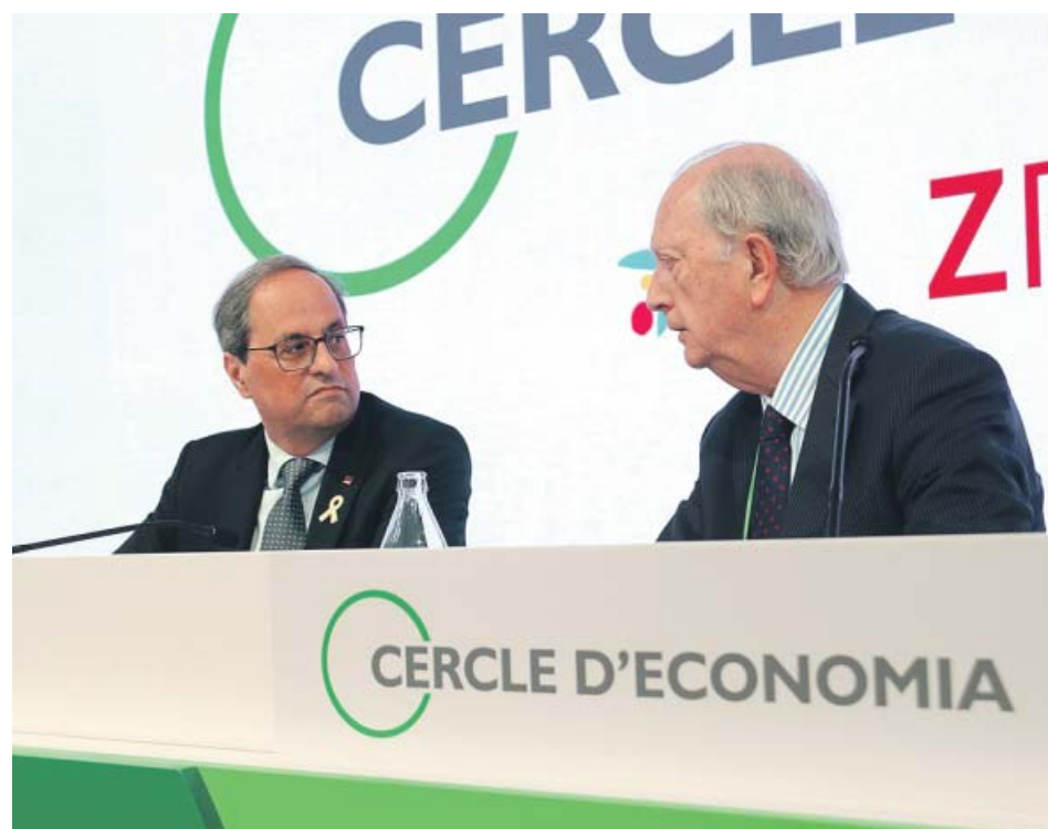
El presidente de la Generalitat y el del Círculo de Economía ayer, en la jornada inaugural.

ERC reformuló las características de su grupo en el Congreso mientras espera solventar en el Senado la falta de senadores por el que esta semana quedó en suspenso el grupo que quiere formar allí junto a Bildu. La suspensión de Raül Romeva descuadró las cuentas y la Cámara Alta dio a ERC y Bildu un plazo de cinco días para que sol-