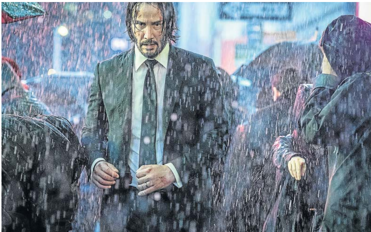
Más brutal, más oscuro y más pesimista: al wickverso se le está quedando cara de Keanu Reeves con Magdalena. EONE