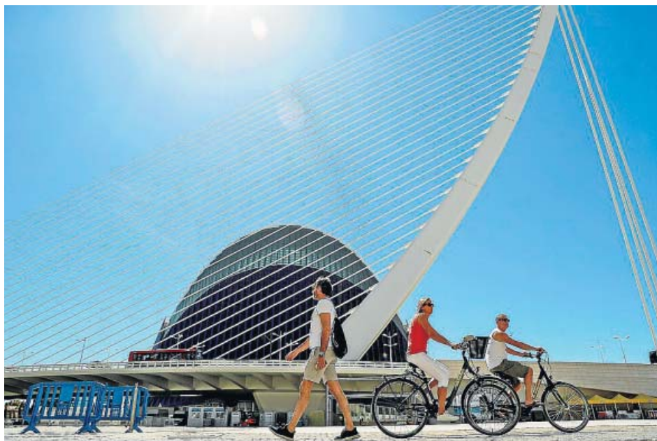
El puente de l'Assut de l'Or y el Àgora, en una instantánea tomada ayer.

Por sectores, tiró de la demanda en la hostelería (79,6 millones de euros) y en actividades inmobiliarias y empresariales (14,9 millones). Incluye un sector denominado economías domésticas, con 27,8 millones de euros, en el que se refleja el impacto económico inducido, es decir, el efecto arrastre que generan los salarios sobre las ventas y su efecto en el consumo. ●