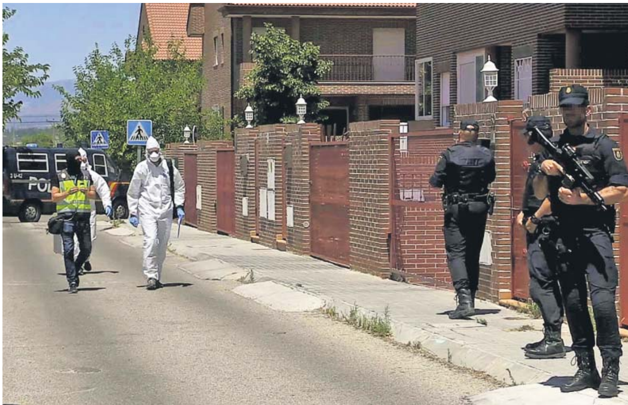
Efectivos de la Policía realizan un registro para acabar con la célula dedicada a la financiación de grupos yihadistas.

Por el contrario, Extremadura, donde el salario medio es más bajo de todo el país –1.471 euros mensuales– los sueldos subieron un 3,2%, lo que podría indicar una tendencia a la reducción de las desigualdades entre comunidades. ●