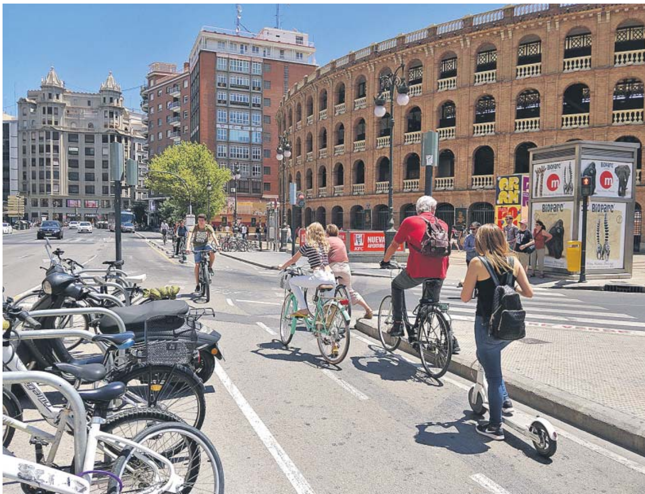
Usuarios del anillo ciclista, ayer, en su punto más transitado, a la altura de la plaza de toros.