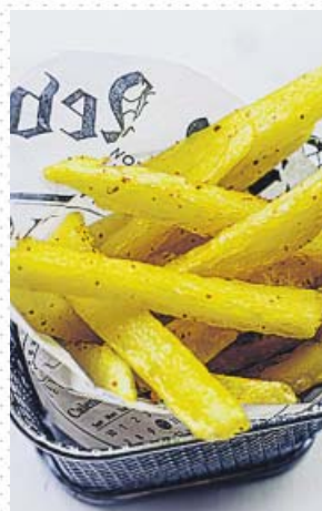
Así quedan las patatas fritas en versión light . E. G.

Para prepararlas, ponemos a hervir una olla con agua. Pelamos las patatas, las lavamos y las cortamos con la forma que queramos. Las dejamos en un recipiente con agua durante 5 minutos para que suelten almidón y las enjuagamos. Las echamos en la olla con agua hirviendo y