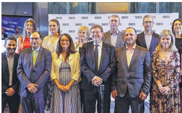
Puig y el resto del Consell en la Cadena Ser, ayer.

El 'president' también se marca como objetivo que la tasa de desempleo se sitúe por debajo del 10% en la Comunitat