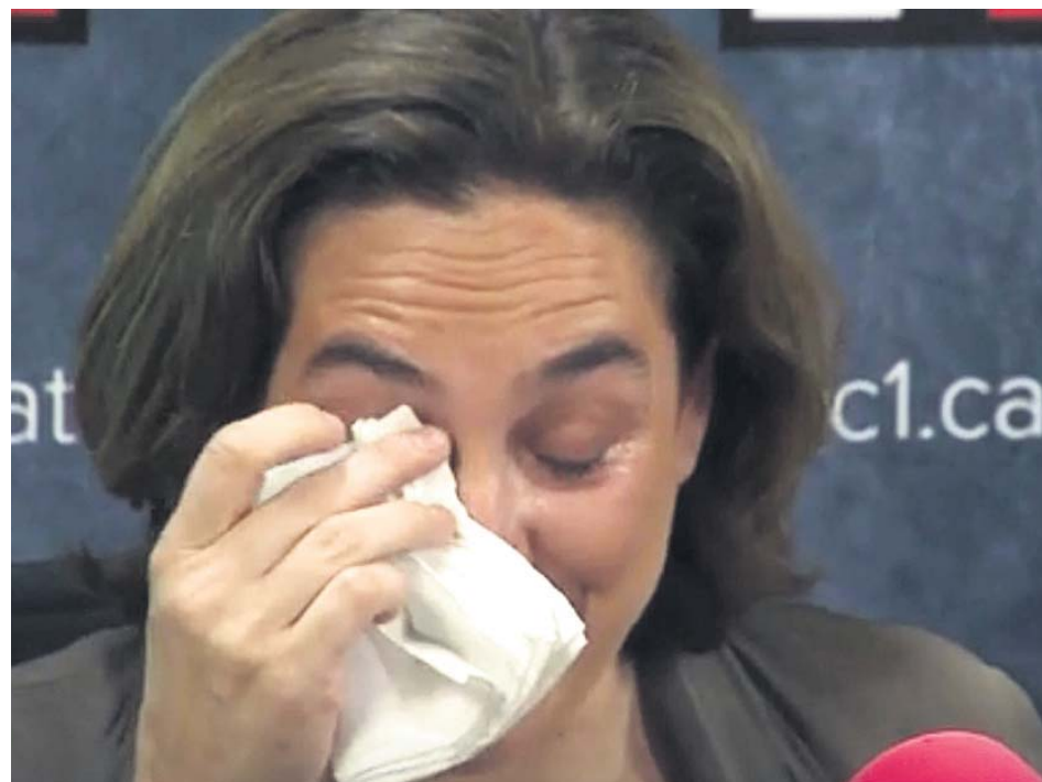
Ada Colau se seca las lágrimas tras emocionarse y reconocer que se planteó dejar la política.

Este contexto obliga, más si cabe, a Colau a intensificar los contactos con otros grupos como ERC y JxCat, con el objetivo de tener su apoyo a lo largo de la legislatura. ● E. ORDIZ