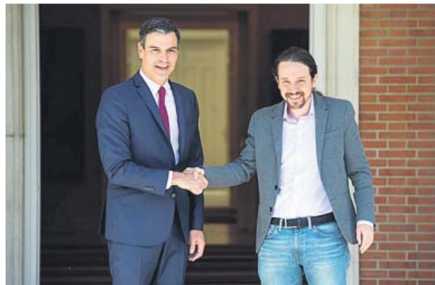
Sánchez e Iglesias, en su primera reunión tras el 28-A.

LOS CONTACTOS aún se prolongarán durante semanas y todavía más tardará en llegar la investidura AYER se cumplieron cinco meses desde los últimos proyectos de ley que Sánchez envió al Congreso