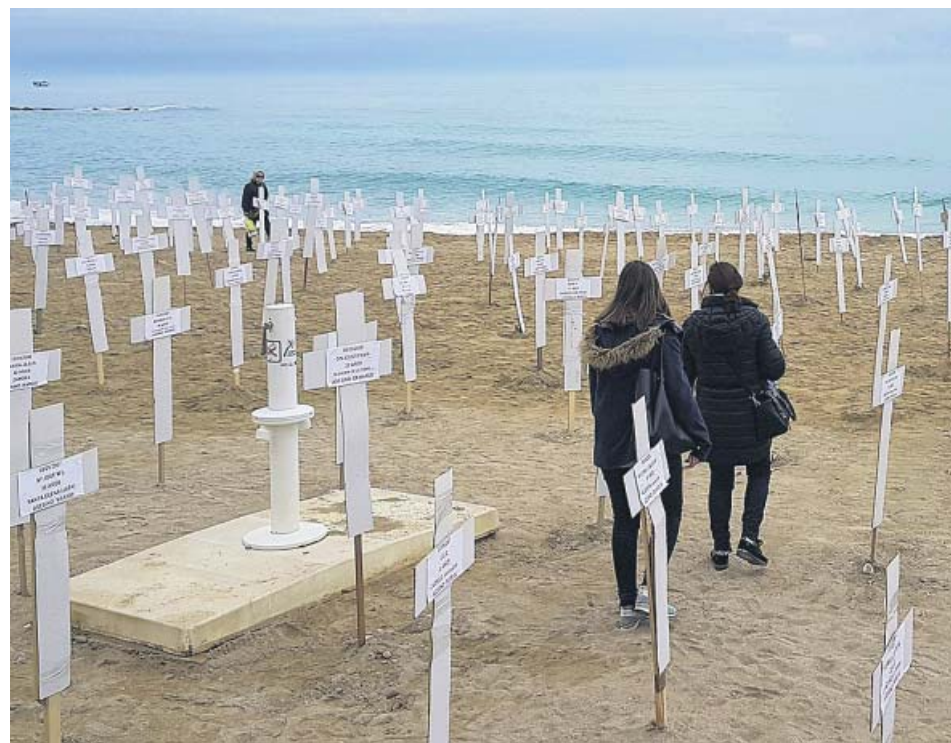
Mil mujeres han sido asesinadas por la violencia de género en España desde 2003.

¿Cómo ve la relación con España? La población siente afecto por mi país. No siempre se ha traducido a la política y ha habido jefes de Gobierno que se prestaron a hacerle el juego a EE UU. Me parece interpretar que hoy se abre un camino distinto.