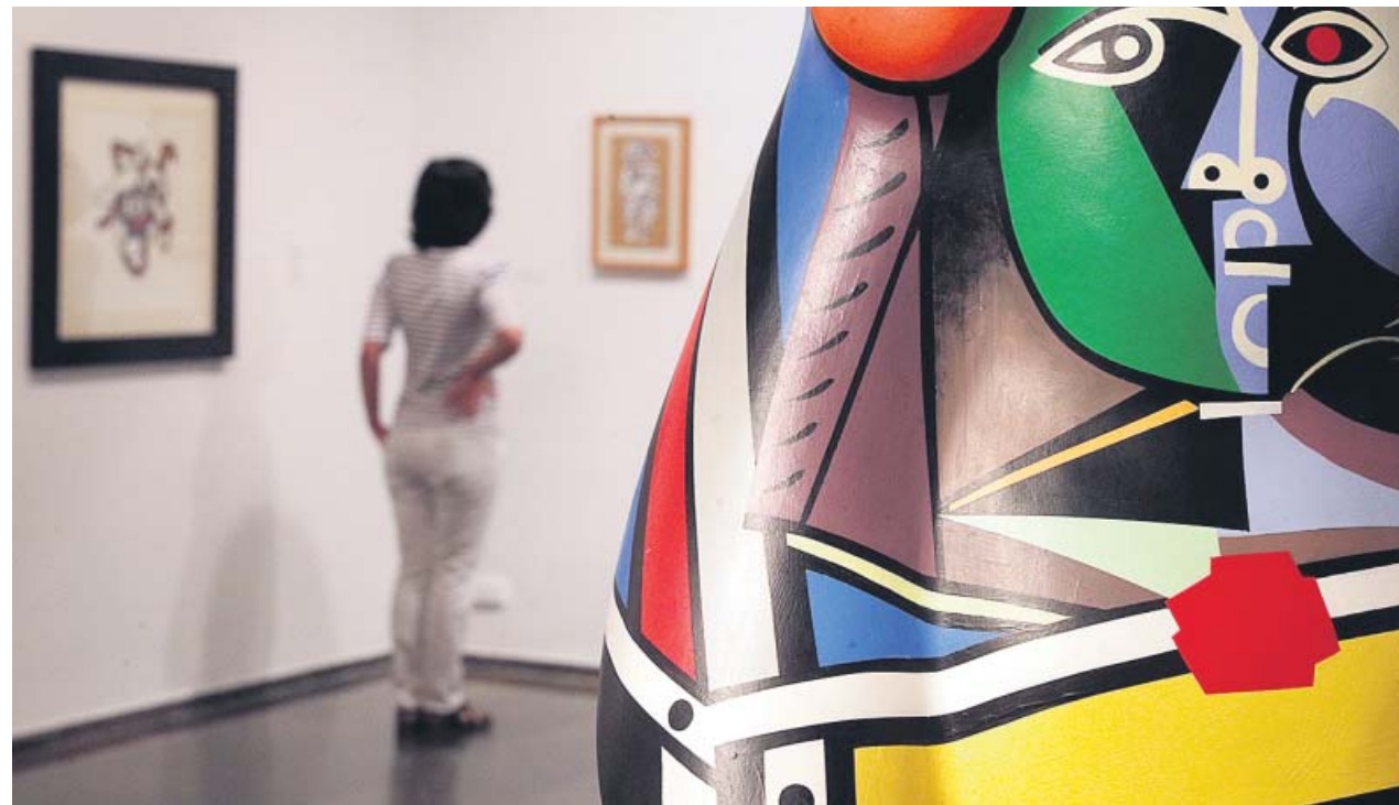
La exposición podrá visitarse hasta el 8 de septiembre en el IVAM.

El Instituto Valenciano de Arte Moderno (IVAM) de València ha establecido un diálogo entre Fernand Léger y el Equipo Crónica, sobre la influencia que el pintor cubista francés ejerció en la obra del grupo artístico valenciano y su visión social del arte. La muestra, titulada Caso de Estudio: Equipo Crónica, mirándose en el espejo de la vanguardia , reúne cerca de 80 obras realizadas por Rafael Solbes y Manolo Valdés entre 1969 y 1982, así como originales de Léger y de Jean Dubuffet. ●