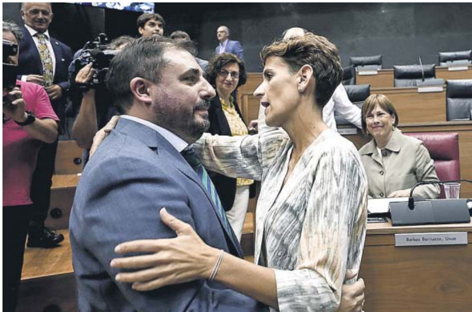
El presidente del Parlamento de Navarra, Unai Hualde, con la socialista María Chivite.

LOS 'ABERTZALES' logran una plaza en la Mesa del Parlamento foral tras un pacto entre el PSN y Geroa Bai