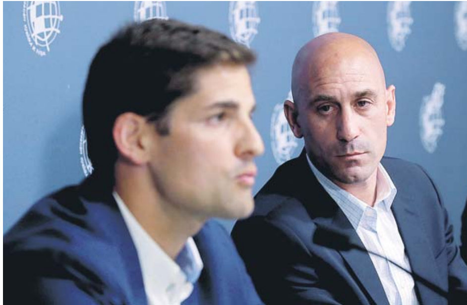
Robert Moreno, el nuevo seleccionador, observado por Luis Rubiales, presidente de la RFEF.

Desde la RFEF siempre se transmitió que se esperaba al asturiano lo que fuera necesario, pero ha sido el propio Luis Enrique el que ha dado el paso adelante y ha decidido abandonar el cargo. «Luis Enrique comunica que no va a seguir. Sabemos que hasta ahora habéis respetado esta situación y os pedimos que lo sigáis haciendo. Dar las gracias a Luis, un tipo que se ha portado 10 con nosotros y con el que no tenemos ningún reproche. Estamos unidos a él y seguiremos unidos, le he transmitido que siempre va a tener nuestras puertas abiertas», explicó ayer Luis Rubiales, presidente de la Federación Española, en una rueda de prensa convocada casi contrarreloj para anunciar la decisión del asturiano.