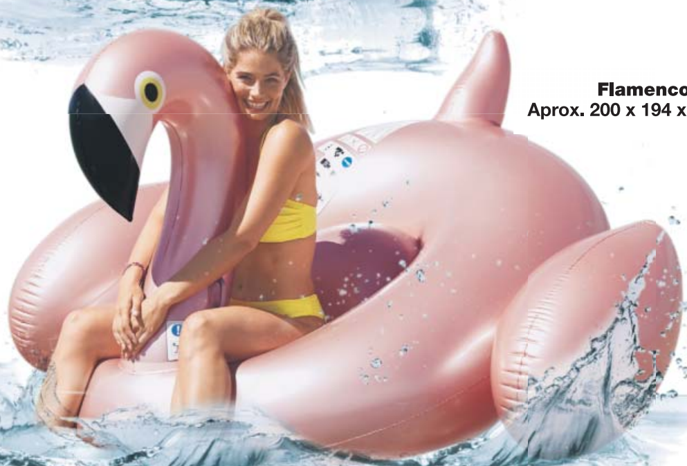
Flamenco Aprox. 200 x 194 x 126 cm.