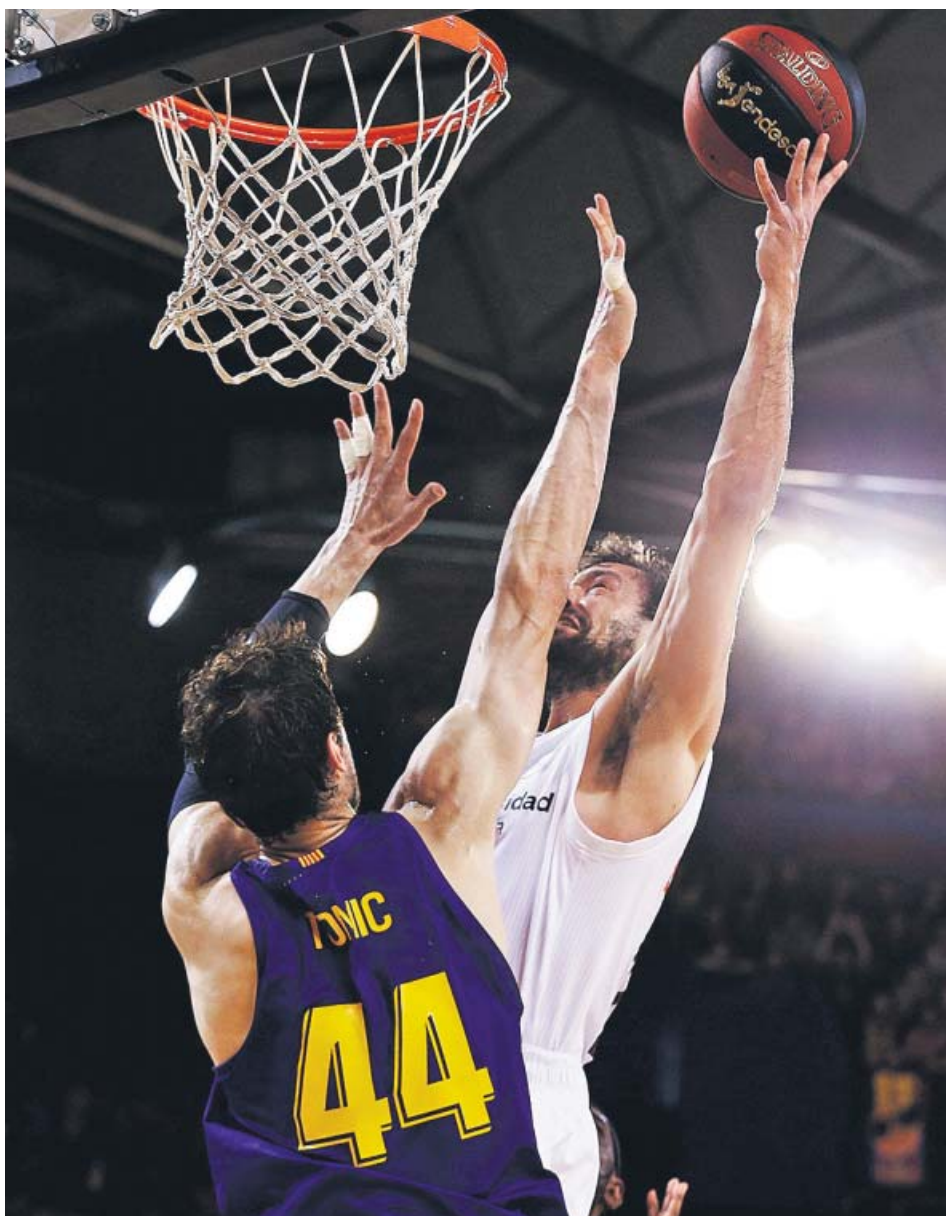
Sergio Llull entra a canasta ante el pívot croata del Barça Lassa, Ante Tomic.