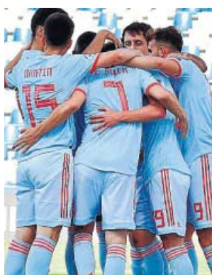
Los jugadores de la sub-21 celebran uno de los goles.

España acarició el segundo gol, en una jugada de Oyarzábal que no finalizó Borja Mayoral, y en una falta de Ceballos, pero el mazazo llegó en una extraña jugada en la que