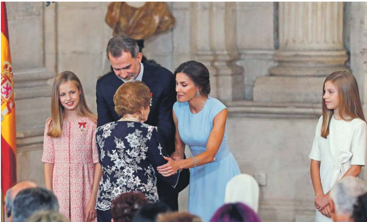
Los reyes, la princesa Leonor y la infanta Sofía, ayer durante la entrega de medallas.