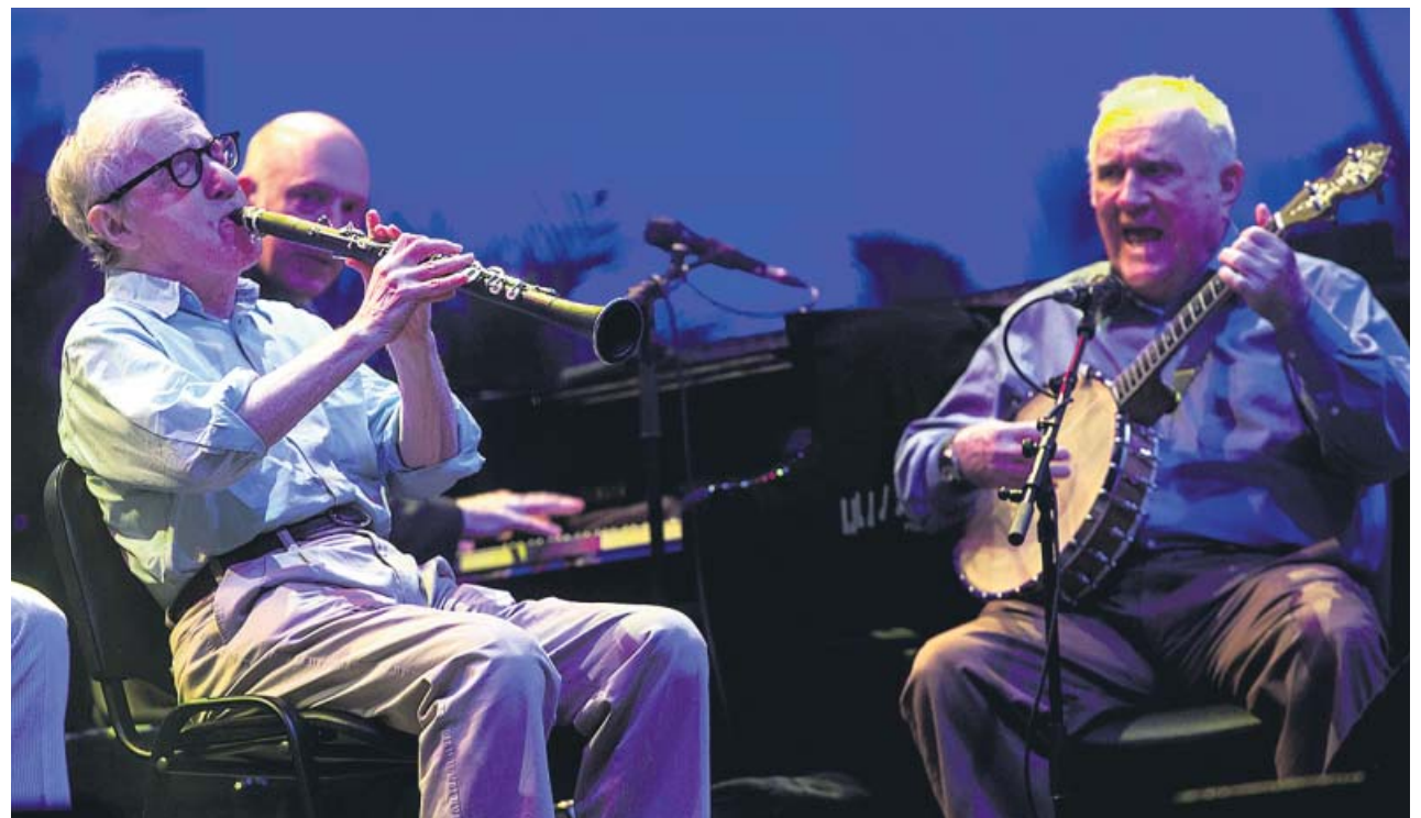
El cineasta Woody Allen durante su actuación, anteayer, en el Festival Jardines de Pedralbes de Barcelona.