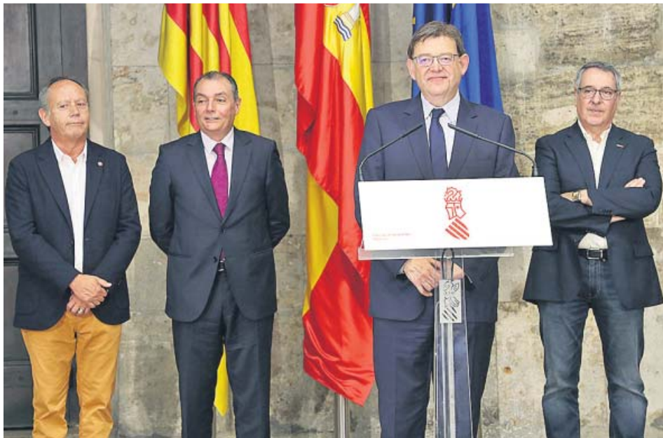
Comparecencia de Puig junto a los representantes de la patronal y los sindicatos.

El 'president' se reunió ayer con patronal y sindicatos para sentar las bases y llegar a los objetivos económicos y sociales