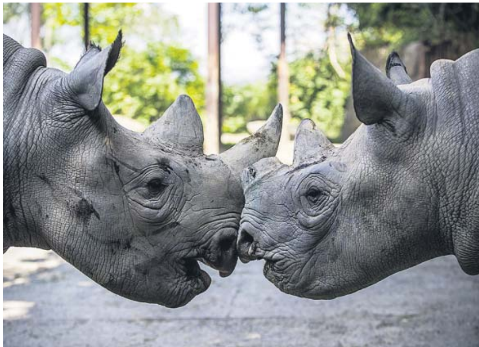
Olmoti (i) y Jasiri, rinocerontes negros, en su recinto del safari de la República Checa.

Un estudiante de Erasmus de la Universidad de Cantabria falleció el pasado sábado ahogado en una piscina, según informó ayer el centro universitario hispalense.