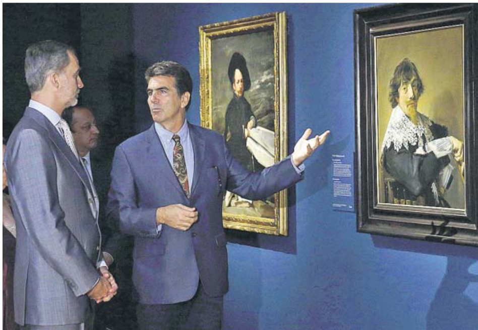
Felipe VI, en la inauguración de Velázquez, Rembrandt y Vermeer. Miradas afines.