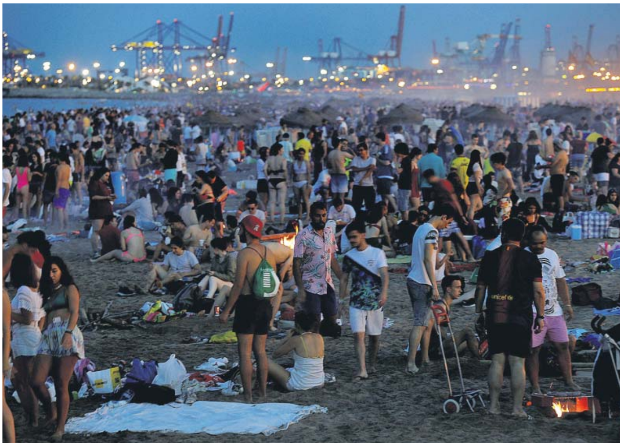
Miles de personas celebraron la noche de San Juan en la playa de la Malvarrosa de València.