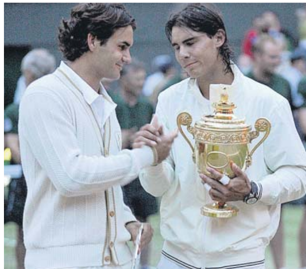
Federer y Nadal, en una de las finales que ambos jugaron.

El ranking se la trae un poco al paio a Wimbledon, la cuarta gran cita del planeta tenis. Hasta 2001, su lista de cabezas de serie respondía a cri-