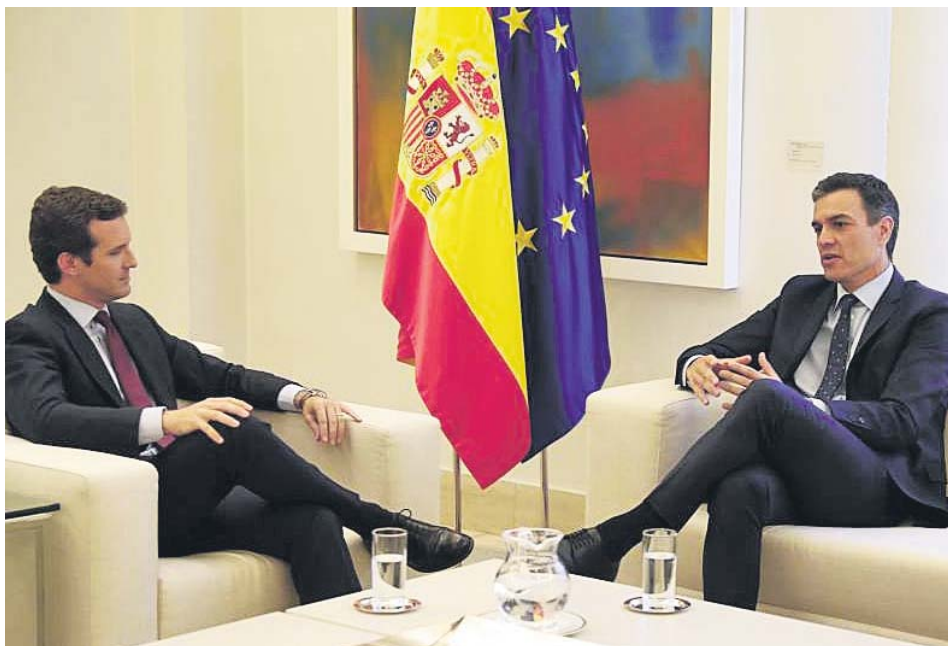
Sánchez y Casado, en una reunión en Moncloa justo después del 28-A.