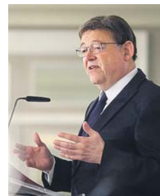
El jefe del Consell, ayer, en su intervención.

El jefe del Consell criticó de nuevo la «alianza de las derechas y los independentistas» por tumbar el proyecto de Presupuestos Generales del Estado (PGE) de 2019 que contemplaba el 10% de inversiones para la región. Puig proclamó que su meta es un sistema de financiación «para toda España, no solo para la Comunitat, donde los ciudadanos «solo llegaron a la media de fondos por habitante cuando (José Luis Rodríguez) Zapatero» —expres-