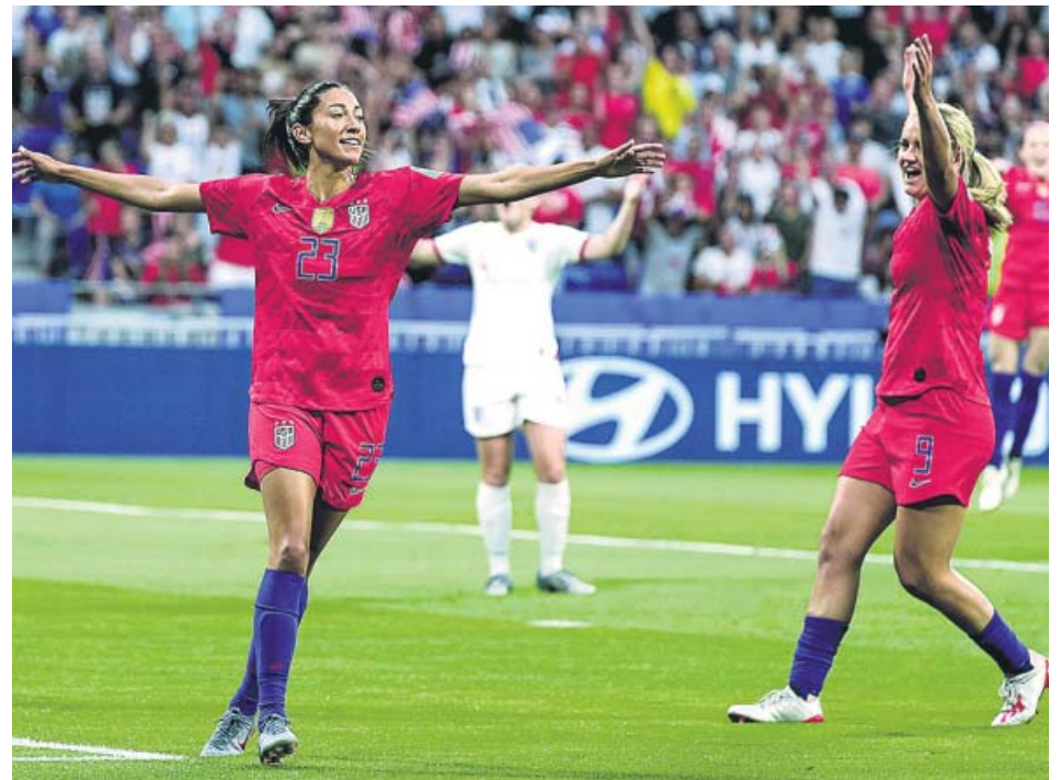
Las jugadoras de Estados Unidos celebran uno de sus goles.

El entorno del brasileño sigue trabajando en su regreso. El asesor del club azulgrana en Brasil, André Cury, ha sido el último en confirmar el deseo del jugador, al participar en una encuesta de 'Esporte Interactivo' titulada «¿A qué destino os gustaría que fuese Neymar?». Su respuesta fue rotunda: «Su casa es Barcelona». Además, Rakitic fue cazado ayer en un avión a París. ¿Para negociar su fichaje por el PSG? ●