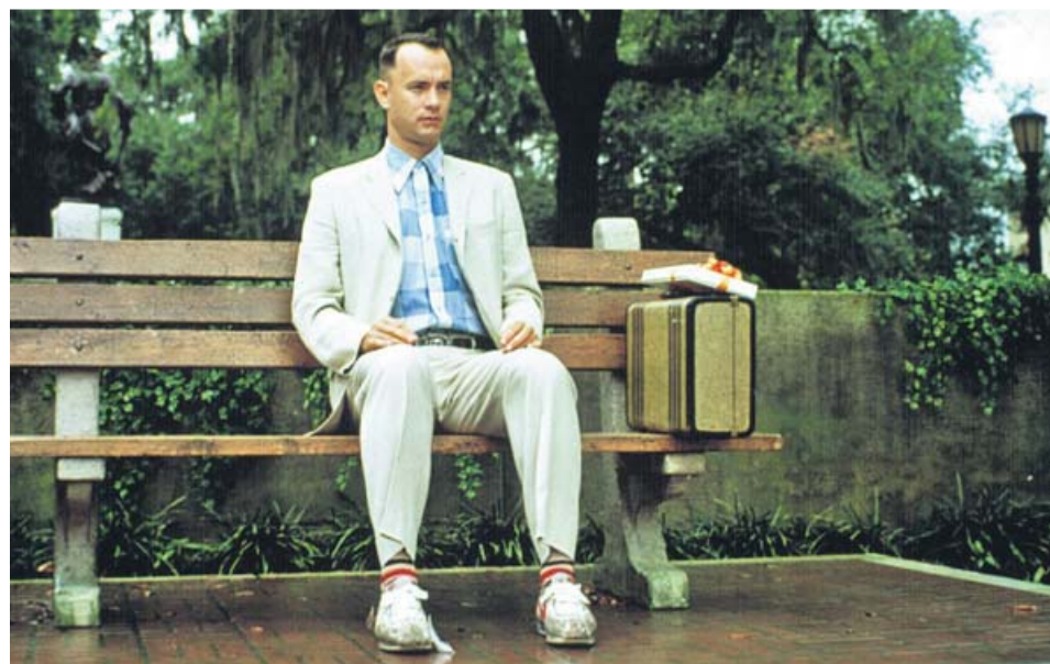
Forrest Gump (Tom Hanks) sentado en un banco con su caja de bombones.

Forrest Gump es una historia ejemplar de superación personal, pero también de la extraordinaria relación del protagonista con su madre (Sally Field) o con el amor de su vida, Jenny (Robin Wright). A todo ello hay