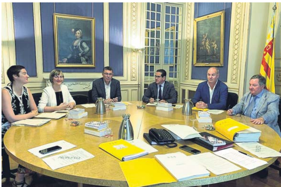
Los cinco miembros de la Mesa junto al letrado (i), en su reunión de ayer. CORTS VALENCIANES

En cualquier caso, insistió en que el cambio de la financiación es un «requisito previo e ineludible» para que sea «posible» su proyecto de legislatura en los próximos cuatro años, al tiempo que mostró su confianza en que el nuevo Gobierno central sea «sensible y cómplice» a los intereses y reivindicaciones de los valencianos. ●