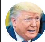
DONALD TRUMP Presidente de EE.UU. sobre la fiesta del 4 de julio

«Hay que tener mucho cuidado con los tanques porque las calles tienen tendencia a que no les gusten»