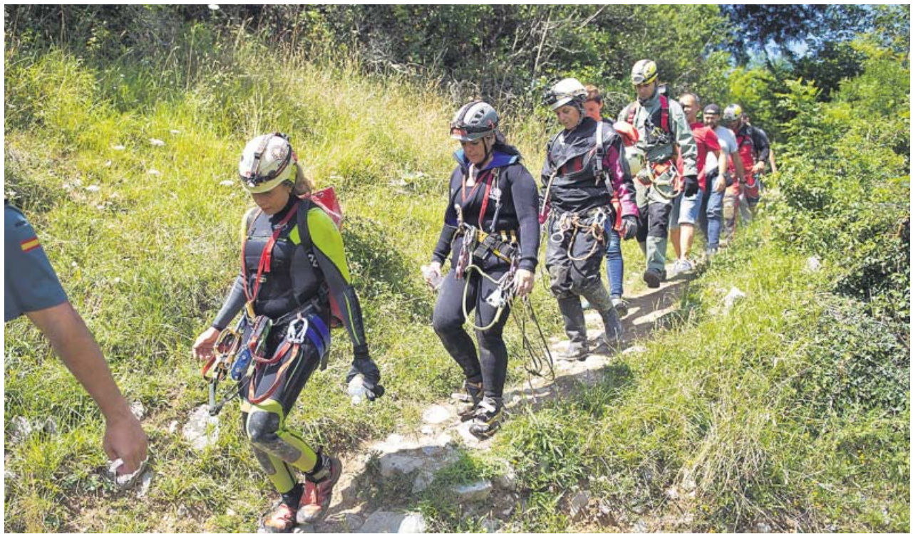
Las tres espeleólogas, ayer, tras su salida de la cueva acompañadas de los miembros del Greim y agentes de la Guardia Civil.

En este enlace puedes consultar más artículos relacionados con el rescate de las tres espeleólogas en Cantabria