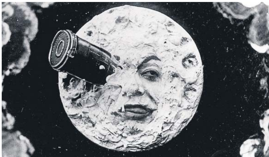
La ya mítica imagen de la Luna en el cortometraje de Méliès de 1902.

En realidad, no era un sistema menos increíble que el utilizado en La gran sorpresa ( The First Men in the Moon ) una producción británica de 1964 que adaptaba la novela de H. G. Wells. La astronave funcionaba también sin combustible, simplemente se elevaba gracias a una sustancia llamada cavorita , denominada así por su propio descubridor (el ficticio científico Joseph Cavor, interpretado por el actor Lionel Jeffries en el filme). Bastaba solo con