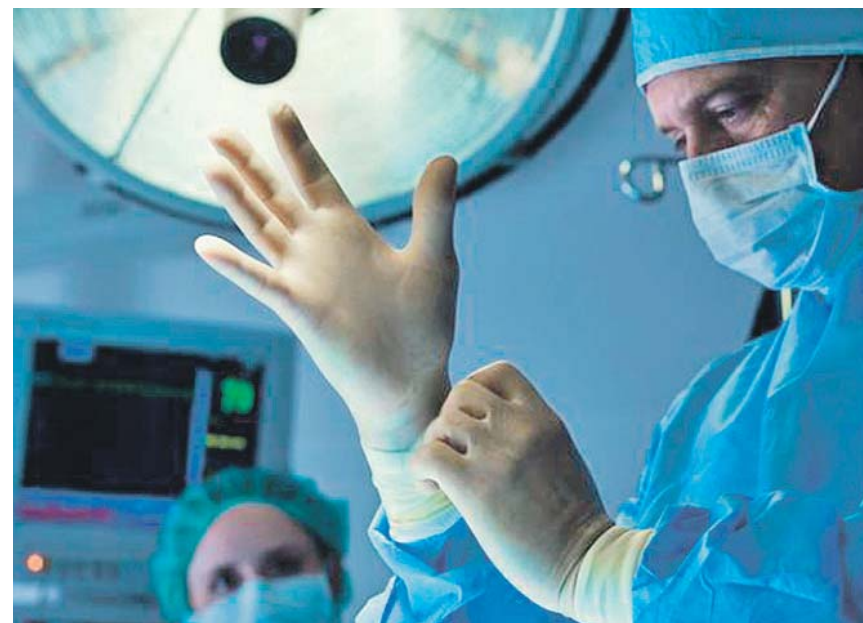
La liposucción para eliminar grasa localizada es la cirugía estrella entre varones.

1. Finalmente, el primero de septiembre (día también crítico en las estaciones y carreteras de España), transcurrirá el cuarto y último paro convocado por el sindicato.