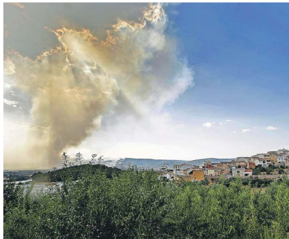
Vista de la zona afectada por el incendio declarado en un paraje de Beneixama (Alicante).

El incendio forestal de Beneixama (Alicante) había arrasado ayer, al cierre de esta edición (23.00 h), más de 830 hectáreas y todavía no estaba perimetrado. Además, las llamas, que comenzaron sobre las 14.05 h, había obligado a desalojar a más de 80 personas de la zona, con la intervención de medios terrestres, aéreos y la UME. El foco está situado en un barranco de difícil acceso, lo que unido a las elevadas temperaturas hizo que se propagara de forma muy rápida. El desalojo es «la primera decisión que se ha adoptado», explicó la consellera de Interior, Gabriela Bravo. ●