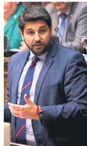
El candidato a la investidura, Fernando López Miras. PP

Ayer tuvo lugar la tercera reunión desde entonces y las partes reconocen que «hay avances» aunque el acuerdo todavía no está cerrado. El secretario general del PP, Teodoro García Egea, se mostró optimista por la marcha de estos contactos y, como también an-