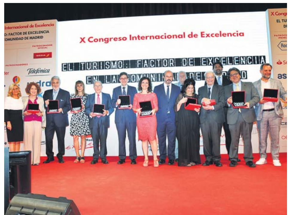
Los galardonados en el X Congreso Internacional de Excelencia celebrado en Madrid.

En 2018, asimismo, se produjeron 102.299 accidentes con víctimas, en los que murieron 1.806 personas (un 1,3% menos) y 138.609 resultaron heridas, de las que 8.935 precisaron hospitalización (25 al día). ●