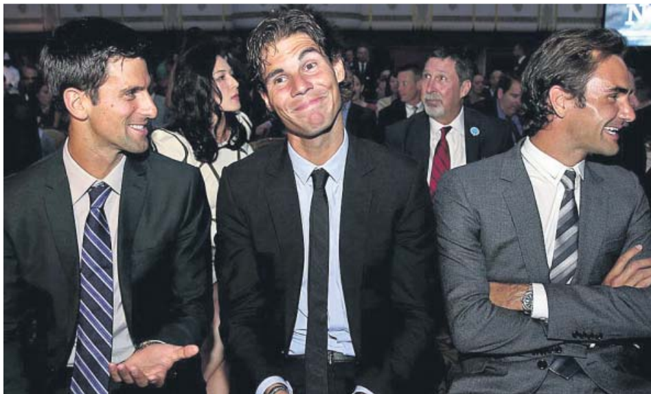
Djokovic, Nadal y Federer, en una foto de archivo.