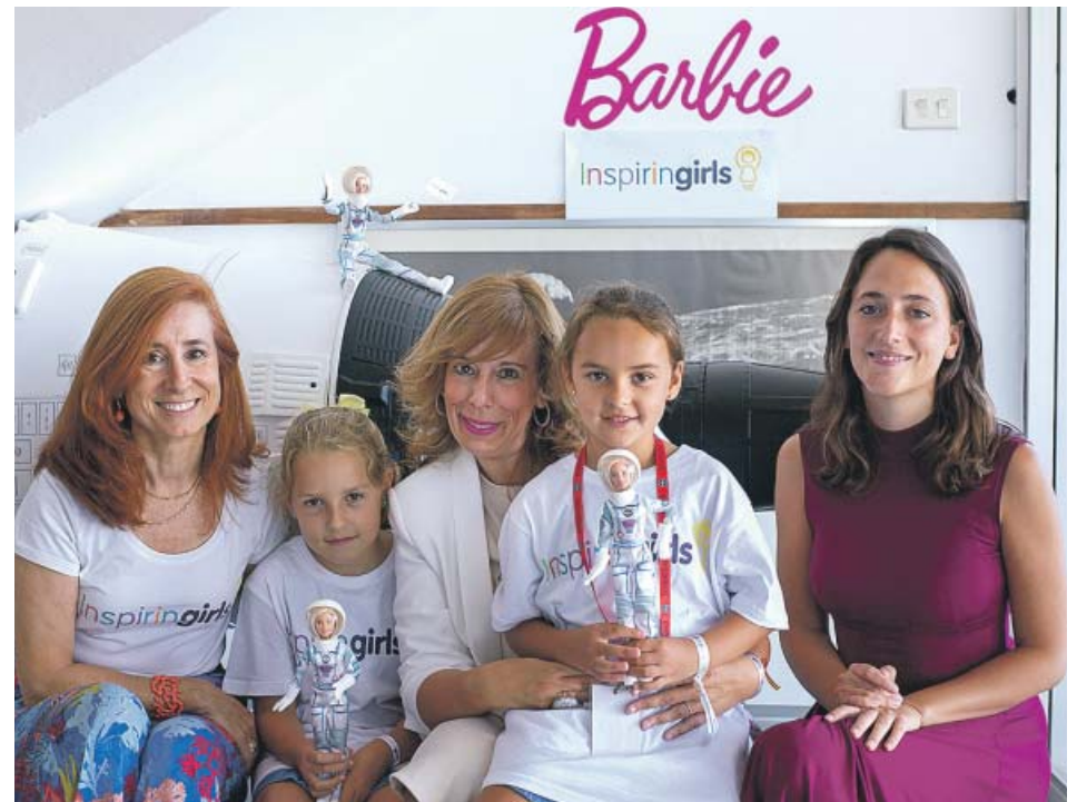
Las dos pequeñas junto a la Barbie astronauta en el Centro Espacial Maspalomas. FIRMA

20M.ES/ACTUALIDAD Política, economía, sociedad... consulta toda la actualidad diaria en la web de 20minutos.es .