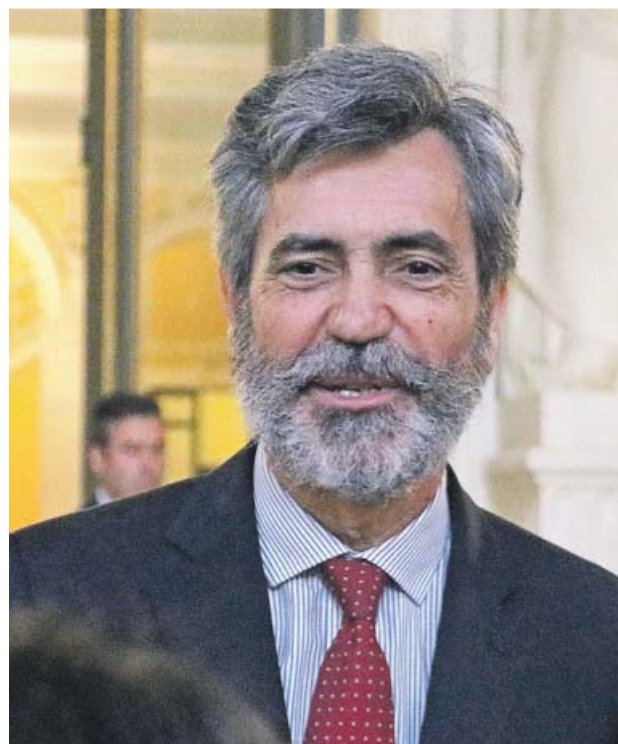
Imagen de archivo del presidente del CGPJ, Carlos Lesmes.

Un portavoz del Departamento de Justicia negó ayer rotundamente a la agencia Efe que la Conselleria haya intentado acceder a información reservada y precisó que el mensaje aparecido en el ordenador de los juzgados se ha enviado a todos los trabajadores de la Generalitat, en el marco de una iniciativa que pretende recordarles que los equipos informáticos son para uso estrictamente laboral, no para fines personales.