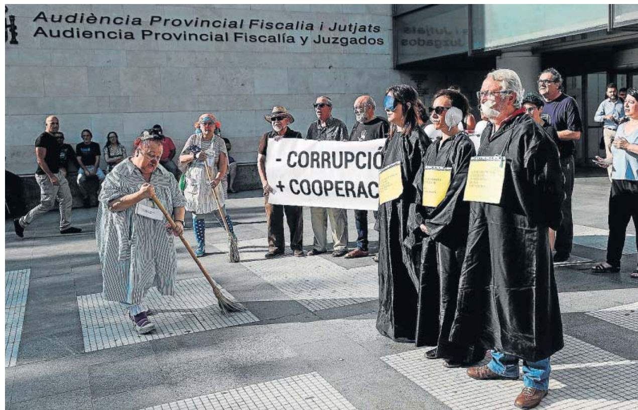
Miembros de diferentes ONG, ayer, durante un momento de la concentración en la Ciudad de la Justicia.

La entidad pidió apoyo «unánime» a los afectados, pues en caso contrario, «muchos tancats [las zonas de los arrozales] se verán obligados a dejar de cultivar». Sobre la posibilidad de ser sustituidos en su tarea por la Dirección General del Medio Natural, este organismo advirtió: «Ya veríamos lo que pasaba, porque la vigilancia es 24 horas al día los 365 días del año, y eso no lo aguanta ningún cargo ni funcionario». ●