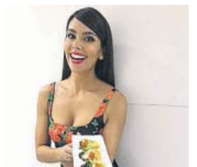
Pedroche posa con su plato.

La presentadora sorprendió en Instagram presumiendo de dotes culinarias: «Os juro que lo he hecho yo sola, ahora ya llevo la gastronomía dentro de mí y hasta sueño con recetas». El plato (cogollos de lechuga, langostinos, huevas de trucha, mayonesa de aguacates, cebollino y lima) ha desatado los rumores sobre si veremos a Cristina Pedroche tras los fogones de forma profesional. Además, lanzó una encuesta en Instagram preguntando a sus seguidores si acudirían a su restaurante si ella fuera la cocinera.