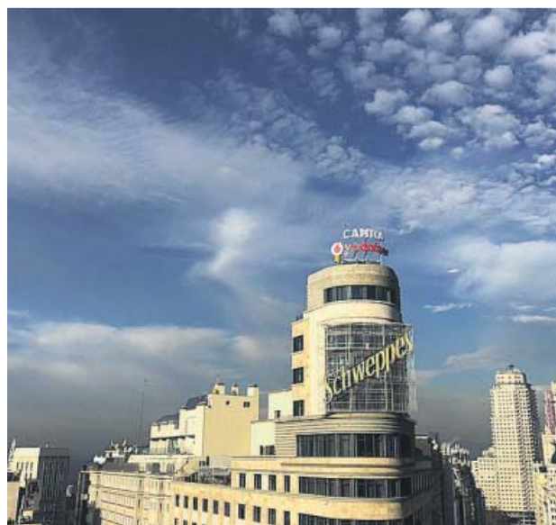
Arriba, vista aérea de la ciudad de Barcelona con el cielo encapotado. Abajo, vista de Madrid desde Gran Vía.

Central impuesta por el nuevo gobierno municipal, encabezado por Martínez-Almeida, y que han invalidado sendos juzgados madrileños. Aunque en Bruselas dicen que no comentan «medidas específicas tomadas a nivel local», sí especifican que la moratoria «no ayuda». Pero, aunque haya sumado, esta no sería la única razón. De hecho, en Barcelona ni siquiera se han llegado a implantar las zonas de bajas emisiones para episodios de alta contaminación. Además, Ecologistas en Acción recuerda que varios de los países que fueron llevados al TJUE en 2018 consideraron un «agravio comparativo» la decisión de excluir a España.