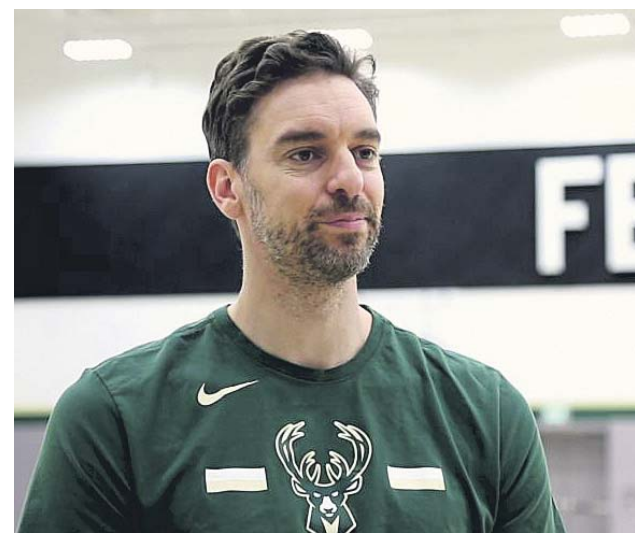
Gasol, con la camiseta de los Bucks.

Estados Unidos, el equipo imbatible de Adam Krikorian, espera en la final. «Lo que ya está (hecho), ya está (hecho). Nos quedan 48 horas para una final. Vamos a apoyarnos unas a otras». La final es el próximo viernes a las 11.30 h. Para hoy queda la semifinal masculina: España buscará también la final ante Croacia, otro coco. ●