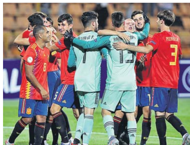
Los jugadores de la Rojita se felicitan tras la victoria.

La mejor ocasión para Francia llegó en el minuto 31, cuando Flips mandó la pelota al palo tras un pase de Ndika. Un aviso para España, que espabiló y se fue al vestuario dominando el juego. En la reanudación, los de Denia salieron igual de animados, pero no lograban crear peligro. Así fue pasando el tiempo: mucho toque y pocas oportunidades para llegar a la prórroga.