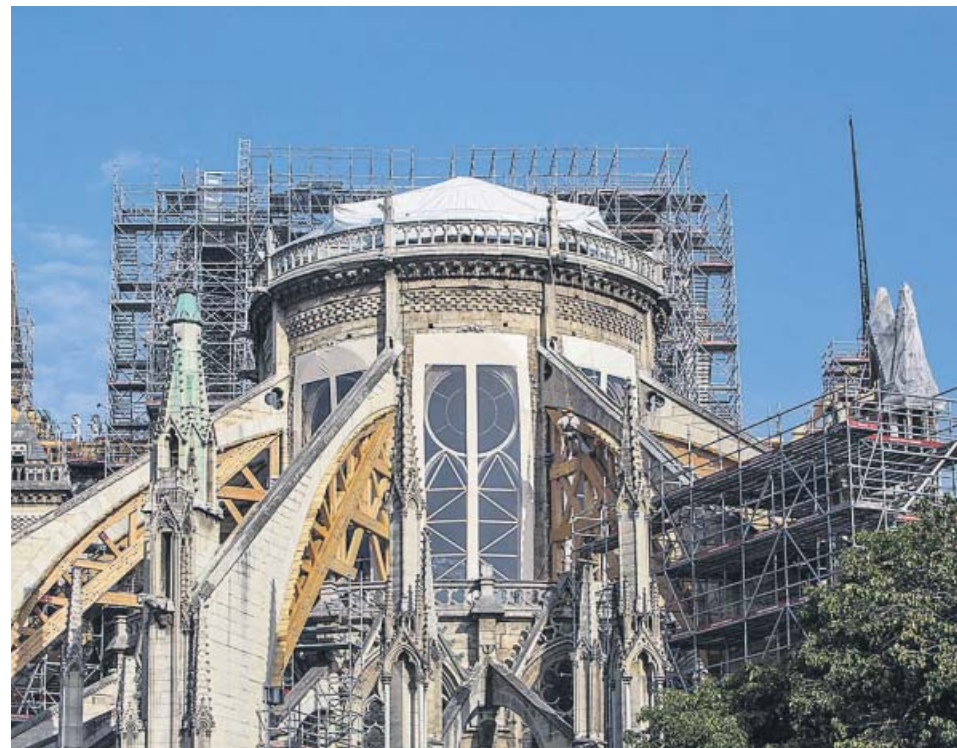
Los trabajos de restauración avanzan en la catedral de Notre Dame.

Los hechos se encuentran en conocimiento de los Mossos d'Esquadra desde diciembre del año pasado y las investigaciones se están llevando en secreto por la sensibilidad del caso. El niño fue retirado de la institución en la que se produjeron los hechos, —el Col·legi del Roser, un centro concertado— en febrero del presente año. ●