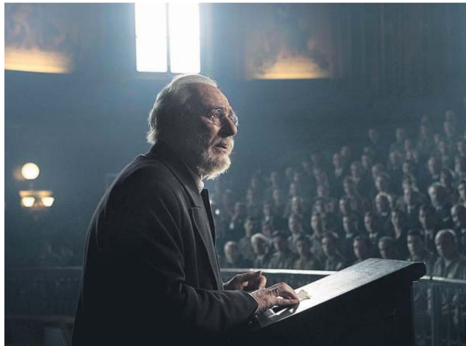
Karra Elejalde es Miguel de Unamuno en la nueva película de Amenábar.

Puedes leer muchas más noticias sobre famosos en nuestra edición digital 20minutos.es