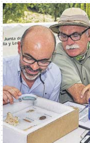
Balance de la campaña, el martes en Atapuerca.

Durante esta campaña, la excavación del nivel TD4 de la Gran Dolina, datado en cerca de un millón de años, ha permitido profundizar en el Mundo antecesor habitado, entre otros, por el Ursus dolinensis , el ancestro del emblemático oso de las cavernas. Destaca especialmente el hallazgo de varias mandíbulas y, singularmente, el primer báculo o hueso peneano recuperado.