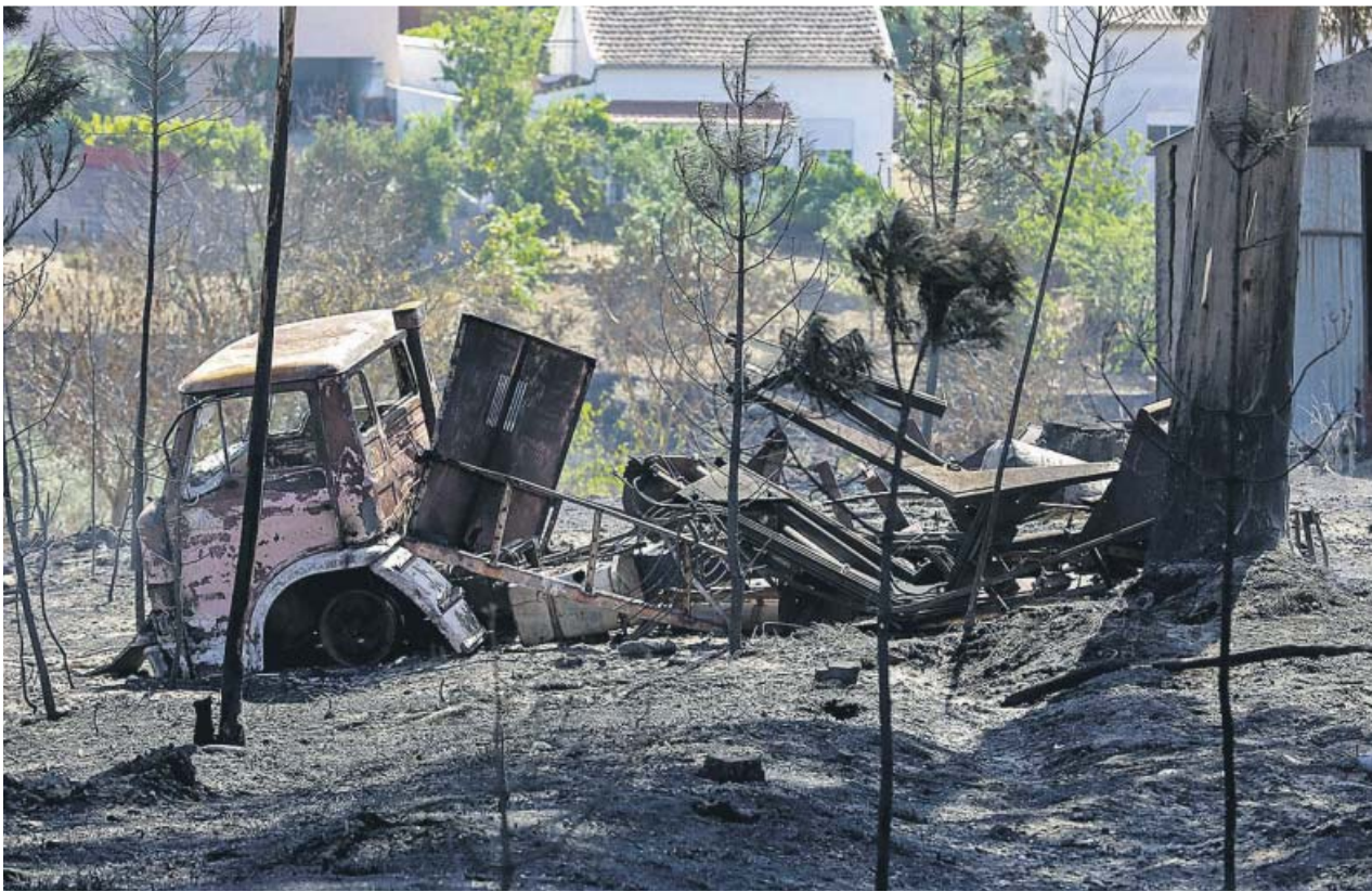
La ola de calor está asfixiando a toda Europa. En Portugal las altas temperaturas también provocaron varios incendios.