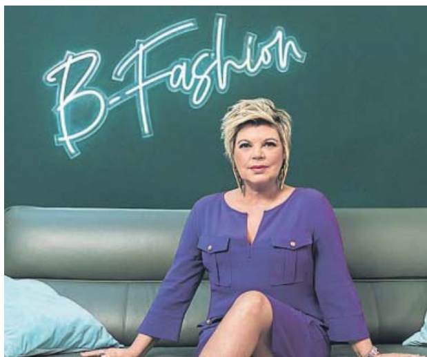
Terelu Campos en una imagen promocional de la serie.

Aunque hubo duras pruebas: «Lo difícil venía cuando ellos te decían 'siguenos' y te empeza-