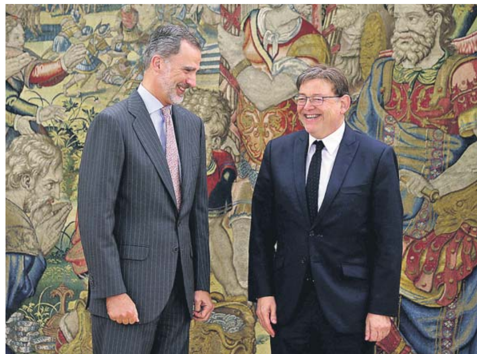
El rey y Puig, ayer, antes de la reunión en el Palacio de la Zarzuela.

En la reunión, Puig expuso al monarca la «urgente necesidad» que tiene la Comunitat de que se acometa la reforma del modelo de financiación autonómica para «proteger el estado de bienestar y garantizar la igualdad entre los españoles». El máximo responsable del Consell agradeció además la «voluntad permanente de cooperación, de colaboración y de presencia en la Comunitat Valenciana» mostrada por el rey, así como su implicación en los grandes proyectos que se impulsan desde ella. «La Comunitat Valenciana necesita más visibilidad y el rey nos ayuda» en este objetivo, afirmó tras el encuentro. ●