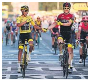
Bernal cruza la meta de París junto a Thomas.

Colombia ya figura en el palmarés del Tour de Francia con letras de oro gracias a Egan Bernal, la nueva sensación del ciclismo internacional, que ayer cumplió su sueño de convertirse en el primer ciclista colombiano en cruzar la meta de los Campos Elíseos vestido de amarillo. Lo hizo sonriente y de la