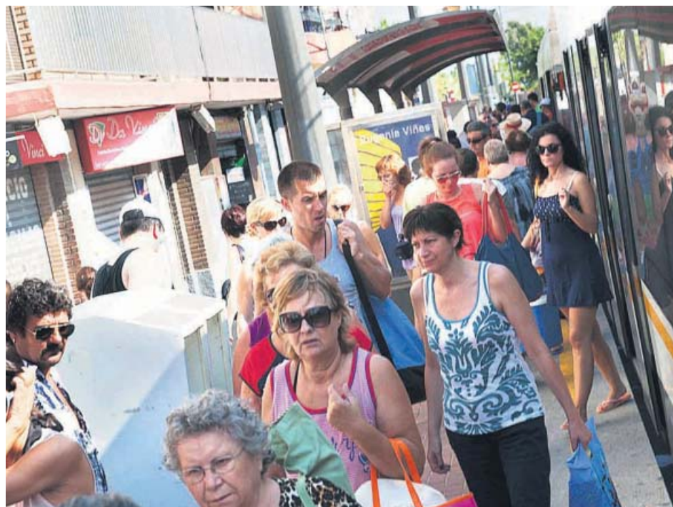
La Generalitat ha dado servicio ferroviario a más de 41 millones de viajeros en seis meses. GENERALITAT

El PP anunció ayer que defenderá una moción en el Pleno para que el Consistorio muestre «un apoyo claro e inequívoco» a la ampliación del acceso a València por la V-21 desde el norte de la ciudad. Además, pedirá que se inste al Gobierno central a «continuar con las actuaciones previstas».