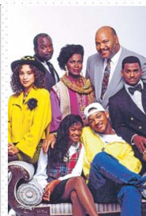
La familia protagonista de El príncipe de Bel-Air . NETFLIX

Si bien Smith se reveló aquí como un actor muy solvente (y no solo cómico), el show no sería lo mismo sin los secundarios, empezando por James Avery como el tío Phil. Asimismo, su humor amable da envoltorio