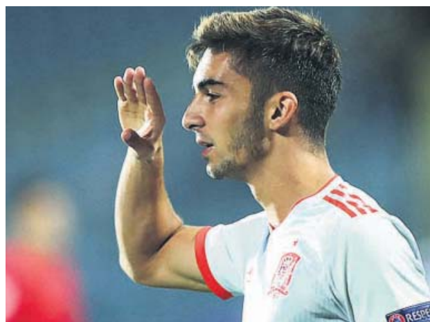
Ferrán Torres celebra un gol en la final del Europeo sub-19.

El extremo valenciano ha sido el líder de la selección dirigida por Santi Denia y sus actuaciones han confirmado las expectativas generadas por un futbolista que la pasada temporada ya disputó 37 partidos oficiales con el Valencia. Junto a Ferran, el Valencia ha contado con otro activo en la sub-19, pues Hugo Guillamón ha sido titular en el eje de la defensa.