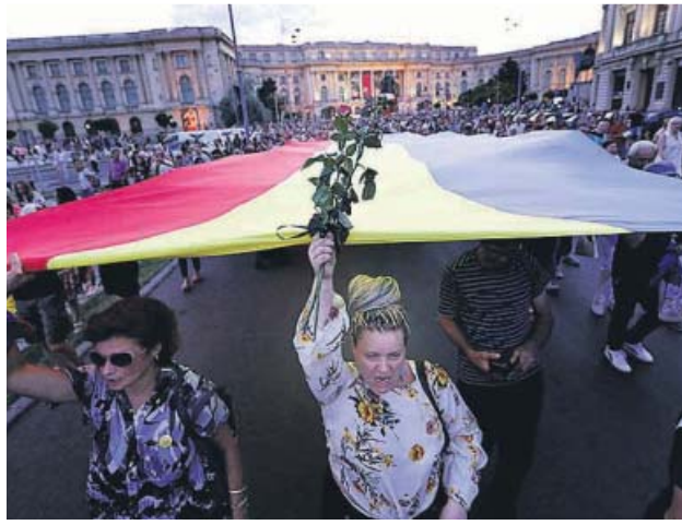
Protestas en las calles de Bucarest contra la Policía del país.