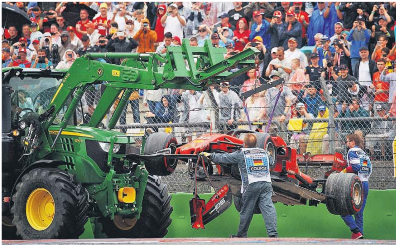
Una grúa retira el Ferrari de Charles Leclerc, uno de los muchos accidentes que hubo ayer en Hockenheim.

Tampoco fue el día de Mercedes, que celebraba su 125 aniversario en competiciones de motor, pero vivió su peor fin de semana en más de un año. Lewis Hamilton, primero hasta que empezó a complicarse la carrera, acabó undécimo y Valtteri Bottas, empujado contra el muro. «Ahora mismo me siento horrible, tengo ganas de irme a casa», fue el balance del líder del Mundial, que subió al puesto 9 gracias a una sanción por carrera a los Alfa Romeo. ●