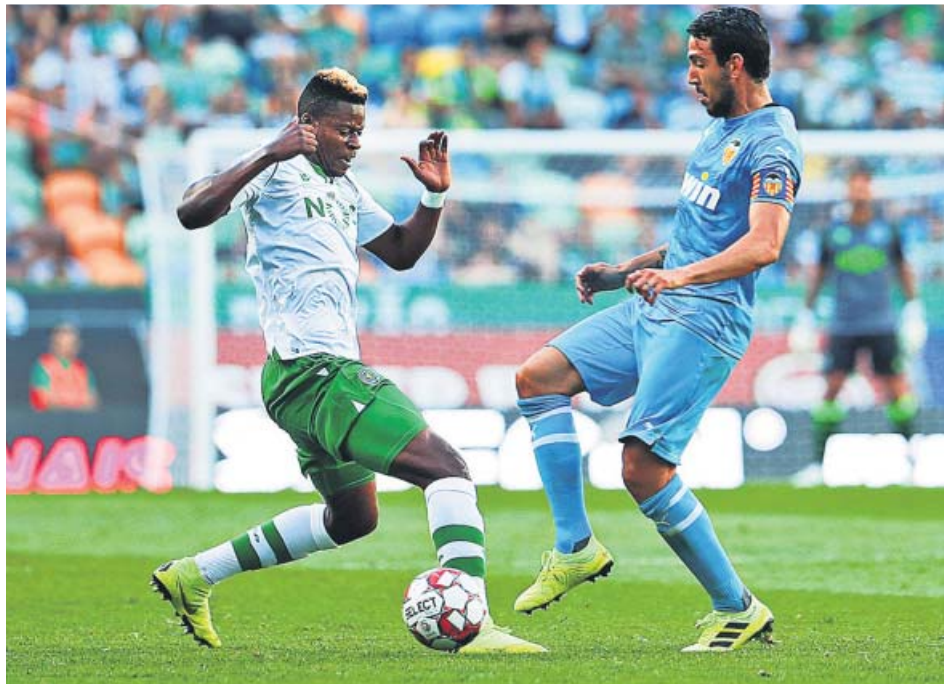
Dani Parejo ante Doumbia en el partido entre Valencia y Sporting.

Sin embargo, apenas cuatro minutos más tarde, en el nueve, el conjunto de Marcelino García Toral logró igualar el encuentro con un tanto de Geoffrey Kondogbia.