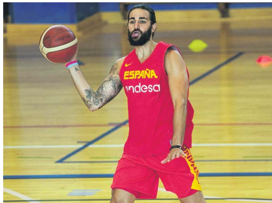
Ricky Rubio en el entrenamiento de ayer de la selección española de baloncesto.

Marc Gasol, Willy y Juancho Hernangómez y Ricky Rubio ya están al 100% a las órdenes de Sergio Scariolo tras haber superado las restricciones impuestas por la NBA para estos primeros días de concentración con la selección española de cara al Mundial de basket. «Tenemos que poner el objetivo muy alto, conseguir medallas», afirmó ayer Ricky, nuevo base de los Suns. «No tenemos que pensar en los que no están, somos los que estamos aquí», añadió sobre las importantes bajas. ●