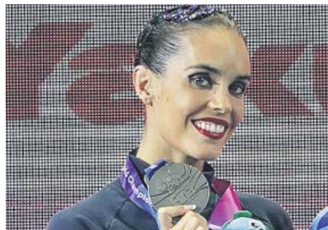
Arriba: Mireia Belmonte tras competir en los 400 metros estilos. Abajo: el waterpolo (izquierda) logró dos platas en chicos y chicas, y Ona Carbonell (derecha) se llevó tres medallas.

R. D. deportes@20minutos.es / @20mDeportes