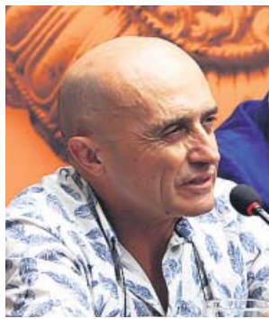
El actor Pepe Viyuela, ayer en la presentación. EFE

La obra se podrá ver desde mañana hasta el 11 de agosto (excepto el día 5) y las entradas se pueden adquirir en taquilla, por teléfono y en la web del festival, desde 12 euros. ● EFE