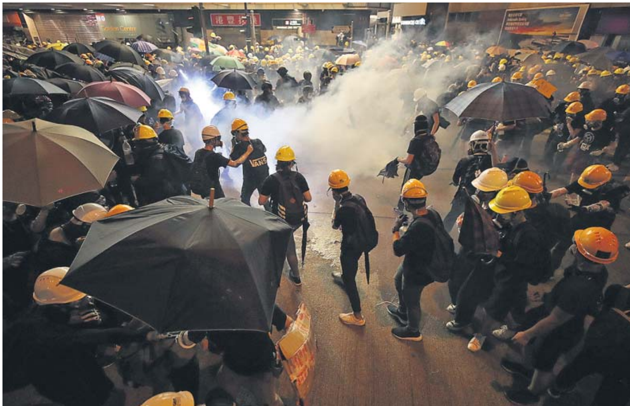
Los manifestantes utilizaron todo tipo de objetos contra la policía durante las últimas protestas en Hong Kong.

empresa de vigilancia Premier Services, por Élite Taxi y el grupo Patrulla Ciudadana, que alerta de la presencia de carteristas en el metro. La entidad reunió el pasado sábado en Ciutat Vella a más de 400 personas entre vecinos, comerciantes y hoteleros. En el acto se anunciaron las acciones previstas, entre ellas, una protesta durante las Festes de la Mercè, a finales de septiembre. Para Batlle, no «puede existir una autoorganización en un tema tan sensible que es responsabilidad de las administraciones». ●