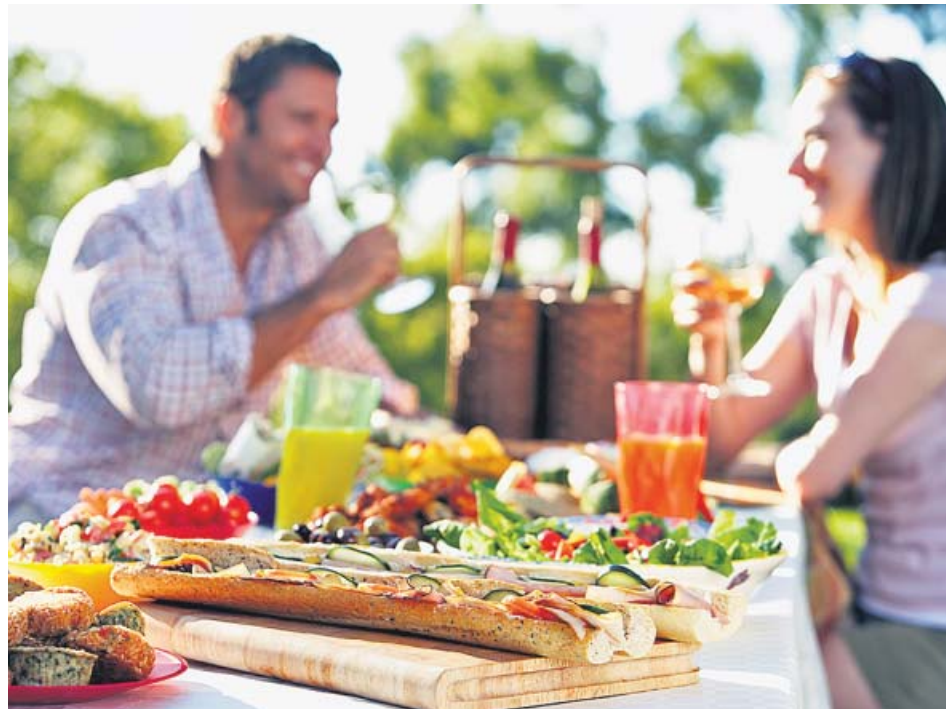
Una pareja comiendo en la terraza de un hotel durante sus vacaciones estivales.

Una intoxicación puede deberse a la presencia de microorganismos en los alimentos, o toxinas de los microorganismos, por parásitos o por intoxicaciones quí-