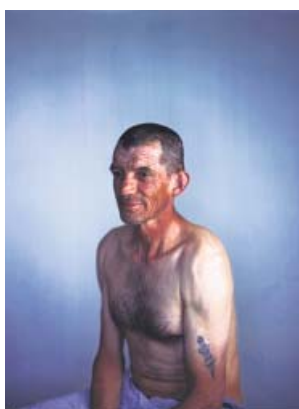
Arriba, Los pecados del padre (2016). Debajo, Superviviente (2011, izda.) y Gemela I (2012).