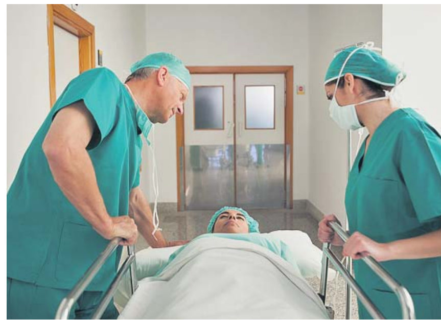
Es una cirugía que se suele realizar con anestesia local y no necesita ingreso.

Para Leary, los bodegones no representan frutas, objetos de lujo o manjares sobre una mesa. Él dispone figuras tan estremecedoras como una cabeza de caballo, un cisne muerto suspendido en el aire por hilos o dos organismos cosidos como los de su obra Corazón de pez . ●