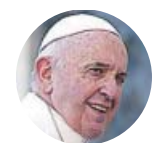
PAPA FRANCISCO Máximo responsable de la Iglesia Católica

«Cualquier forma de prostitución es una reducción a la esclavitud, un acto criminal, un vicio repugnante»