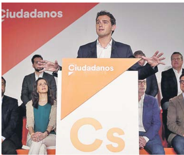
Albert Rivera, ayer durante su discurso en el Consejo General de Cs.