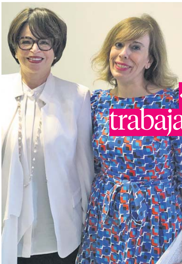
Valerie Jarrett (izda.), con la autora de la entrevista.

Valerie Jarrett, asesora de Obama en la Casa Blanca, habló con Inspiring Girls y 20 minutos en Nueva York, durante el Ellevest Network