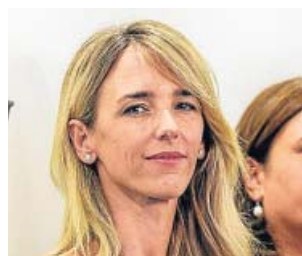
Cayetana Á. de Toledo Portavoz en el Congreso

Fue la número uno de la lista por Barcelona en las elecciones del 28-A. Presidenta de Libres e Iguales, se trata de la gran apuesta de Pablo Casado.