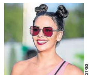
Una chef muy especial.

La madreleña terraza del Hotel Bless será testigo de un showcooking donde la presentadora preparará dos platos en directo, siempre con Rodolfo Langostino como principal ingrediente y con los que dejará claro que sus sueños gastronómicos no son casualidad. ●