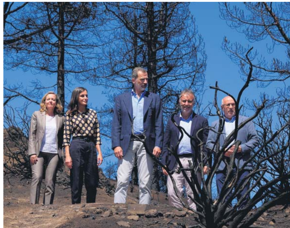
Los reyes conocieron ayer los daños del incendio de Gran canaria del pasado agosto.

La Ertzaintza comunicó que continuará con la investigación hasta esclarecer los hechos cometidos en el piso de la capital vizcaína. ●