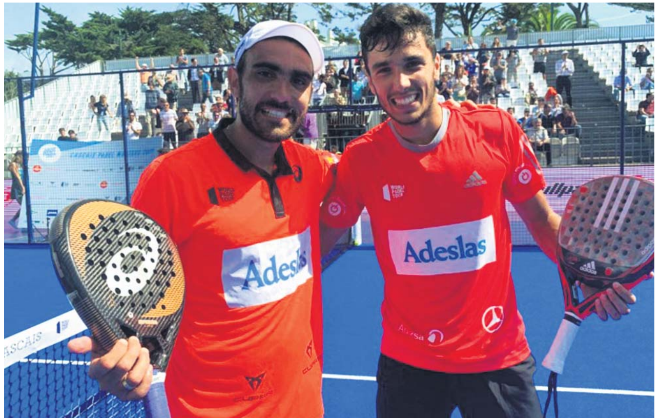
Pablo Lima (izquierda) y Alejandro Galán (derecha) tras su victoria en Cascais.