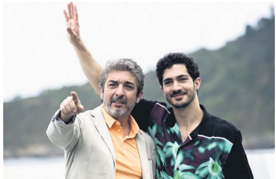
Ricardo Darín y su hijo Chino, ayer en el Festival de San Sebastián.

odisea de los giles sucede en un pueblo. Allí, un grupo de agricultores crea una cooperativa, cada uno con lo que puede aportar, para comprar una antigua fábrica y recuperar su vida laboral. Justo en el momento en que van a concretar