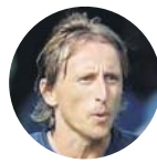
Luka Modric Lesión muscular aductor pierna der.