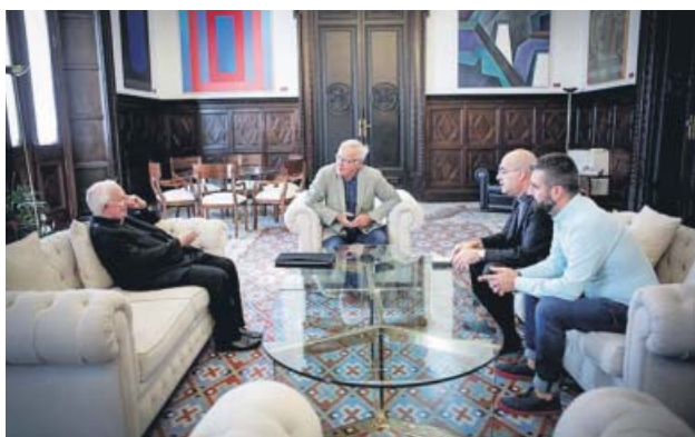
El cardenal Cañizares, ayer, junto a Ribó, en Alcaldía.

tamiento. En el inmueble, ubicado en la plaza de Alfonso el Magnánimo (el conocido como chalé del Parterre), también se pueden tramitar las licencias de obra, comunicar actividades inocuas o pedir licencias de rótulos y lonas publicitarias, así como información municipal. El horario es de 8.30 a 14.00 horas, de lunes a viernes. ●