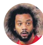
Marcelo Cervicodorsalgia postraumática