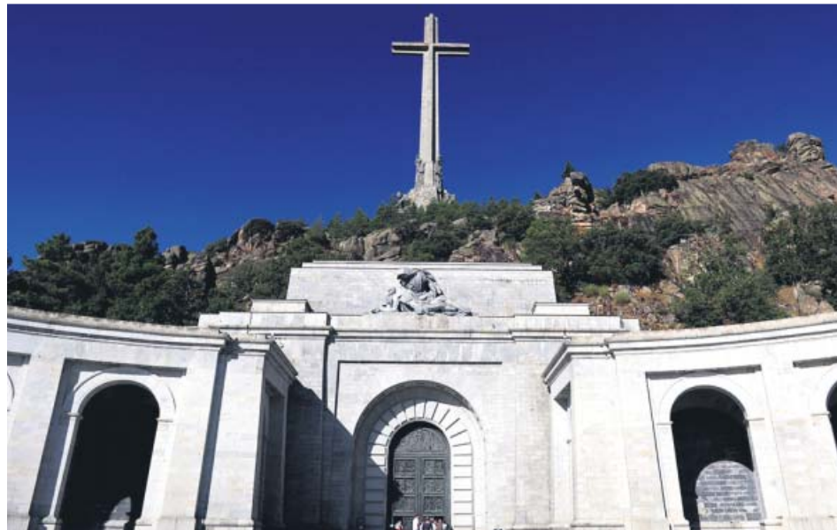
Vista del Valle de los Caídos, donde se encuentran los restos de Franco.

Después de más de un año de cruzada, la decisión del Supremo llega tres meses después de que se paralizara el proceso de traslado, previsto por el Ejecutivo para el 10 de junio.