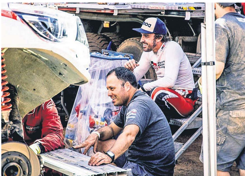
Alonso compartió ayer esta imagen durante la reparación de su coche.

SEGUIRÁ Todo hace indicar que, pese a los problemas del coche, hoy seguirá en la competición