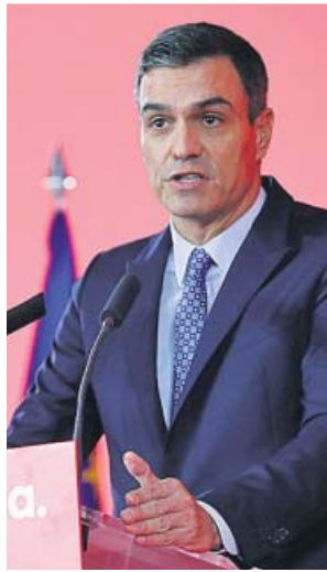
Sánchez, en la presentación de su programa electoral.

Respecto a las exigencias de Pablo Iglesias para formar un Gobierno de coalición, afirmó que tras las elecciones de abril le ofreció «una coalición y tres ministerios», pero «escuchando a Iglesias las últimas semanas, como ellos conciben la coalición es inviable». «Nosotros siempre hemos estado dispuestos a llegar a acuerdos; pido una dosis de responsabilidad a los partidos para que permitan la gobernabilidad», contestó Sánchez a la pregunta sobre si lo que quiere es que, si gana de nuevo, le voten «gratuitamente».