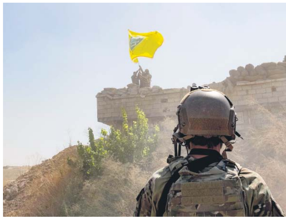
Un soldado estadounidense observa a miembros de las fuerzas sirias.

Didier Queloz Nacido en 1966 en Ginebra (Suiza), imparte clases en el Departamento de Astronomía de la Universidad de esa ciudad, trabajo que compagina con el de profesor en Cambridge.