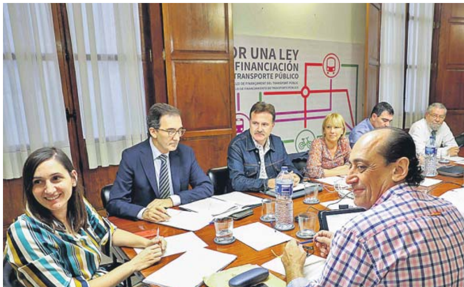
El grupo de trabajo que investiga el fraude en la EMT se constituyó ayer.

pañía pública de autobuses. En su primera sesión, el organismo acordó que se reunirá inicialmente dos veces al mes, «sin perjuicio de que la misma comisión acuerde celebrar más sesiones». La siguiente será la próxima semana para acordar un plan de trabajo y un primer borrador de comparecencias. Hasta ese momento, los partidos podrán enviar sus propuestas, y antes se entregará toda la do-