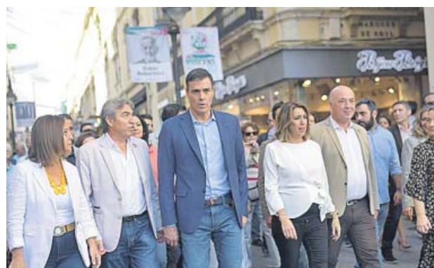
Pedro Sánchez, por las calles de Córdoba.

●●● Casado criticó ayer a Sánchez por haber convertido la subida de las pensiones en un elemento de precampaña, en una «propuesta para arañar unos votos», a pesar de lo cual se comprometió a apoyarla. «Se tienen que revalorizar. Lo que llegue al Congreso, si finalmente deciden hacerlo de forma urgente, contará con el apoyo del PP», dijo.