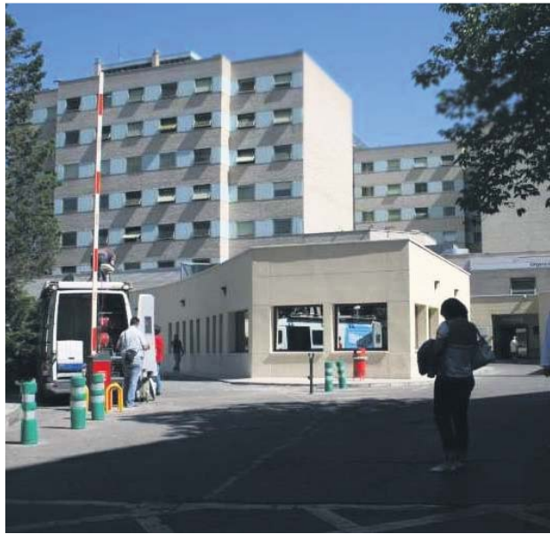
Imagen de archivo del hospital Gregorio Marañón. JORGE PARIS

A las pocas horas de cometer el «error», los efectos adversos no tardaron en manifestarse: «Acidosis metabólica y láctica importante; aumento de la