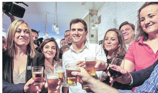
Albert Rivera, en Guadalajara.