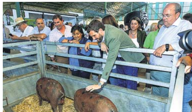
Pablo Casado, en la Feria de Zafra (Badajoz).

con represalias», algo que «no es motivo de preocupación» para Washington ni, dijo, «la forma de negociar». «Cuando lleguemos al Gobierno tendremos una relación privilegiada con Estados Unidos como ha tenido siempre el PP, para poder negociar, dejarnos de soflamas en los mítines y arreglar los problemas del campo para que evitar que se pierdan 1.000 millones», dijo, en alusión a las pérdidas que calcula el Gobierno si los aranceles se fijan definitivamente.