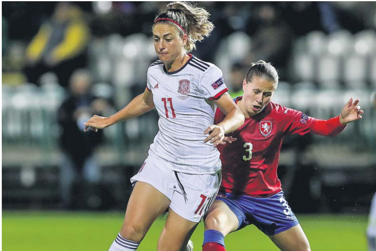
Alexia Putellas en el partido entre España y la República Checa.

España era un vendaval y su dominio no cesó ni con los dos